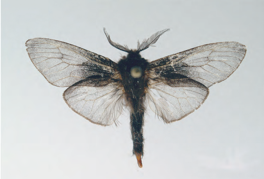
Abb. 1. Clania neocaledonica sp. n. ♂. Holotypus, New Caledonia, South Province, near Lake Yale, Boie de Sud, sclerophyll forest, 200 m, 5.-7. March 2006, on light, leg. J.-P. RUDLOFF & SCHAARSCHMIDT.