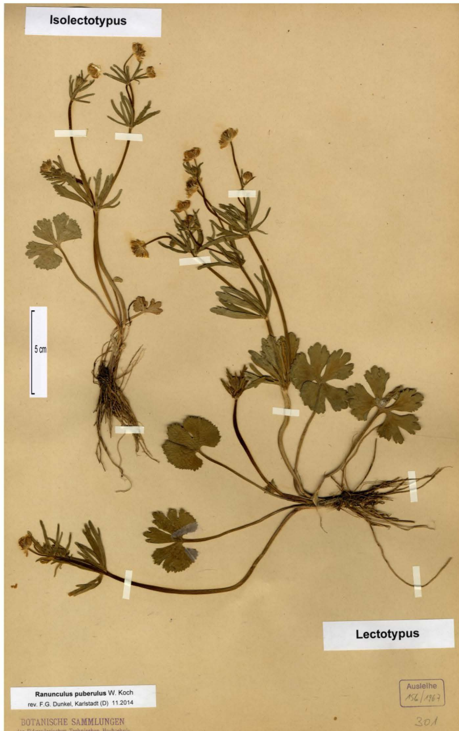
Abb. 1 Lectotypus von Ranunculus puberulus (ZT-156/1967) Fig. 1 Lectotype of Ranunculus puberulus (ZT-156/1967)

Die Chromosomenzahl wurde flowzytometrisch an frischen Blättern bestimmt (Partec CyFlow space). Die Details der Messung sind bei Dunkel, Gregor & Paule (in Vorb.) angegeben. Die Bestimmung der Pollenqualität erfolgt nach Hörandl et al. (1997).