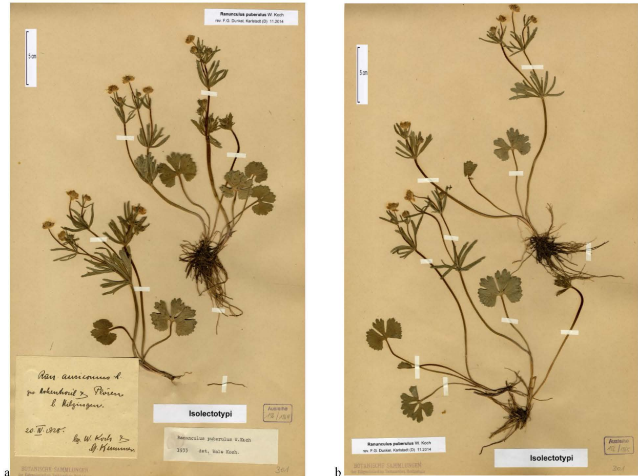
Abb. 2 Isolectotypen von Ranunculus puberulus ZT-156/1964 (a) und ZT 156/165 (b) Fig. 2 Isolectotypes of Ranunculus puberulus ZT-156/1964 (a) and ZT 156/165 (b)

Die Herbar-Akronyme folgen Thiers (2011); das Herbarium des Verfassers ist mit Du abgekürzt, Lkr. = Landkreis.