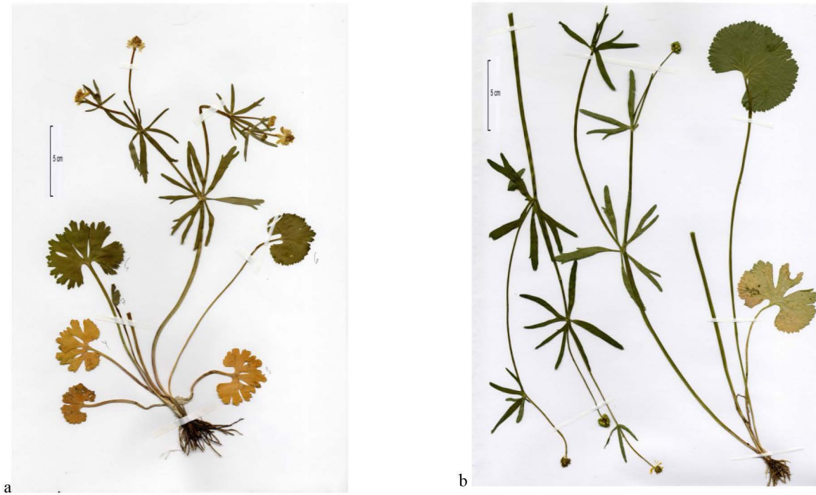
Abb. 4 Herbarbelege der Typuslokalität Du-10841-12 (a) und Du-30415-2 (b) Fig. 4 Specimen of the type locality Du-10841-12 (a) und Du-30415-2(b)