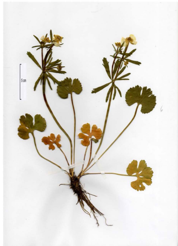
Abb.3 Herbarbeleg der Typuslokalität Du-10841-13 Fig. 3 Specimen of the type locality Du-10841-13

Im Gegensatz zur verbreiteten Meinung und der Auffassung Walo Kochs – „die Art scheint in Mitteleuropa weit verbreitet zu sein“ (Koch 1933: 745) – handelt es sich