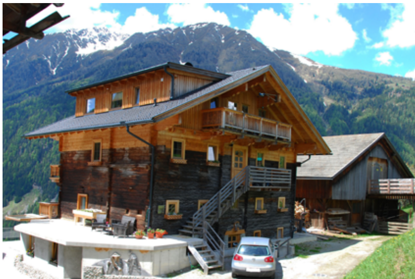
Abb. 2: Huters Geburtshaus, der Halaus-Hof heute (2014).