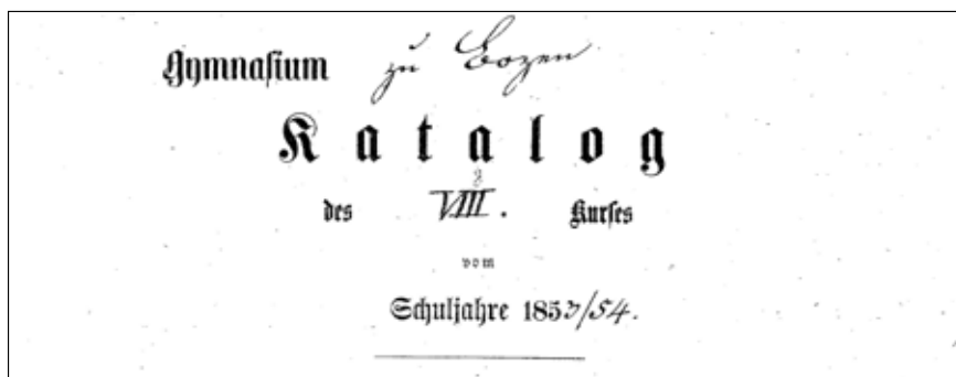
Abb. 3: Auszug aus Huters Zeugnis der Abschluss-Klasse am Franziskaner Gymnasium in Bozen 1853-54.