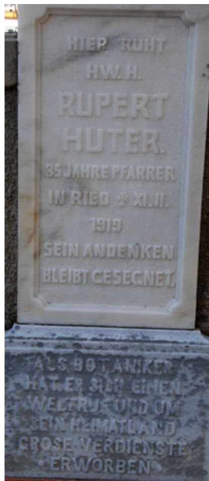
Abb. 4: Grabstein von Rupert Huter am Friedhof von Ried (Sterzing).

Ried bei Sterzing sollte die letzte Dienststelle des Rupert Huter bleiben; er starb dort am 11. Februar 1919 und wurde auch dort begraben (Abb. 4).