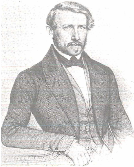
Abbildung 1: Hermann von Nördlinger.

Mit der Zeit wurden Nördlingers Querschnitte eine Sammlung, die die Verschiedenartigkeit und Vielfalt der Anatomie von Hölzern aus aller Welt präsentierte. Auf den ersten Band von 1852 mit hundert Holzarten folgten bis 1888 10 weitere Bände mit jeweils 100 Dünnschnitten, es waren dem Interessierten also insgesamt 1100 Holzarten auf kommerziellen Wege zugänglich.