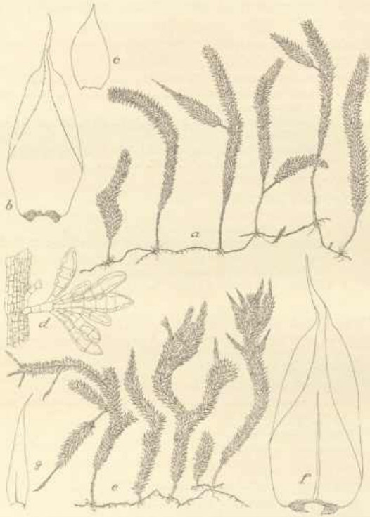
Fig. 1. Pterobryopsis gedehensis Fl.

gelbgrünlichen, angepreßten Niederblättern und mit kleinen Büscheln glatter Rhizoiden besetzt. Sekundärer Stengel gerade bis verbogen, aufrecht, einfach oder nur einmal geteilt, bis 6 cm hoch, entfernt sprossend, im Querschnitt rundlich elliptisch, ohne Zentralstrang,