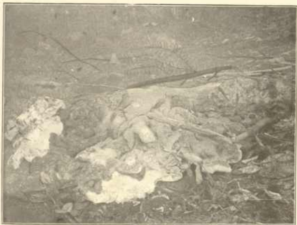
a) Polyporus montanus Quél.

An den Wurzeln der großen Tanne bei Bayr. Eisenstein; überwächst Holzteile und Preiselbeeren. Vorn (weißer länglicher Fleck) ein Stück abgeschnitten, um das Fleisch und die Porenschicht zu zeigen.