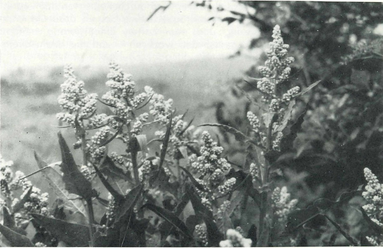
Abb. 3. Beta corolliflora ZOS. bei Blasbach: Habitus, Blütenstände, Chromosomen.