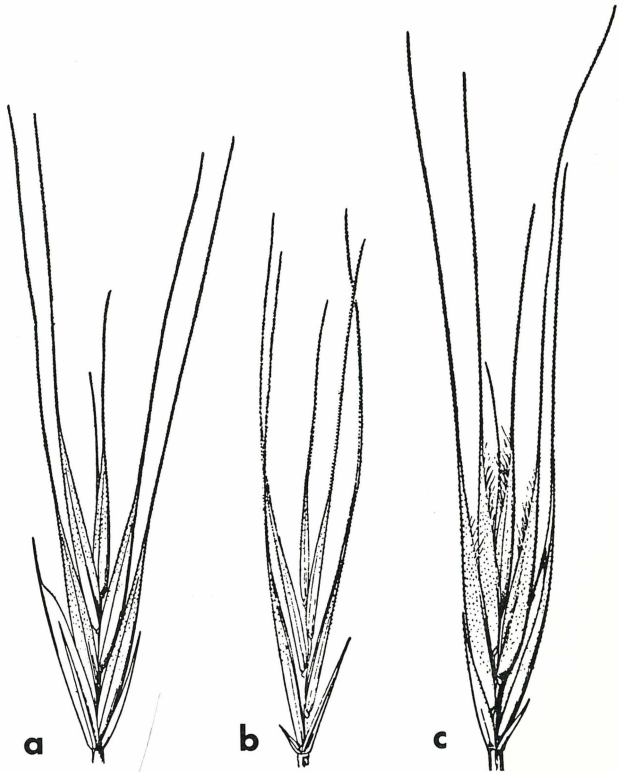
Abb. 3. Ährchen von Vulpia bromoides (a), V. myuros var. myuros (b) und V. myuros var. hirsuta (c). Abbildungsmaßstab 4:1 (nach HITCHCOCK 1951).

Die Tab. 2 gibt die Zusammensetzung der Gesellschaften am 25. 5. 1976 wieder. Innerhalb der Kennartengruppe ist deutlich die bereits angesprochene lokale Trennung der Vulpia -Arten erkennbar. Filago -Arten, die der Gesellschaft neben Vulpia ihren Namen gaben, fehlen indessen.