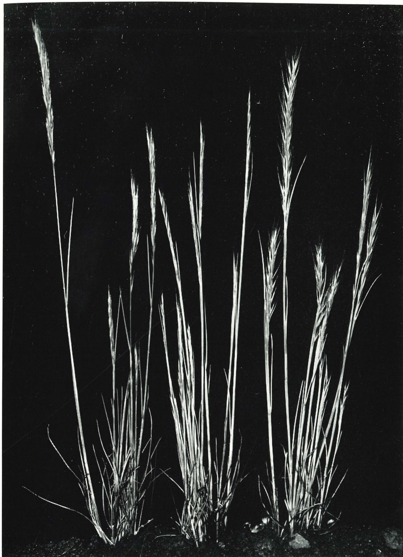
Abb. 1. Vulpia bromoides (links), V. myuros var. myuros (Mitte) und V. myuros var. hirsuta (rechts) bei Budenheim. Dat. 25. 5. 1976. Abbildungsmaßstab 1:2.