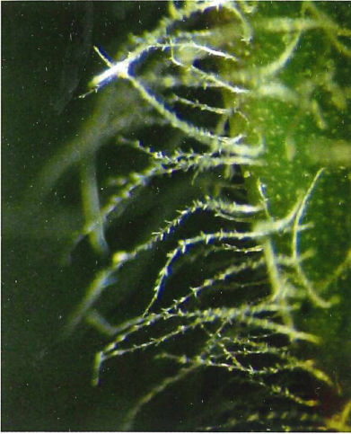
Abb. 2: Hieracium mixtum , gefiederte Haare

haarung (Abb. 1) ähnelt die Art bei oberflächlicher Betrachtung etwas dem Formenkreis der in den Alpen verbreiteten Arten aus der sect. Villosa , unterscheidet sich aber von allen diesen Arten durch fiederig gezähnten Haare (Abb. 2). Auch die gewimperten Ligulazähne (Abb. 3) sind charakteristisch und kommen bei keiner Art aus der sect. Villosa vor.