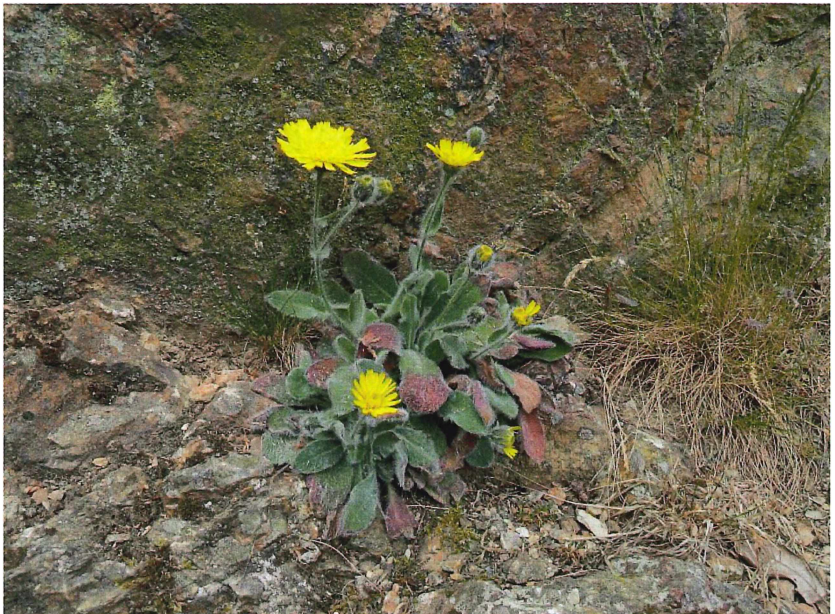
Abb. 1: Hieracium mixtum , Habitus

Hieracium mixtum FROEL. ist eine Gebirgssippe, die auf Kalkfelsen der mittleren und westlichen Pyrenäen und der Cordillera Cantábrica vorkommt, somit eindeutig ein adventives Vorkommen darstellt. In Deutschland wurde die Art 1995 bereits einmal in einem Steinbruch bei Springe im Deister (Niedersachsen) entdeckt, der Fund aber zunächst nicht publiziert. Erst nach einer „Zweitdeckung“ im Jahr 2004 anlässlich der floristischen Kartierung wurde der Fund dann ausführlich mit Artbeschreibung, Abbildungen und einer Arealkarte publiziert (BRÄUTIGAM et al. 2007). Durch die starke Be-