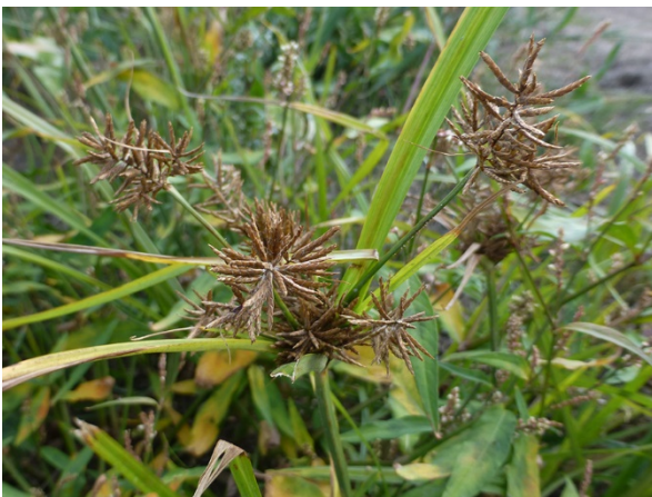
Abb. 29: Cyperus esculentus in Brüggen (N. NEIKES).