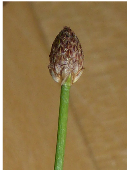
Abb. 40: Eleocharis ovata an der Listertalsperre in Drolshagen (J. KNOBLAUCH).