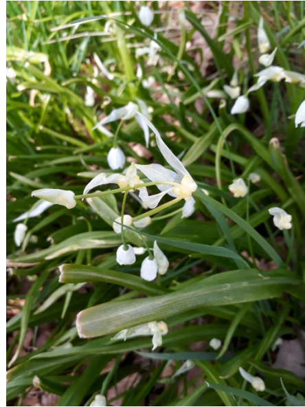
Abb. 2: Allium paradoxum in Velbert.