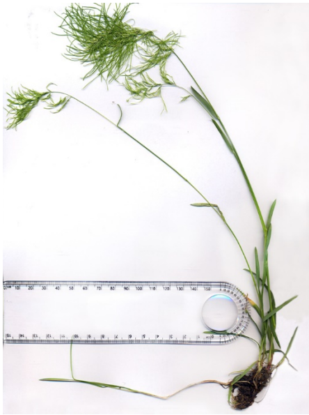
Abb. 77: Poa bulbosa in Solingen-Merscheid (F. JANSSEN).