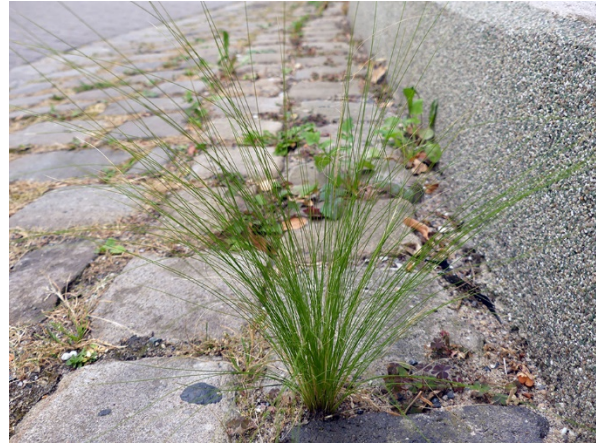
Abb. 94: Stipa tenuissima in Soest (A. SCHMITZ-MIENER).