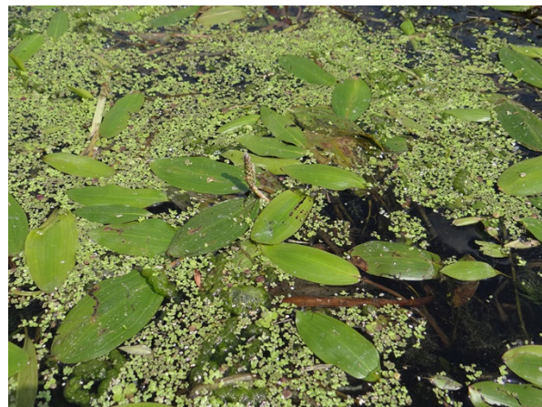
Abb. 80: Potamogeton nodosus in Marl (T. KALVERAM).