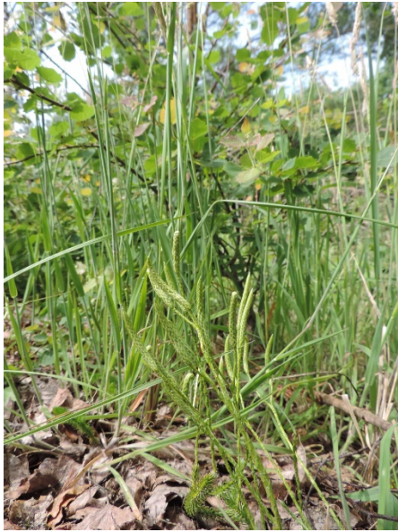
Abb. 63: Lycopodium clavatum in Jülich (R. THEBUD-LASSAK).

Dortmund-Wickede (4411/43): ca. 20 Pflanzen auf einem Acker unmittelbar am Flughafen, 02.08.2018, W. HESSEL. – Duisburg-Mündelheim (4606/13): etwa 20 Pflanzen an einem Ackerrand am Rheinheimer Weg, 02.09.2018, W. HESSEL.