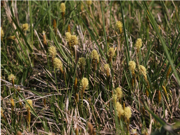
Abb. 15: Carex caryophyllea in Köln-Ossendorf (V. UNTERLADSTETTER).