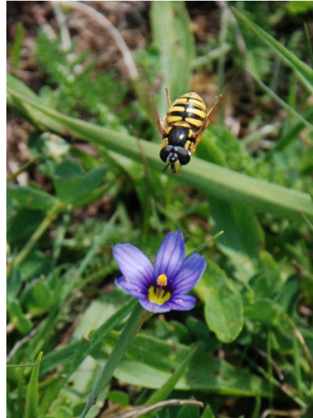
Abb. 90: Sisyrrinchium bermudiana mit Wespenschwebfliege in der Wahner Heide.