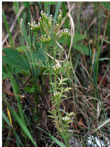
Abb. 18: Centranthus calcitrapae in Willich (R. KIRCHHOFF).