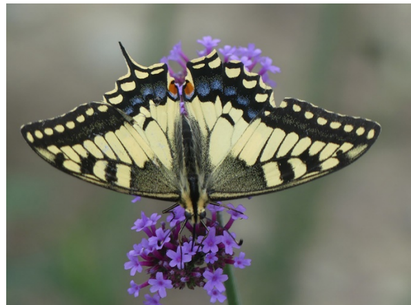
Abb. 98: Verbena bonariensis in Unna-Billmerich mit Schwalbenschwanz.