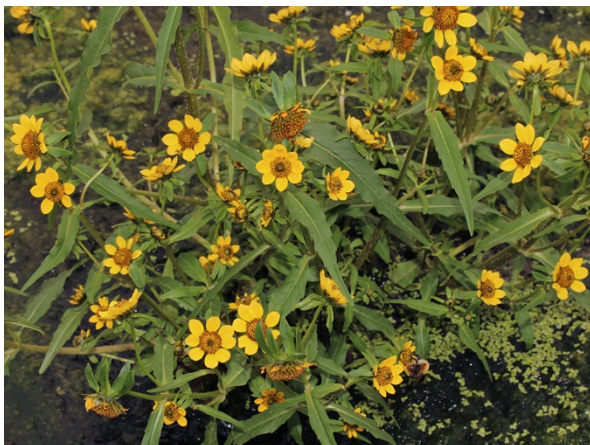
Abb. 9: Bidens cernua in Düsseldorf-Benrath (T. SCHMITT).

Kreis Olpe, Kirchhundem (4915/13): acht Pflanzen am Westerberg bei Oberhundem in 608 m ü. NN, 19.08.2018, T. EICKHOFF. Neu für das MTB. Selten im Kreis Olpe außerhalb des Kalkgebiets. – Kreis Siegen-Wittgenstein, Bad Laasphe (5016/32): mehrfach wenige Pflanzen, meist in Waldinnensäumen, ca. 10 Pflanzen östlich der Straße Butzebach, 07.07.2018, J. KNOBLAUCH (ÖFS).