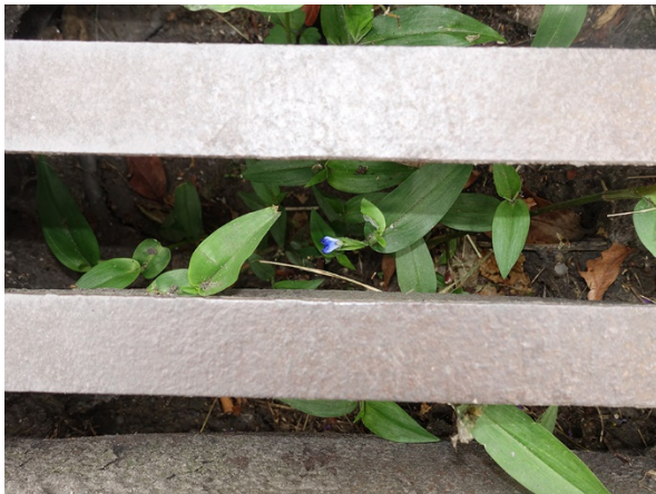
Abb. 25: Commelina communis in Krefeld-Hüls (L. ROTHSCHUH).