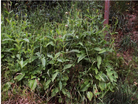
Abb. 33: Dipsacus strigosus in Wuppertal-Frielinghausen (M. LOREK).