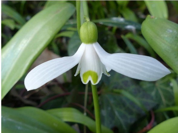
Abb. 53: Galanthus woronowii in Lippetal-Hovastedt (A. SCHMITZ-MIENER).