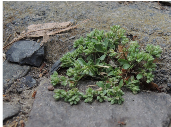
Abb. 78: Polycarpon tetraphyllum in der Bochumer Innenstadt (A. JAGEL).