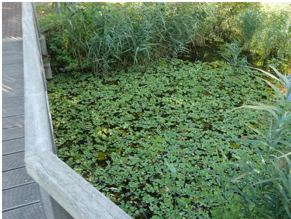
Abb. 75: Pistia stratiotes in Lüdinghausen.

Kreis Coesfeld, Lüdinghausen (4210/23): Tausende Pflanzen in der Gräfte der Wasserburg Lüdinghausen, 06.10.2018, W. HESSEL. – Köln-Porz-Langel (5108/31): mehrere hundert Pflanzen in einem Altarmgewässer, ehemals als Angelgewässer genutzt, vergesellschaftet mit Lemna minor , Lemna minuta , Spirodela polyrhiza , Elodea nuttallii und Ceratophyllum demersum , 26.09.2018, C. KATZENMEIER.