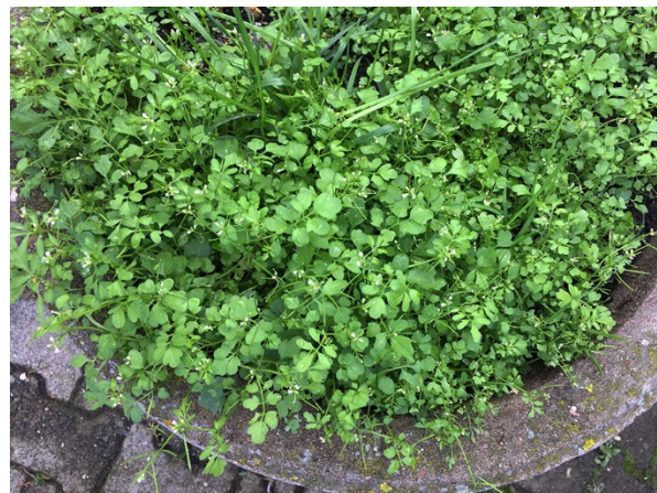
Abb. 14: Cardamine occulta in Rheinbach-Todenfeld (G. REBING).