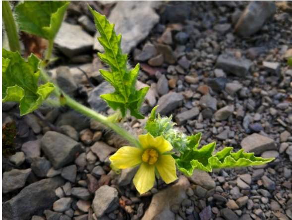
Abb. 23: Citrullus lanatus am Biggeufer in Attendorn (D. WOLBECK).

(4913/11): zwölf Pflanzen an zwei Stellen am südexponierten, steinig-trockenen Ufer der Biggetalsperre bei Weuste, 09.10.2018, D. WOLBECK, J. KNOBLAUCH & T. EICKHOFF. Erstfund im Kreis Olpe (T. EICKHOFF).