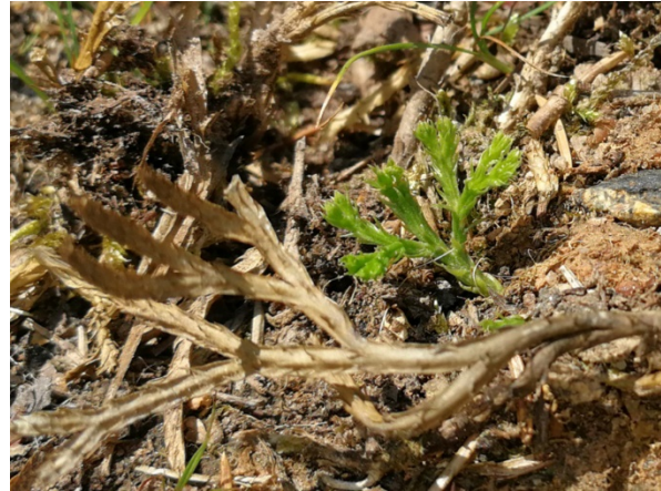
Abb. 32: Diphasiastrum complanatum in Drolshagen (D. WOLBECK).