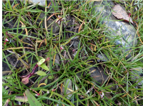
Abb. 62: Littorella uniflora in Solingen-Hörath (F. SONNENBURG).