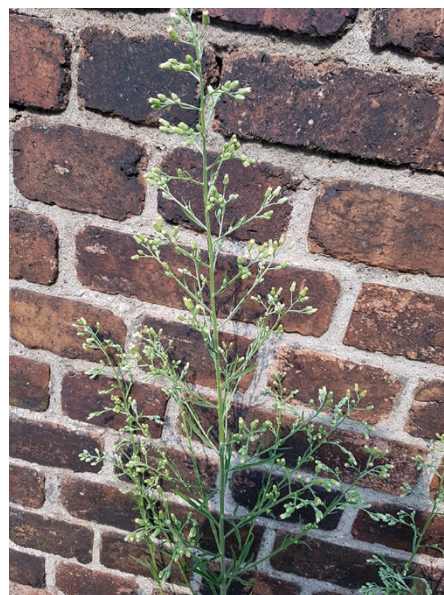
Abb. 42: Erigeron sumatrensis in Herne-Mitte (P. GAUSMANN).