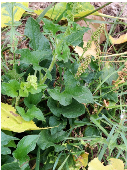
Abb. 19: Chenopodium bonus-henricus in der Pöppelsche in Erwitte (A. JAGEL).

Kreis Olpe, Olpe (4913/13): eine Pflanze auf einer Verkehrsinsel, 17.08.2018, D. WOLBECK.