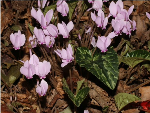
Abb. 27: Cyclamen hederifolium in Bochum-Querenburg.