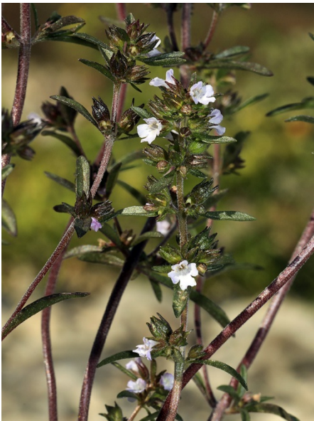
Abb. 85: Satureja hortensis am Rheinufer in Bonn (H. GEIER).