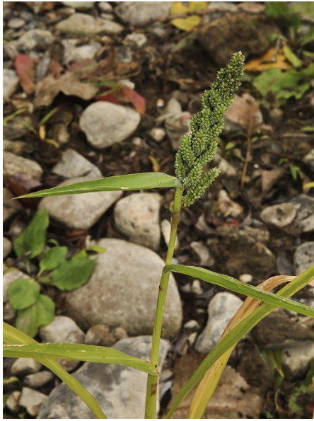
Abb. 37: Echinochloa frumentacea am Rheinufer in Bad Honnef.

18.10.2018, J. KNOBLAUCH & T. EICKHOFF. – An der Listertalsperre seit 1952 bekannt (RUNGE 1990) aber wohl nicht alljährlich auftretend (T. EICKHOFF).