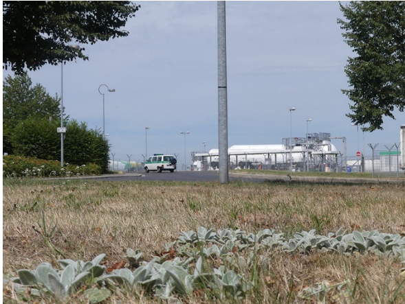
Abb. 93: Stachys byzantina in Dortmund-Wickede (W. HESSEL).