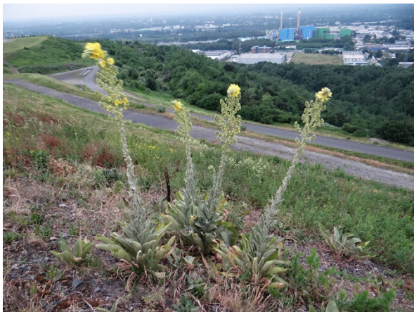
Abb. 97: Verbascum speciosum auf der Hoheward in Herten (T. KALVERAM).

Kreis Unna, Unna-Billmerich (4412/33): sechs Pflanzen in einer Ackerfläche am Weg Lange Jupp, 15.08.2018, W. HESSEL. – Kreis Soest, Werl-Büderich (4413/31): zwei Pflanzen in einem Grünstreifen vor einer Viehweide in der Straße „In der Linde“ 60 m westlich des Sömerwegs, 15.10.2018, W. HESSEL. – Kreis Soest, Soest (4414/23): eine blühende Pflanze in einer Randfuge des Bürgersteigs entlang einer westlich exponierten Bruchsteinmauer in der Wildemannsgasse, 25.10.2018, H. J. GEYER & A. SCHMITZ-MIENER. – Kreis Soest, Wickede/Ruhr (4513/11): einige Sämlinge auf der Kapellenstr. in Höhe des Abzweigs „Am Brauk“, 13.08.2018, J. LANGANKI.