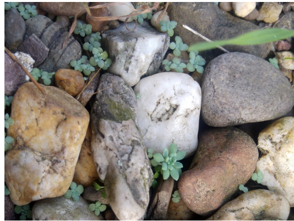
Abb. 88: Sedum hispanicum in Bochum (19.09.2018,).