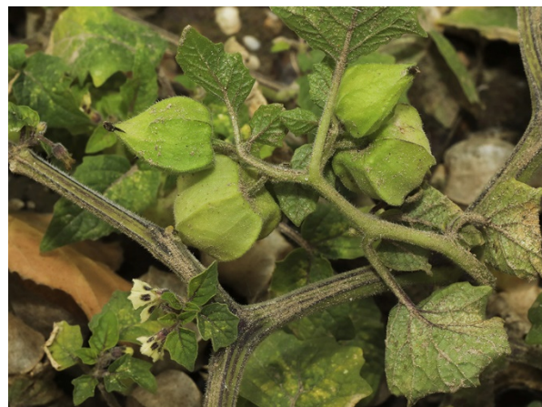
Abb. 74: Physalis grisea am Rheinufer in Bonn (H. GEIER).