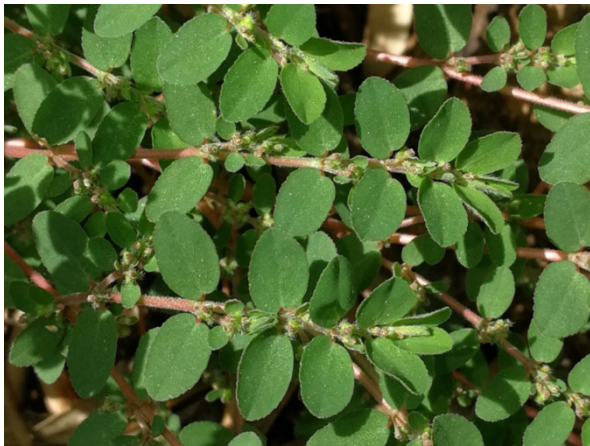
Abb. 49: Euphorbia prostrata in Attendorn (D. WOLBECK).