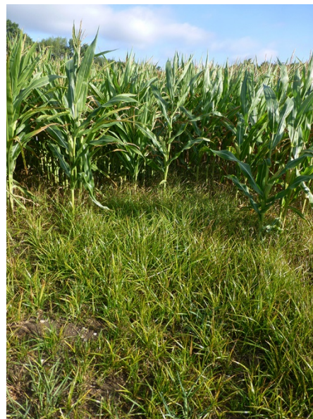
Abb. 30: Cyperus esculentus in Nettetal (N. NEIKES).