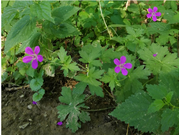
Abb. 55: Geranium palustre in Attendorn.