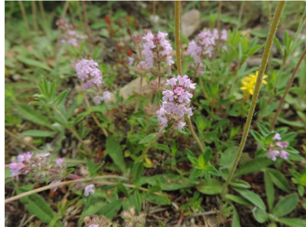
Abb. 96: Thymus pannonicus in Jülich (R. THEBUD-LASSAK).