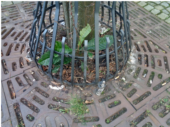
Abb. 43: Eriobotrya japonica in Solingen (F. JANSSEN).

Essen-Frohnhausen (4507/42): eine Pflanze unterhalb der Betonmauer des Mittelstreifens auf der A40 in Fahrtrichtung Bochum, 10.07.2018, C. BUCH. – Außerhalb des Rheintals sehr selten.