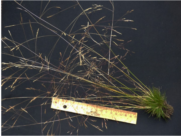
Abb. 1: Agrostis scabra an der Listertalsperre (J. KNOBLAUCH).