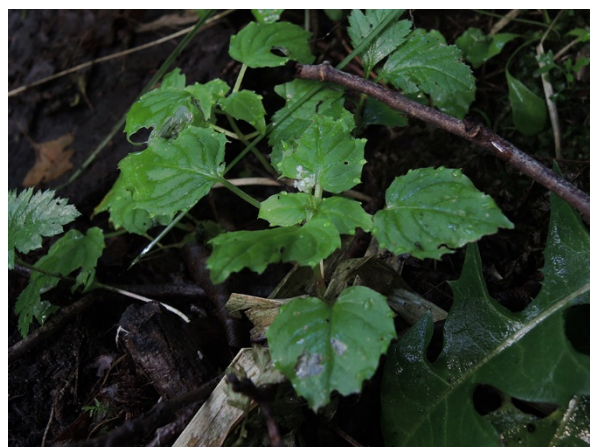
Abb. 22: Circaea alpina in Dorsten (A. JAGEL).