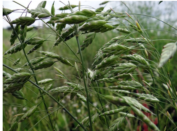
Abb. 12: Bromus secalinus in Essen (T. KALVERAM).