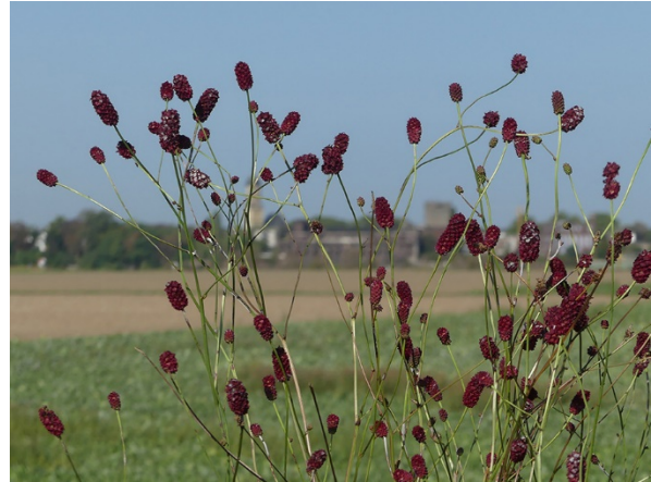
Abb. 84: Sanguisorba officinalis in Duisburg-Mündelheim (W. HESSEL).