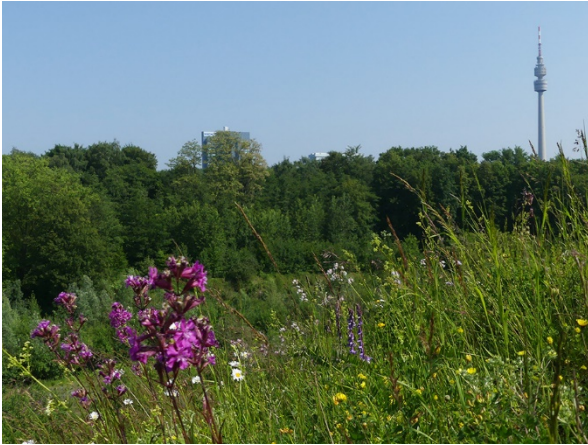
Abb. 99: Viscaria vulgaris in Dortmund-Hörde (W. HESSEL).