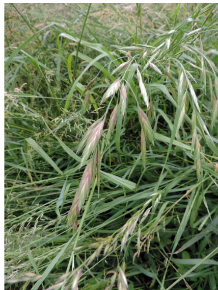
Abb. 10: Bromus catharticus in Leverkusen (R. THEBUD-LASSAK).