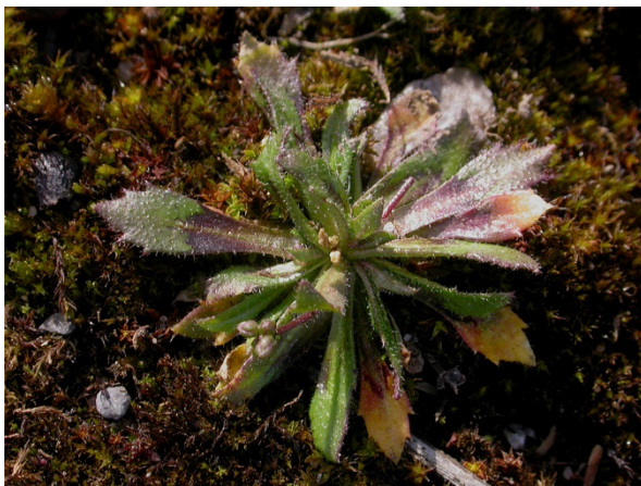
Abb. 35: Draba strigosula in Nideggen-Embken (F. W. BOMBLE).