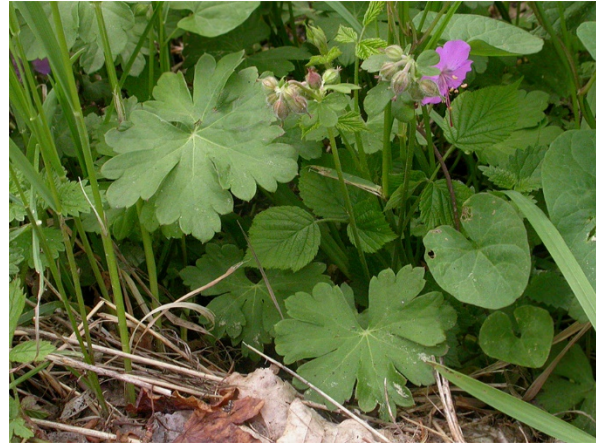
Abb. 54: Geranium x cantabrigiense in Aachen (F. W. BOMBLE).