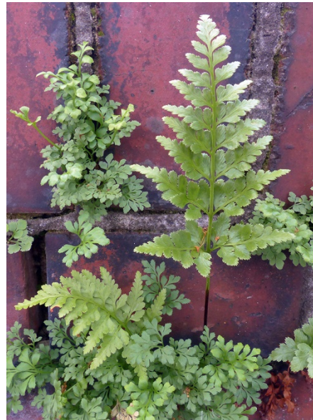
Abb. 8: Asplenium adiantum-nigrum in Hamm-Heessen (G. BOHN).