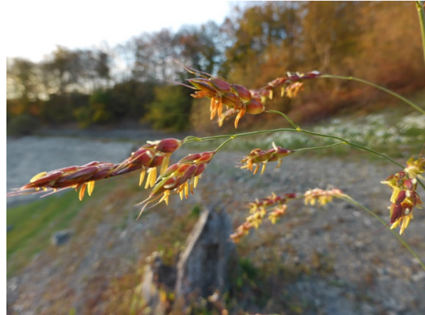
Abb. 92: Sorghum halepense am Ufer der Biggetalsperre.