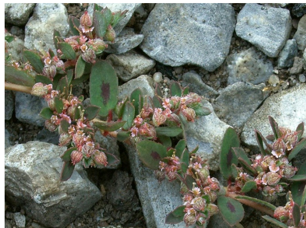
Abb. 46: Euphorbia maculata in Krefeld-Rislerdyk (K. WEHR).