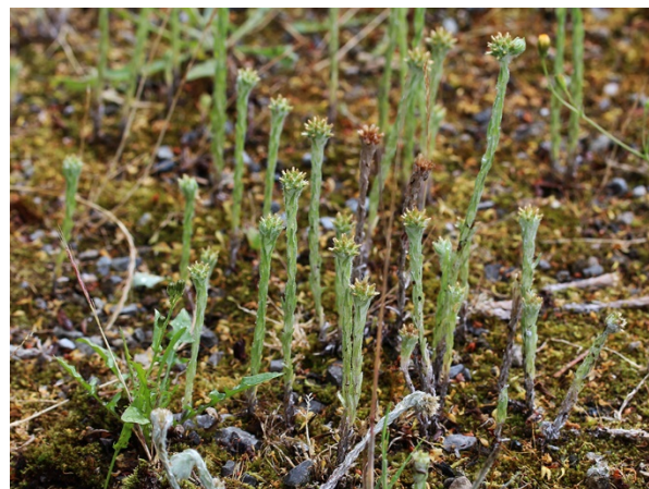
Abb. 52: Filago vulgaris in Essen-Haarzopf (C. BUCH).