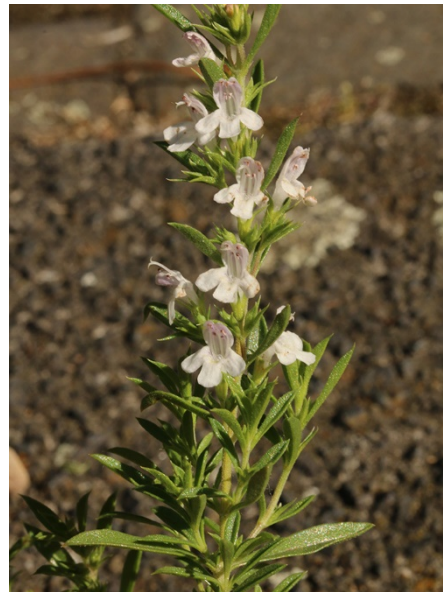
Abb. 86: Satureja montana in Bochum (T. SCHMITT).