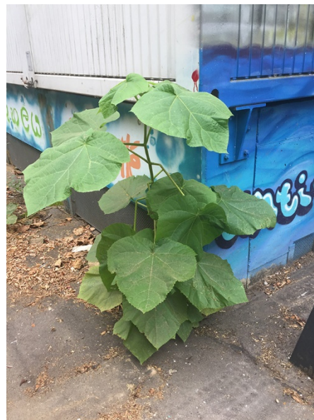
Abb. 72: Paulownia tomentosa in der Kölner Altstadt.