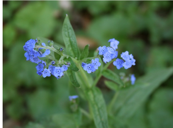
Abb. 28: Cynoglossum amabile in Köln-Niehl (T. FISCHER).