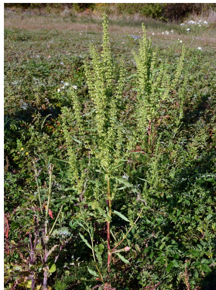
Abb. 82: Rumex stenophyllus an der Biggetalsperre in Attendorn.