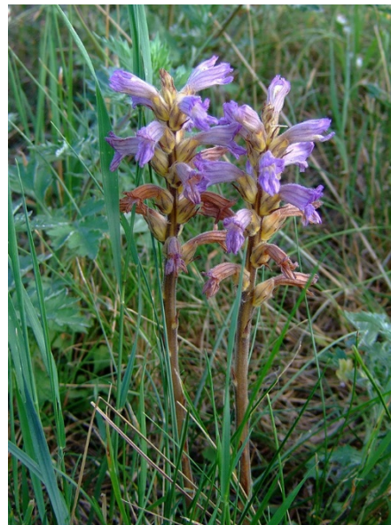
Abb. 70: Orobanche purpurea in Tönisvorst.