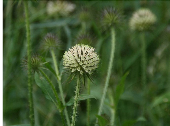
Abb. 34: Dipsacus strigosus in Wuppertal-Frielinghausen (M. LOREK).