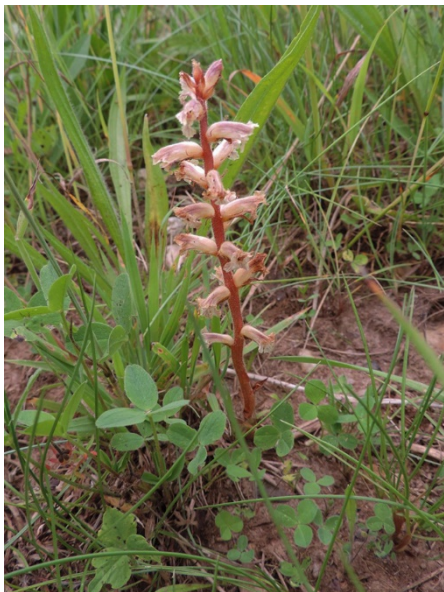
Abb. 69: Orobanche minor in Jülich (R. THEBUD-LASSAK).

Kreis Viersen, Tönisvorst (4604/33): zwei Pflanzen an einem Radweg in Kehn, 19.06.2017, R. KIRCHHOFF.