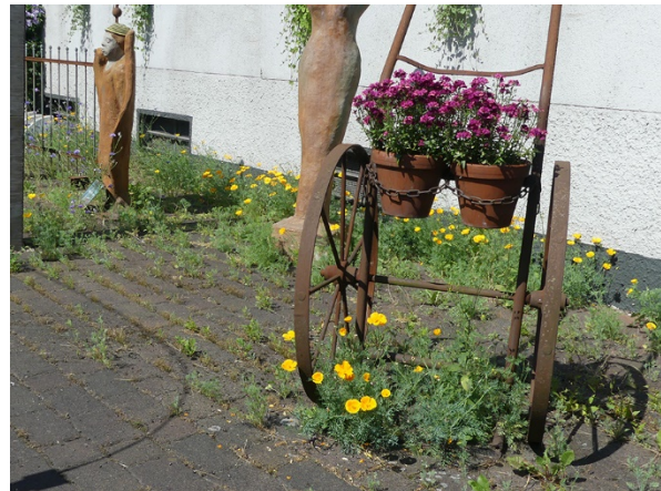
Abb. 44: Eschscholzia californica in Unna (W. HESSEL).