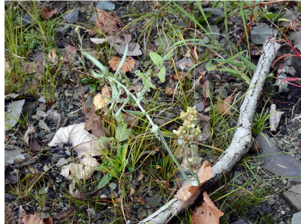
Abb. 56: Helichrysum luteoalbum an der Listertalsperre (M. KLEIN).