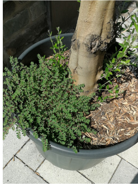
Abb. 48: Euphorbia prostrata in Attendorn (D. WOLBECK).