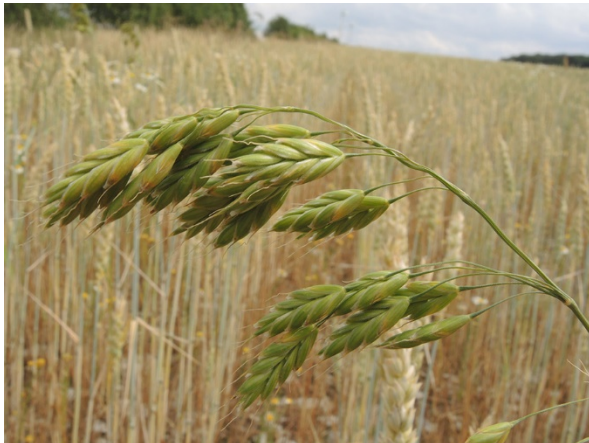
Abb. 11: Bromus secalinus in Geseke (A. JAGEL).

Kreis Soest, Geseke (4317/33): wenige Pflanzen in einem Ackerrandstreifen des Schutzprogrammes für Ackerunkräuter der Geseker Steinwerke, 17.06.2018, A. JAGEL & V. UNTERLADSTETTER (conf. F. W. BOMBLE). – Essen-Westviertel (4507/24): in großer Anzahl auf einer neuen Straßenböschung am Berthold-Beitz-Boulevard, aus Ansaat entstanden, 13.06.2018, T. KALVERAM (conf. F. W. BOMBLE). – Kreis Olpe, Drolshagen (4912/41): ca. 100 Pflanzen am Rand eines Maisstoppelackers bei Sendschotten, 27.09.2018, T. EICKHOFF.