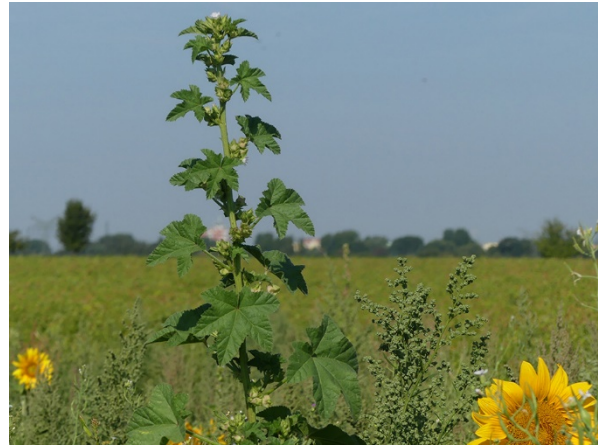
Abb. 64: Malva verticillata in Dortmund-Wickede (W. HESSEL).