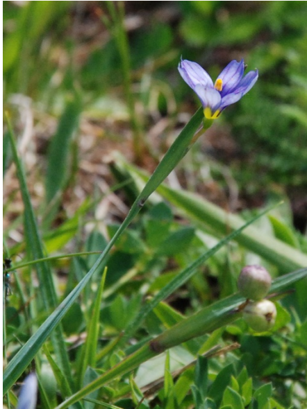
Abb. 89: Sisyrrinchium bermudiana in der Wahner Heide (E. JENSEN).