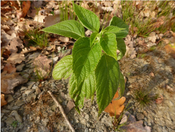
Abb. 83: Salvia hispanica am Ufer der Listertalsperre in Drolshagen (J. KNOBLAUCH).