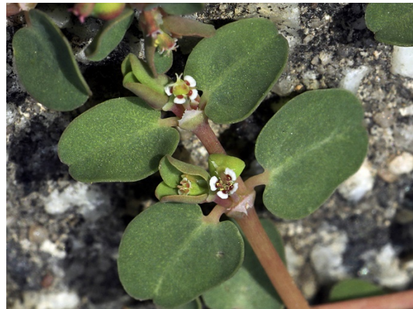
Abb. 50: Euphorbia serpens in Bornheim-Hersel (H. GEIER).