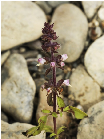
Abb. 67: Ocimum basilicum am Rheinufer in Bonn-Auerberg.