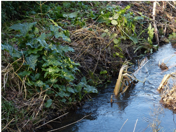
Abb. 7: Arum italicum in Holzwickede (W. HESSEL).

Hamm-Heessen (4213/33): etwa 100 Pflanzen an einer Mauer an der Kleinen Amtsstr., 01.01.2018, G. BOHN. – Dortmund-Mitte (4410/41): eine Pflanze zwischen Dryopteris filix-mas auf mit Beton oder anderem Baumaterial gespeistem Boden auf der Brache des ehemaligen Güterbahnhofs Dortmund an der Westfaliastr., 24.05.2018, D. BÜSCHER. – Dortmund-Mitte (4410/43): ein kleines Vorkommen auf einer Mauer an der Lindemannstr., 13.06.2018, D. BÜSCHER. – Dortmund-Mitte (4410/44): ein kleines Vorkommen zwischen Pflastersteinen an einem Beet am Probsteihof hinter der Probsteikirche, 19.06.2018, D. BÜSCHER. – Kreis Unna, Bönen (4412/21): ein kleines Vorkommen an einer Hauswand am Durchgang von der Fußgängerzone Bahnhofstr. zum großen Parkplatz Oststr., 05.2017, G. H. LOOS.