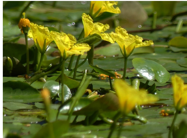
Abb. 66: Nymphoides peltata in Unna-Königsborn (W. HESSEL).