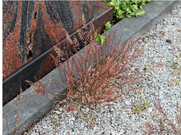
Abb. 16: Catapodium rigidum in Duisburg-Serm (C. BUCH).