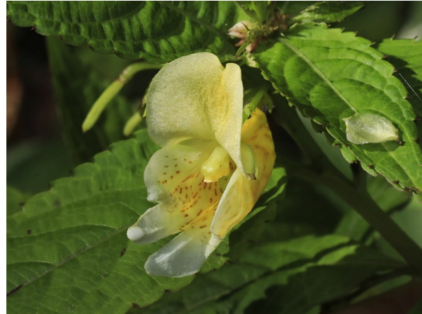
Abb. 58: Impatiens tricornis in Bochum-Querenburg (H. GEIER).