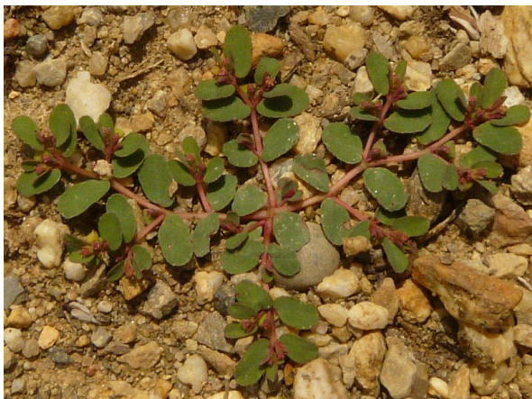
Abb. 45: Euphorbia humifusa in Krefeld (K. WEHR).