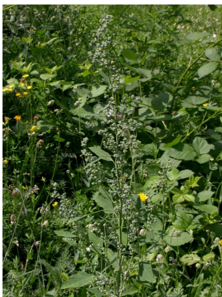
Abb. 21: Chenopodium suecicum in Aachen (F. W. BOMBLE).

Kreis Recklinghausen, Dorsten (4207/41): in einem Sumpfwald in der Bakeler Mark, 08.06.2018, A. JAGEL & I. HETZEL. In diesem Raum bereits früher gefunden (RAABE 1987). Ansonsten im nordrhein-westfälischen Flachland wohl nur noch in der Senne vorhanden (SONNEBORN & SONNEBORN 2018). – Hochsauerlandkreis, Meschede (4615/22): über 100 Pflanzen in einem lichten Buchenwald westlich Stimmstamm, 07.07.2018, J. KNOBLAUCH (ÖFS). Neu für das MTB.