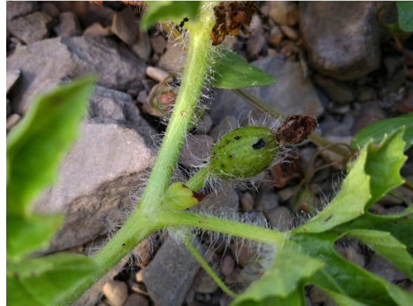
Abb. 24: Citrullus lanatus am Biggeufer in Attendorn (D. WOLBECK).