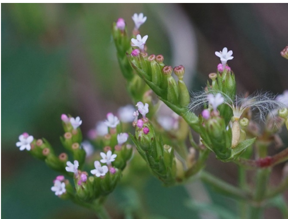
Abb. 17: Centranthus calcitrapae in Willich (R. KIRCHHOFF).