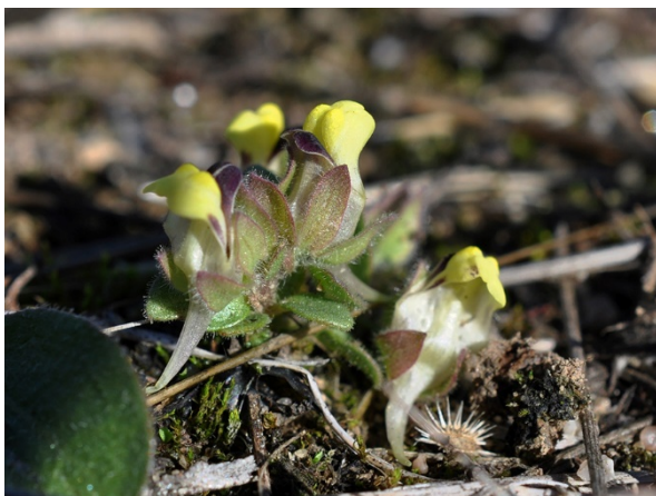
Abb. 59: Kickxia spuria in Köln-Nippes.

Dortmund-Mitte-Nord (4410/42): auf einer Brache östlich der Bornstr., 30.05.2018, D. BÜSCHER. – Bochum-Dahlhausen (4508/42): ca. 15 Pflanzen auf Gleisanlagen des Eisenbahnmuseums Dahlhausen, 28.08.2018, P. GAUSMANN. In diesem Bereich bereits seit mehr als 15 Jahren kontinuierlich beobachtet (JAGEL & al. 2000, A. JAGEL & C. BUCH in BOCHUMER BOTANISCHER VEREIN 2011).