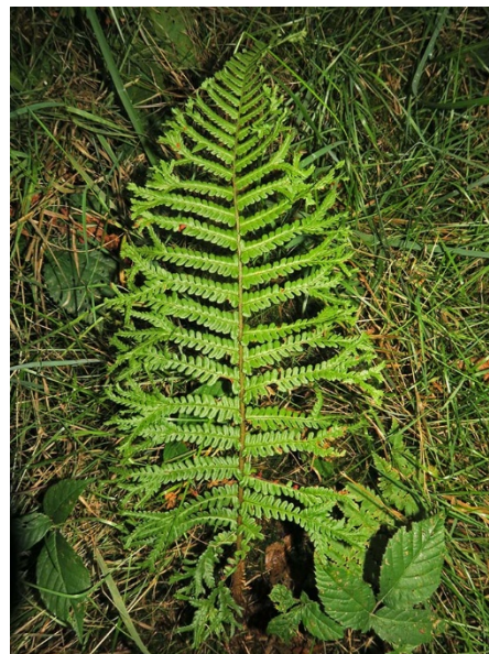
Abb. 36: Dryopteris affinis 'Cristata' in Hagen-Haspe (M. LUBIENSKI).