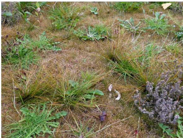
Abb. 39: Eleocharis ovata an der Listertalsperre in Drolshagen.