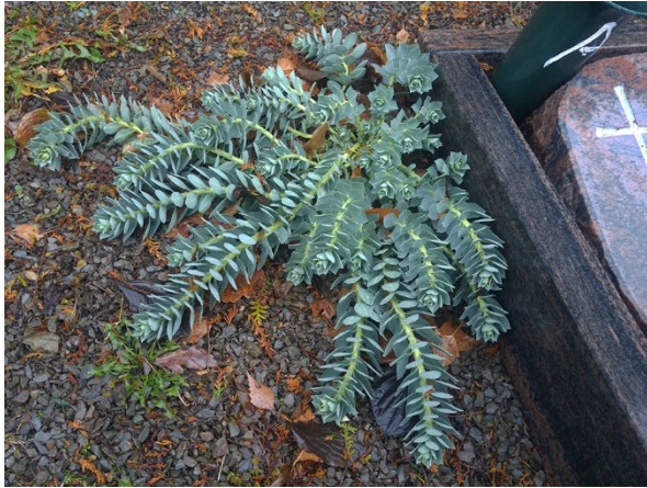
Abb. 47: Euphorbia myrsinites in Lüdenscheid (A. JAGEL).