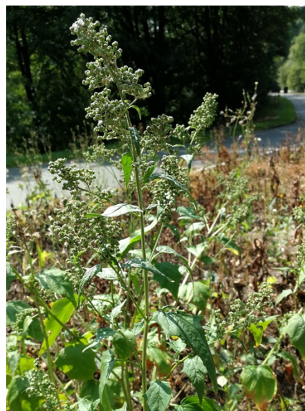
Abb. 20: Chenopodium hybridum in Olpe (D. WOLBECK).