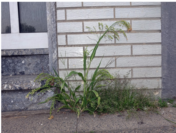
Abb. 71: Panicum miliaceum in Krefeld-Diessem (L. ROTHSCHUH).

Ennepe-Ruhr-Kreis, Herdecke (4510/43): ca. 30 Pflanzen auf dem Waldfriedhof Wienberg, verwildert von einem Grab, 14.07.2018, D. BÜSCHER. – Märkischer Kreis, Neuenrade (4712/21): mehrere Pflanzen zwischen Häusern an der Erste Str., 13.09.2018, M. LUBIENSKI.