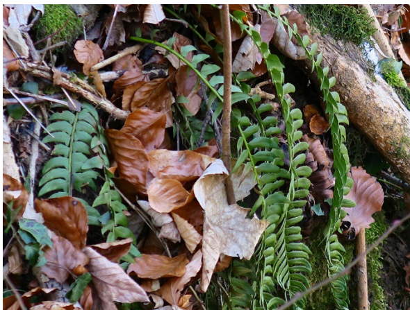
Abb. 79: Polystichum lonchitis in Brilon (M. LUBIENSKI).

Kreis Recklinghausen, Marl (4208/44): wenige m 2 unterhalb der Brücke an der Lippramsdorfer Str., 19.07.2018, T. KALVERAM. – Kreis Recklinghausen, Datteln (4210/33): mehrere m 2 in der Lippe östlich Ahsen, 12.07.2018, T. KALVERAM.