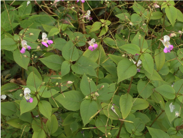
Abb. 57: Impatiens balfourii in Bochum-Querenburg (T. SCHMITT).