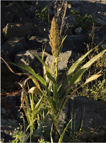
Abb. 91: Sorghum bicolor am Rheinufer in Bonn-Auerberg (H. GEIER).