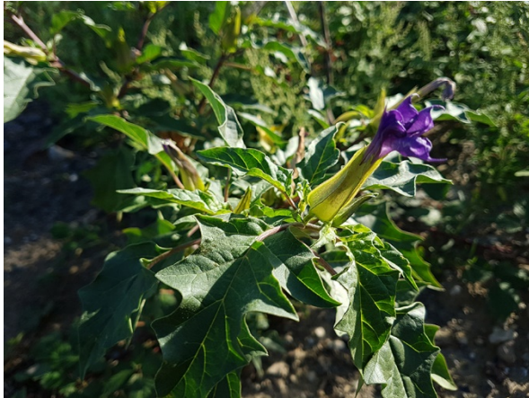
Abb. 31: Datura stramonium var. tatula in Bochum-Stahlhausen (P. GAUSMANN).