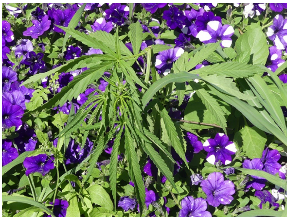
Abb. 13: Cannabis sativa in Bad Salzuflen (W. HESSEL).

Düsseldorf-Benrath (4807/13): eine Pflanze in einem Blumenkübel, 19.08.2018, F. W. BOMBLE & N. JOUSSEN. – Rhein-Sieg-Kreis, Rheinbach-Todenfeld (5407/21): in einem ungenutzten Pflanzenkübel auf dem Parkplatz des REWE-Supermarktes Rheinbach NRW, 26.10.2017, G. REBING (conf. F. W. BOMBLE).