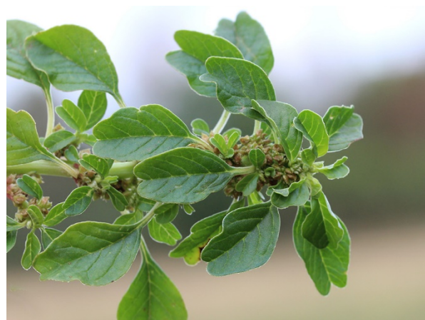
Abb. 4: Amaranthus emarginatus in Witten-Herbede (C. BUCH).