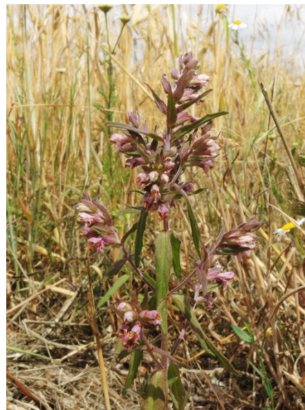
Abb. 68: Odontites vernus in Geseke (A. JAGEL).