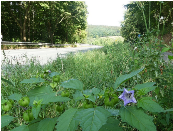
Abb. 65: Nicandra physalodes in Arnsberg (W. HESSEL).

Kreis Soest, Geseke (4316/44): in zwei Ackerrandstreifen des Schutzprogrammes für Ackerunkräuter der Geseker Steinwerke westlich der Bürener Str., 17.06.2018, V. UNTERLADSTETTER & A. JAGEL.