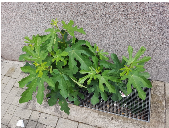
Abb. 51: Ficus carica in Bochum-Hamme.

Essen-Haarzopf (4507/43): mehrere hundert Pflanzen auf einem brachliegenden Parkplatz an der Eststr., 24.06.2018, C. BUCH & M. ENGELS.