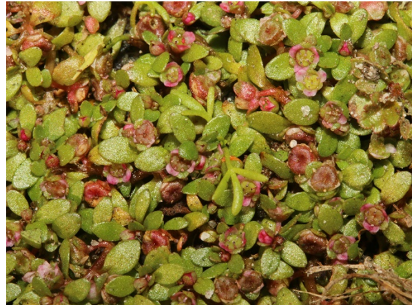
Abb. 38: Elatine hexandra in Haltern (T. SCHMITT).