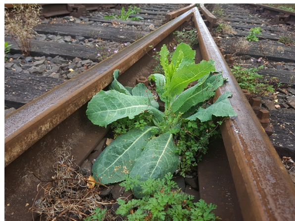
Abb. 60: Lactuca virosa in Bochum-Dahlhausen (P. GAUSMANN).