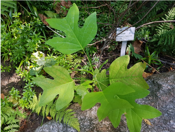
Abb. 61: Liriodendron tulipifera in Bochum-Querenburg (P. GAUSMANN).