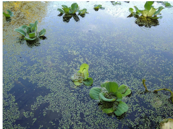
Abb. 76: Pistia stratiotes in Köln-Porz (C. KATZENMEIER).