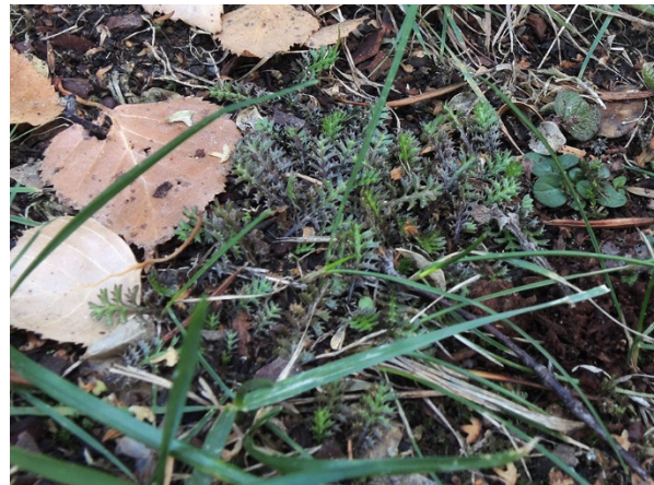
Abb. 26: Cotula squalida in Bochum.