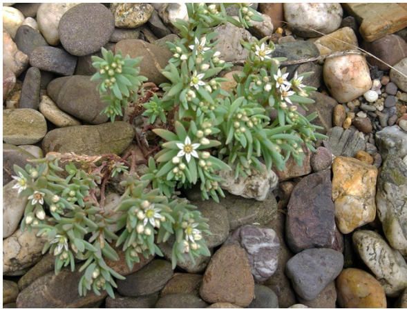
Abb. 87: Sedum hispanicum in Bochum (15.05.2018,).