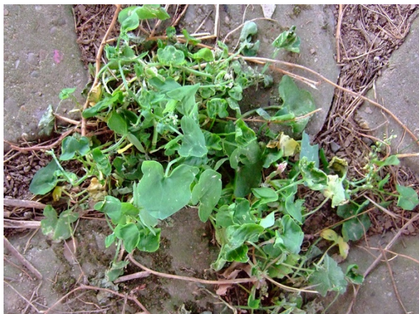
Abb. 81: Rumex scutatus am Rheinufer in Neuss (R. KIRCHHOFF).