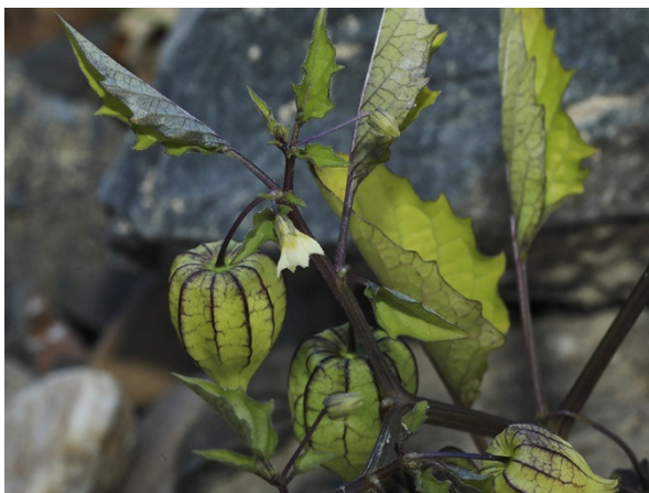
Abb. 73: Physalis angulata am Rheinufer in Bonn (H. GEIER).

Köln-Porz-Langel (5108/13): eine fruchtende Pflanze am Rheinufer unterhalb der Straße In der Aue, 22.10.2018, G. BLAICH. – Bonn-Auerberg (5208/23): eine Pflanze am Rheinufer, 20.10.2018, L. KOSACK & L. RABER.