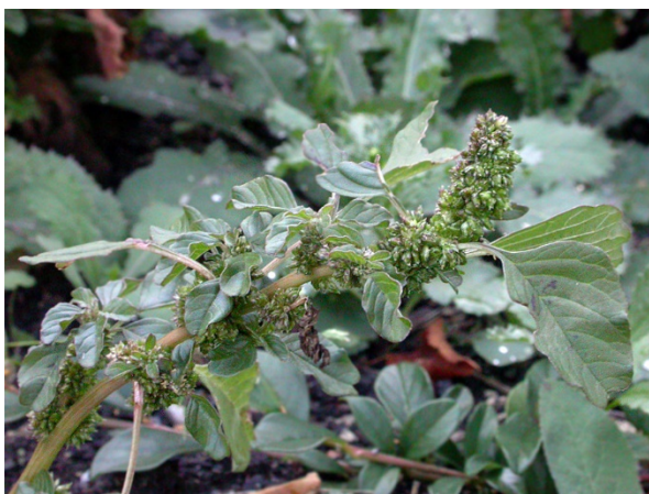
Abb. 3: Amaranthus blitum in Aachen (F. W. BOMBLE).

Ennepe-Ruhr-Kreis, Witten-Herbede (4509/41): ein kleiner Bestand an einem Wegrand an der Ruhr nördlich der Schleuse, 24.08.2018, G. ABELS. Außerhalb des Rheintales noch nicht häufig.