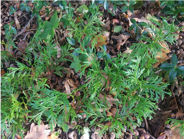
Abb. 95: Thuja plicata in Bochum.