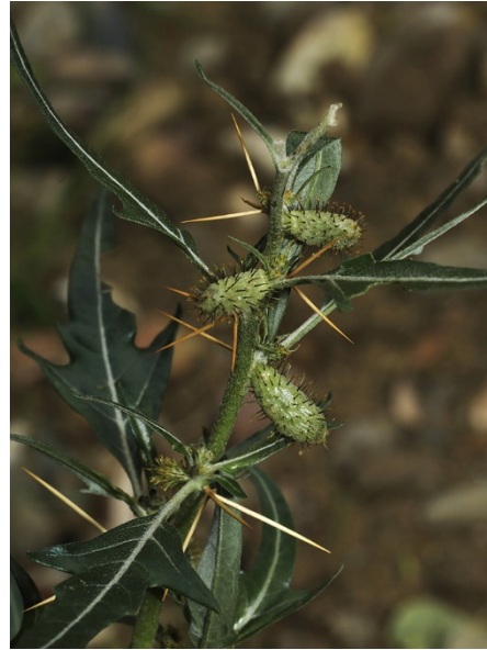
Abb. 100: Xanthium spinosum am Rheinufer in Bad Honnef.