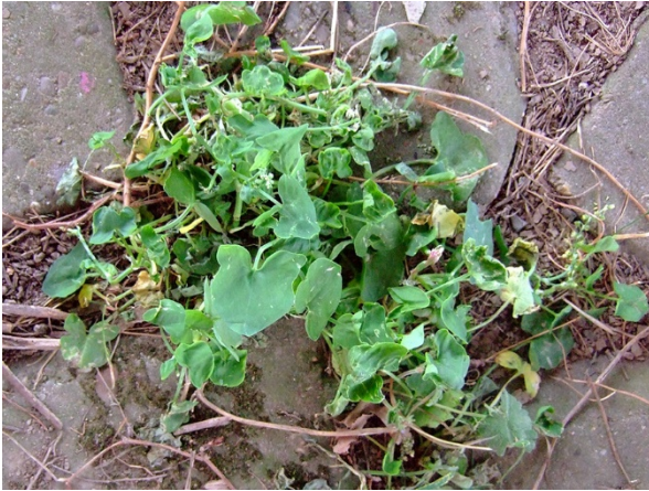
Abb. 81: Rumex scutatus am Rheinufer in Neuss (R. KIRCHHOFF).