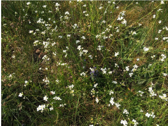
Abb. 5: Arabidopsis halleri in Wenden (J. KNOBLAUCH).