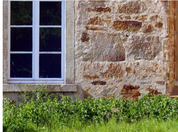
Abb. 6: Aristolochia clematitis in Rheine.