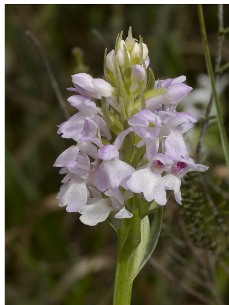
Abb. 10: Dactylorhiza sennia, (Krs. Paderborn, 08.06.2013,).