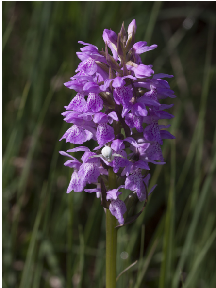
Abb. 7: Dactylorhiza maculata agg. × D. sphagnicola (Rhein-Sieg-Kreis, 01.06.2011,).

Die Unterart besitzt kräftigere, steiler am Stängel stehende Blätter, die im unteren Teil am breitesten sind sowie einen längeren und dickeren Sporn. Das einzige Vorkommen in Nordrhein-Westfalen wird durch Ausbreitung von Myrica gale (Gagel) am Fundort gefährdet.