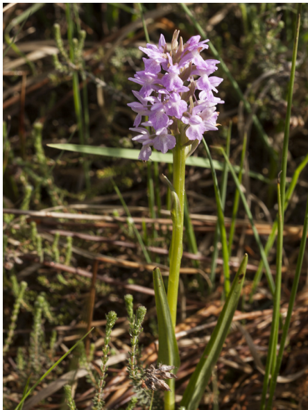
Abb. 1: Dactylorhiza sphagnicola subsp. sphagnicola (Wahner Heide, 01.06.2011,).

Um auf die Problematik der Veränderung von Lebensräumen und ihre Zerstörung aufmerksam zu machen, wird jährlich von den deutschen ARBEITSKREISEN HEIMISCHE ORCHIDEEN (AHO DEUTSCHLAND) eine „Orchidee des Jahres“ gewählt – für das Jahr 2018 das Torfmoos-Knabenkraut ( Dactylorhiza sphagnicola subsp. sphagnicola , Abb. 1 & 2). Es ist in Deutschland eine sehr seltene Orchideen-Art, da sie als Spezialistin nur intakte, saure Moorstandorte besiedelt und durch Trockenlegung von Mooren an vielen ehemaligen Wuchsorten ihren Lebensraum verloren hat. Die Auswahl ist auch deshalb erfolgt, um auf die ökologische Bedeutsamkeit von Mooren aufmerksam zu machen.