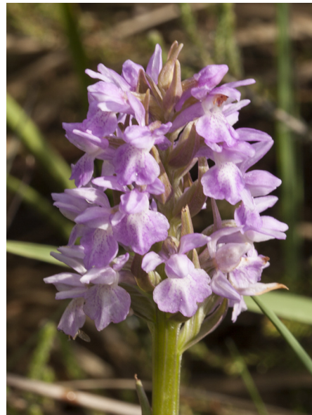
Abb. 2: Dactylorhiza sphagnicola subsp. sphagnicola (Wahner Heide, 01.06.2011,).