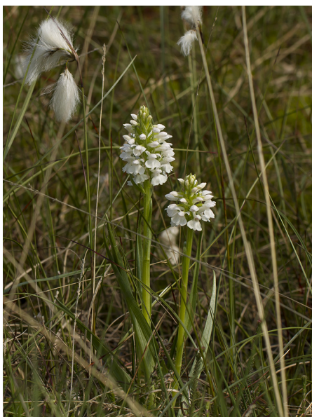
Abb. 9: Dactylorhiza sennia (Krs. Paderborn, 08.06.2013,).