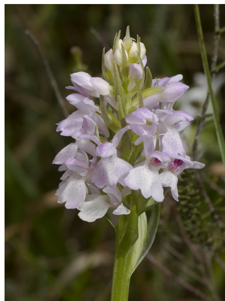
Abb. 10: Dactylorhiza sennia, (Krs. Paderborn, 08.06.2013,).