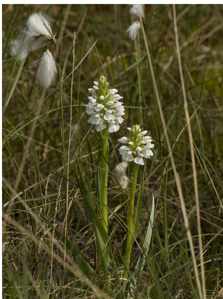
Abb. 9: Dactylorhiza sennia (Krs. Paderborn, 08.06.2013,).