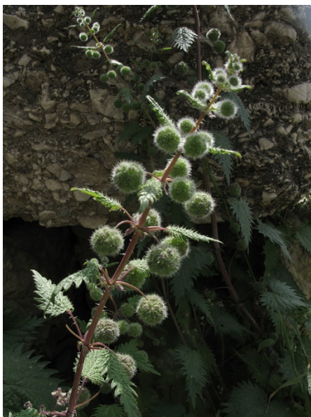
Abb. 27: Pillen-Brennnessel – Urtica pilulifera (27.03.2011, Athen, Griechenland,).