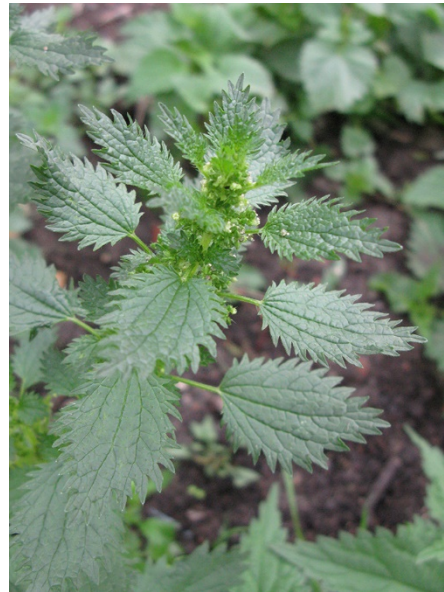
Abb. 26: Kleine Brennnessel – Urtica urens (07.09.2013, Senne,).