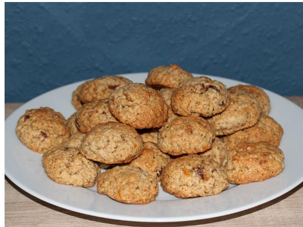
Abb. 32: Selbstgebackene Kekse mit Brennesselsamen (C. Buch).