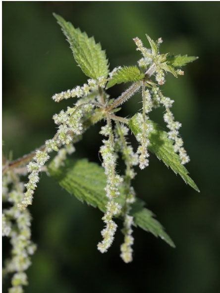
Abb. 21: Große Brennnessel, blühende weibliche Pflanze (08.10.2021,).