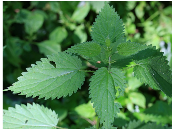
Abb. 14: Große Brennnessel, Blätter (26.05.2012,).

Berühmt-berüchtigt sind natürlich vor allem die Brennhaare, neben denen die Pflanzen noch nichtbrennende, kurze und drüsenlose Haare ausbilden (z. B. Abb. 1 & 16). Die Brennhaare selbst sind ein beliebtes Objekt in Mikroskopierkursen des Biologiestudiums, denn sie sind leicht zu präparieren und markant aufgebaut (Abb. 17). Jedes Brennhaar besteht aus einer einzelnen, hohlen Zelle. Diese besitzt im unteren Teil einem Bulbus, mit dem sie in einem Sockel aus Epidermiszellen eingebettet ist. Dem langen Mittelstück des Brennhaares sitzt auf einer Sollbruchstelle ein Köpfchen auf, das bei Berührung abbricht, wobei der Zellinhalt wie mit einer Kanüle in die Haut injiziert wird und dort die bekannten Hautreaktionen hervorruft (Abb. 18).