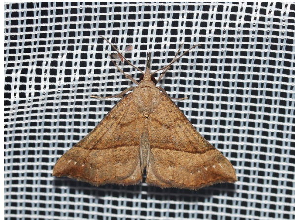
Abb. 10: Nessel-Schnabeule ( Hypena proboscidalis) am Leuchtturm. Nachtfalter, dessen Raupe ausschließlich an Brennnessel frisst (02.06.2020, Bochum-Laer,).