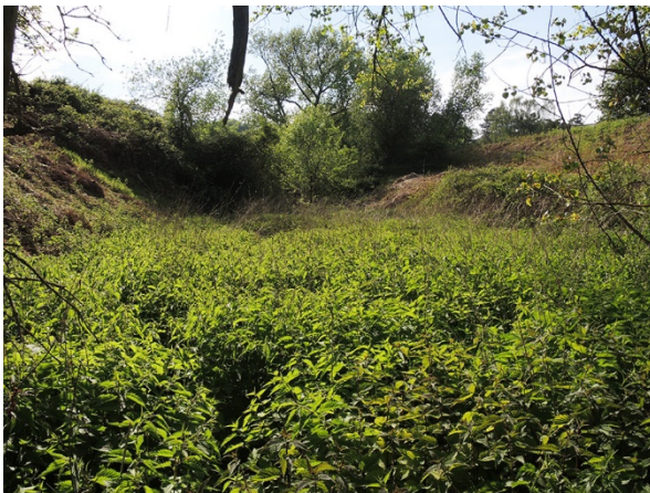
Abb. 5: Große Brennnessel, Dominanzbestand in einem von Landwirtschaft umgebenen, ehemals artenreichen Siepen (15.05.2020, Bochum-Stiepel, Kalwes,).