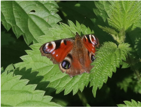
Abb. 7: Tagpfauenauge ( Aglais io) auf Großer Brennnessel (25.07.2021, Bochum-Laer,).

zählt, sind kontraproduktiv. Überregional ist in diesem Zusammenhang hauptsächlich die intensive Landwirtschaft und ihre Nährstoffeinträge in Boden und Gewässer als Verursacher des Artenschwundes zu identifizieren.