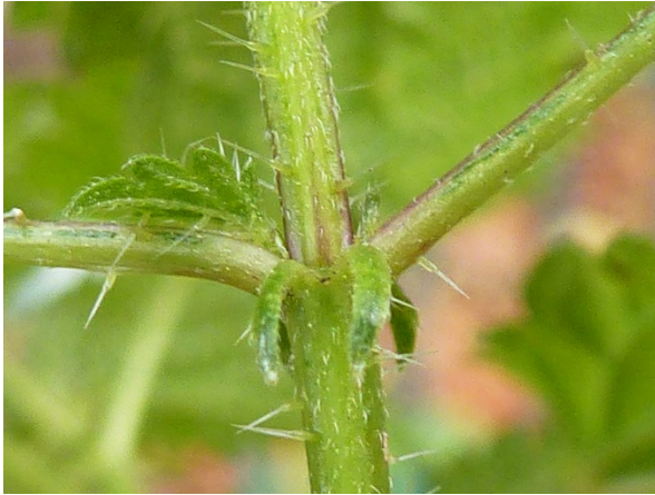
Abb. 15: Große Brennnessel, Nebenblätter (26.10.2014, Bochum,).