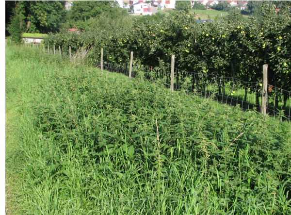
Abb. 4: Große Brennnessel im nährstoffreichen Grünland (21.08.2010, Bodman/BW,).