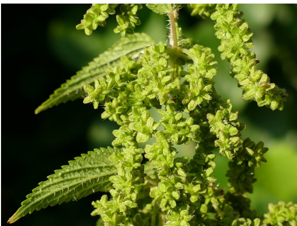
Abb. 23: Große Brennnessel, fruchtend (15.09.2020, Konstanz/BW,).