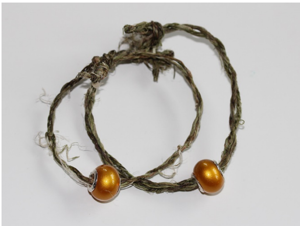
Abb. 29: Armbänder aus selbst hergestellten Brennesselfasern (11.10.2021,).

Eine vorherige Aufbereitung durch Quellen oder Kochen der gesammelten Pflanzen, wie es für die professionelle Verwendung empfohlen wird, ist für die einfache Gewinnung von Fasern nicht nötig, sodass für schnelle Zwecke auch frisches Material direkt verarbeitet werden kann. Für die Herstellung von Armbändern ernteten wir ca. drei Brennnesseln pro Person und befreiten diese von Seitenästen und Blättern. Zum Aufbrechen verwendeten wir zum Schutz vor den Brennhaaren ein Nudelholz, im Gelände funktioniert das aber auch mit einem Stein oder bei unempfindlichen Personen durch vorsichtiges Knicken der Stängel per Hand. Nachdem alle holzigen Bestandteile des Stängels entfernt sind, können die Fasern getrocknet, in der schnellen Variante aber auch noch im feuchten Zustand miteinander verdrillt und so immer weiter verlängert werden, bis eine kontinuierliche Schnur entsteht. Zur Stabilisierung wird diese noch ein oder zweimal verdrillt oder geflochten und kann mit Perlen oder anderen Anhängern z. B. zu einem Armband gebunden werden (Abb. 29).