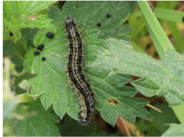
Abb. 8: Kleiner Fuchs ( Aglais urticae), Raupe auf Großer Brennnessel (13.05.2021, Bochum-Laer,).