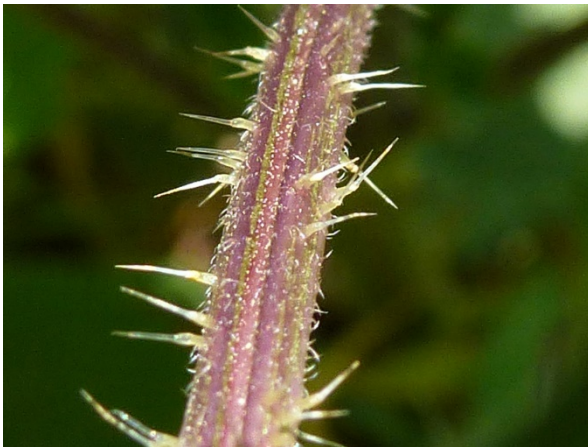
Abb. 13: Große Brennnessel, Stängel (05.05.2013,).

Brennnesseln erreichen auf für sie optimalen Böden Wuchshöhen von bis zu 2,5 m. Sie sind ausdauernd, wobei Rhizom und Stängel verholzen. Die Pflanzen wachsen aufrecht und sind wenig bis unverzweigt. Die Stängel sind vierkantig (Abb. 13), die Blätter gegenständig (Abb. 14). Diese sind am Blattgrund oval bis herzförmig mit einer lang ausgezogenen Spitze, 5–15 cm lang, 2–8 cm breit und am Rand grob gesägt. Die Nebenblätter sind lanzettlich und nicht verwachsen (Abb. 15).