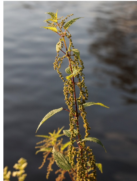
Abb. 2: Große Brennnessel am Ruhrufer (08.10.2021, Mülheim/Ruhr,).