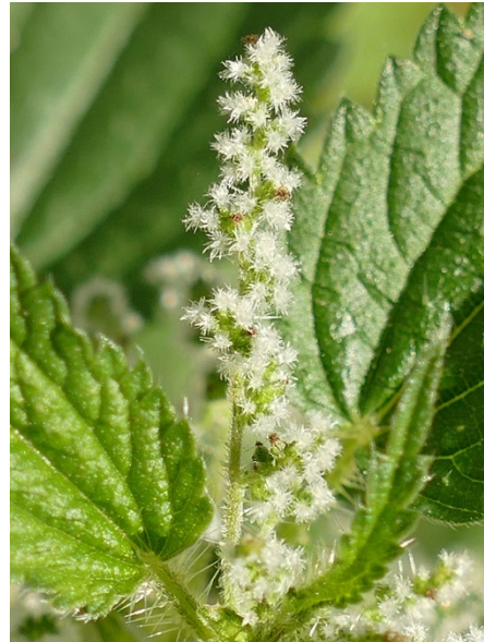
Abb. 22: Große Brennnessel, weiblicher Blütenstand (14.09.2020,).