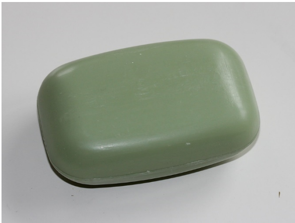
Abb. 33: Brennnesselseife.

Schon seit dem Altertum wurden Brennnesseln sowohl innerlich als auch äußerlich gegen vielerlei Leiden verwendet. Dabei wurden sowohl ihre Inhaltsstoffe als auch die Eigenschaft der Brennhaare genutzt und das Anwendungsspektrum reichte wie so oft von aus heutiger Sicht nachvollziehbaren Maßnahmen bis hin zu Zauber und Aberglaube (s. Kap. 5). Bereits bei Hippokrates war die Brennnessel wegen ihrer vielfältigen Wirkungen eine geschätzte Heilpflanze. Auch Hildegard von Bingen empfahl das Kochen von jungen Brennnesseln, um den Magen zu reinigen und Paracelsus verwendete sie äußerlich gegen Gelenkschmerzen. Hierbei wurden die Brennhaare mit ihrer durchblutungsfördernden Wirkung bei Rheuma, Gicht, Ischias oder Hexenschuss genutzt.