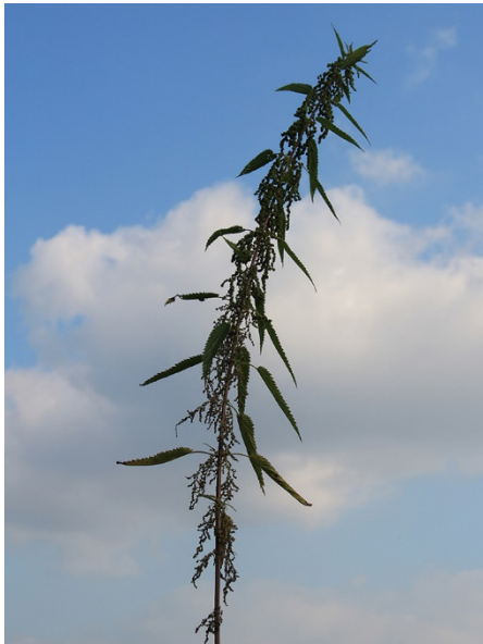
Abb. 25: Auen-Brennnessel – Urtica subinermis (20.09.2014, Duisburg,).

Je nach Auffassung werden verschiedene Varietäten oder Unterarten von Urtica dioica beschrieben. Die mittlerweile im Artrang weitgehend akzeptierte Auen- oder Hain-Brennnessel ( Urtica subinermis , Abb. 25) besitzt keine oder nur sehr wenige Brennhaare. Sie kommt in den Auen größerer Flüsse vor. Wie häufig sie in Nordrhein-Westfalen wirklich auftritt, ist aufgrund von Kartierungslücken wohl schwierig zu beurteilen. Zumindest am Rhein ist sie nach eigener Erfahrung wahrscheinlich häufiger als oft angenommen.