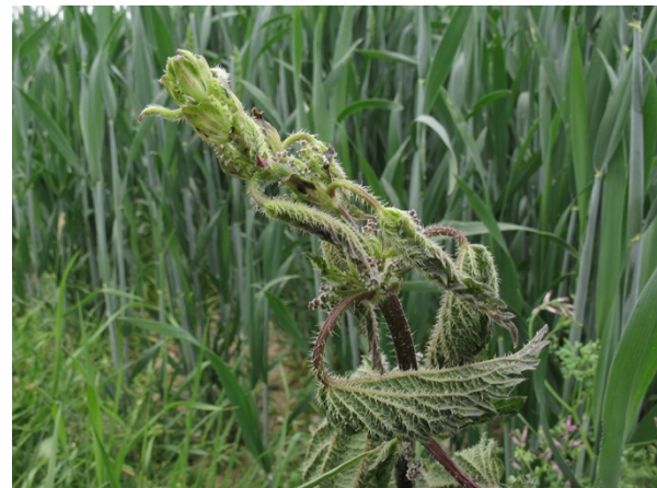
Abb. 6: Große Brennnessel, mit Herbiziden abgetötet an einem Ackerrand (09.06.2013, Geseke, Krs. Soest,).

Während manche gebietsfremde Pflanze im Rahmen von Naturschutzmaßnahmen bekämpft wird, wird die Brennnessel kaum kritisch gesehen, schließlich handelt es sich um eine heimische Art. Dass sich ihre Dominanzbestände ebenfalls negativ auf die Biodiversität auswirken (Abb. 5), wird dabei oft ausgeblendet. Die Pflanze an sich trägt hier natürlich keine Schuld und selbst ihre Entfernung hilft nur bedingt, solange ständig neue Nährstoffe nachgeliefert werden. Viel förderlicher ist auf lokaler Ebene das Ausmagern der Standorte: beim Grünland und an Saumstandorten durch eine zweischürige bzw. einschürige Mahd mit Abtragen des Materials. Mulchen oder zusätzliche Düngung, zu der übrigens auch Hundekot