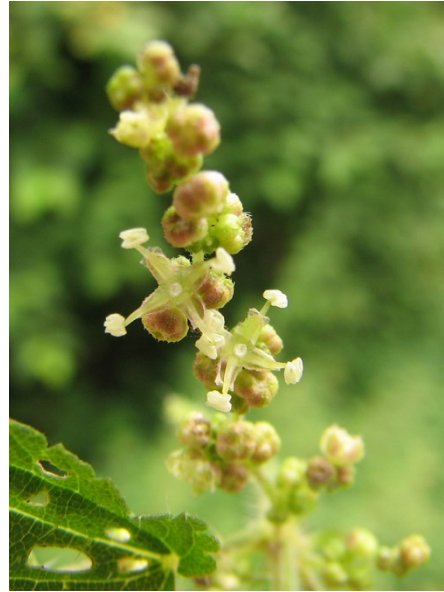
Abb. 20: Große Brennnessel, männliche Blüten (11.08.2010, Bochum,).