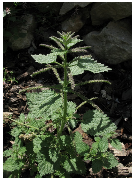
Abb. 28: Geschwänzte Brennnessel – Urtica membranacea (22.03.2012, Mallorca, Spanien,).