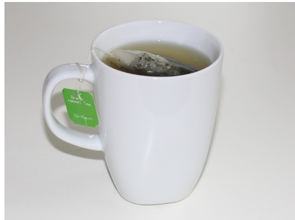
Abb. 34: Brennnesseltee.

Auch heute noch werden Brennnesselprodukte verwendet und sollen z. B. als Tee bei Männern gegen eine vergrößerte Prostata und bei Frauen gegen Hitzewallungen während der Wechseljahre helfen. Sie wirken harntreibend und durchspülend, außerdem auch adstringierend und damit blutungsstillend, antioxidativ, entzündungshemmend und schmerzstillend. Sie senken den Blutdruck und einige Blutzuckerwerte, was sie für Diabetiker interessant macht.