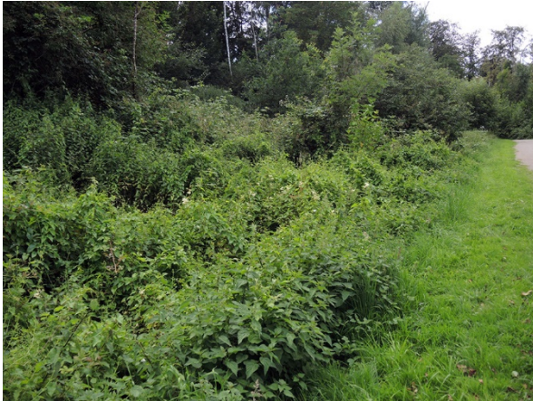
Abb. 3: Große Brennnessel, Bestand an einem Wegrand (15.07.2020, Bochum, Harpener Bockholt,).