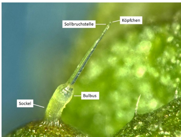
Abb. 17: Große Brennnessel. Brennhaar (13.06.2011, Konstanz,).