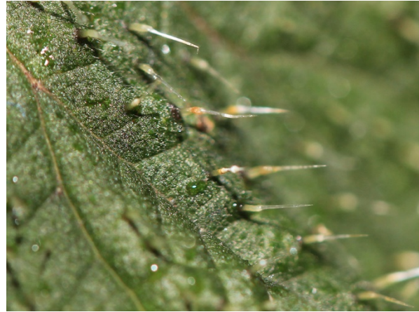
Abb. 16: Große Brennnessel, Blattoberseite mit Brennhaaren (23.01.2016,).