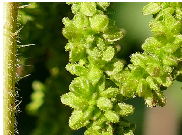
Abb. 24: Große Brennnessel, Früchte (15.09.2020, Konstanz/BW,).