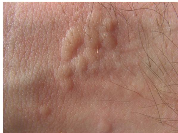
Abb. 18: Hautreaktion nach Berührung mit einer Großen Brennnessel (17.07.2005, Bochum,).