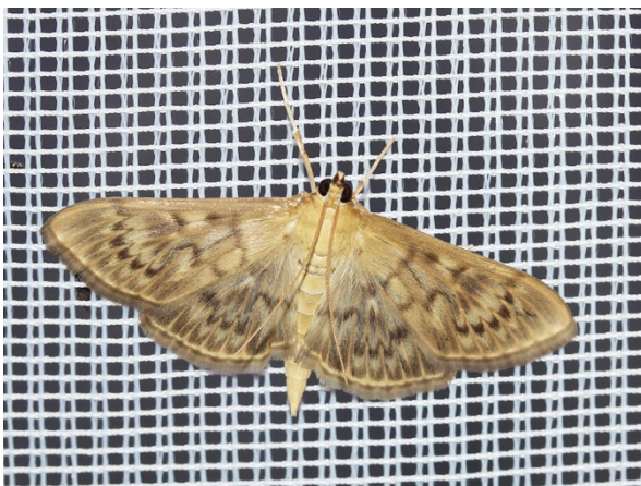
Abb. 11: Nesselzünsler ( Pleuroptya ruralis) am Leuchtturm. Nachtfalter, dessen Raupe u. a. an Brennnessel frisst (09.07.2021, Bochum-Laer,).