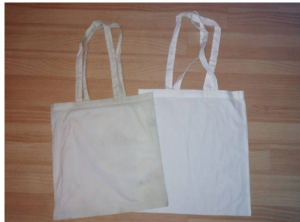
Abb. 30: Mit Brennnesseln gefärbte Stofftasche (links) im Vergleich zu einer ungefärbten Tasche (rechts) (12.10.2021,).