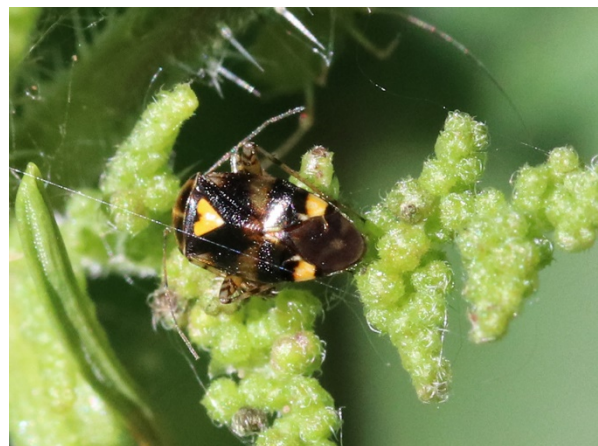
Abb. 12: Gepunktete Nesselwanze ( Liocoris tripustulatus) auf Großer Brennnessel. Eine Wanzenart, die sich wahrscheinlich ausschließlich von Pflanzensäften der Brennnessel ernährt (08.06.2019, Bochum-Laer,).