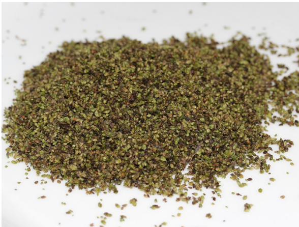
Abb. 31: Große Brennessel, Früchte („Brennesselsamen“).

Bei der Verwendung von Brennesseln in der Küche stellt sich zunächst die Frage, wie sich die Brennhaare deaktivieren lassen, sodass sie nicht im Mund oder Hals brennen. Dies funktioniert entweder mechanisch z. B. durch Zerkleinern oder Zermörsern, oder durch Erhitzen. So lassen sich Brennesseln zu Suppen, Soßen, Smoothies, Pesto oder wie Spinat zubereiten. Brennesseln enthalten insbesondere große Mengen der Vitamine A und C sowie Mineralstoffe, Eisen, Polyphenole und weitere hochwirksame und gesundheitsfördernde sekundäre Pflanzenstoffe (FRINTRUP 2021, NHV 2021). Auch die knackigen Samen (Abb. 31) sind eine nahrhafte und vitaminreiche Zugabe zu Salaten, Müsli oder Gebäck (Abb. 32).