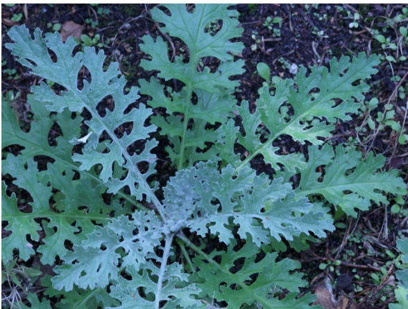
Abb. 14: Jacobaea xalbescens s. str., Grundblätter (Friedhof Grimlinghausen, Rhein-Kreis Neuss/NRW, 10.09.2023,).