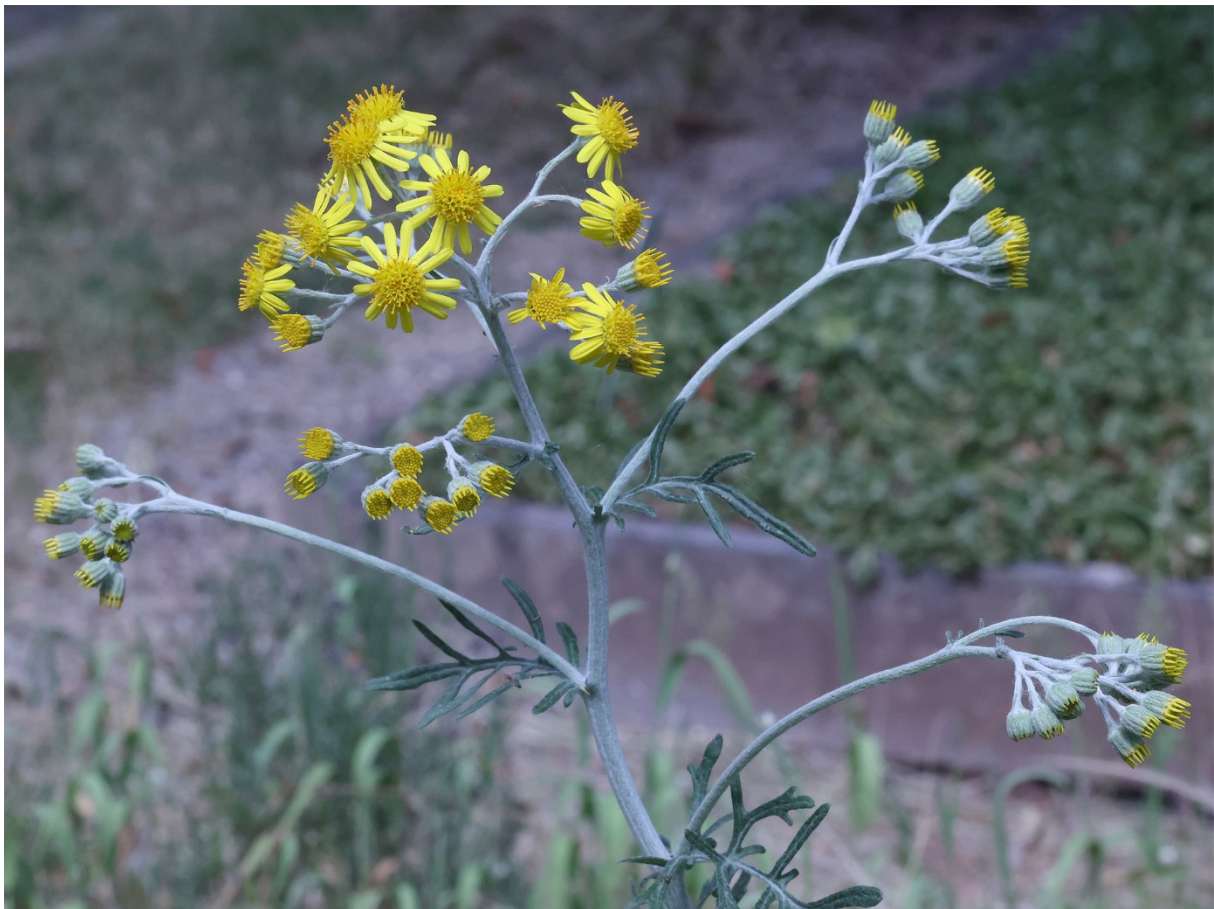
Abb. 3: Jacobaea ×albescens s. str., Gesamtblütenstand (Westfriedhof, Aachen/NRW, 20.06.2023,).