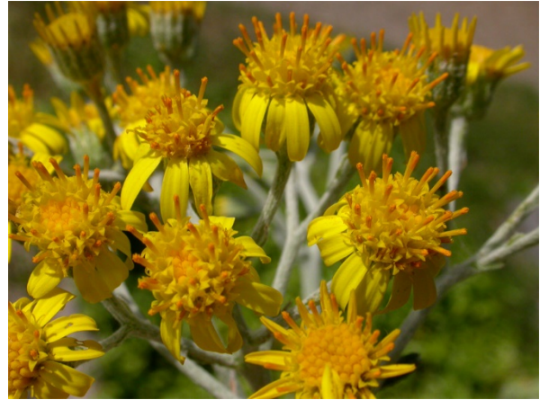
Abb. 5: Jacobaea xalbescens s. str., blühende Köpfchen (Friedhof Aachen-Laurensberg-Hand/NRW, 21.06.2017,).