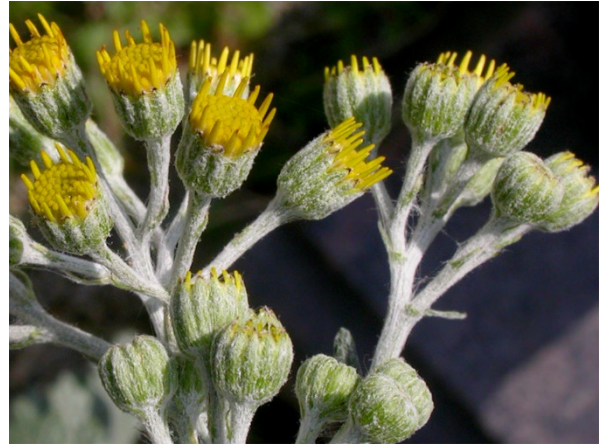
Abb. 23: Jacobaea xalbescens s. str., Köpfchen mit grünlicher filzig behaarten Hüllblättern (Friedhof Aachen-Laurensberg-Hand/NRW, 21.06.2017,).