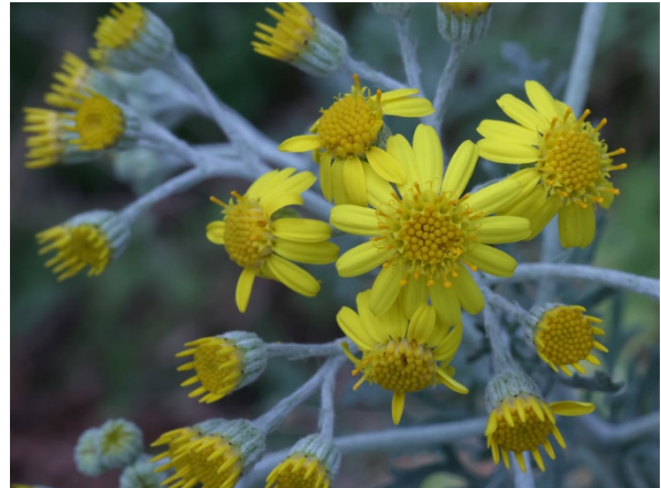
Abb. 25: Jacobaea xalbescens s. str., blühende Köpfchen mit längeren und relativ schmalen Zungenblüten (Westfriedhof, Aachen/NRW, 20.06.2023,).