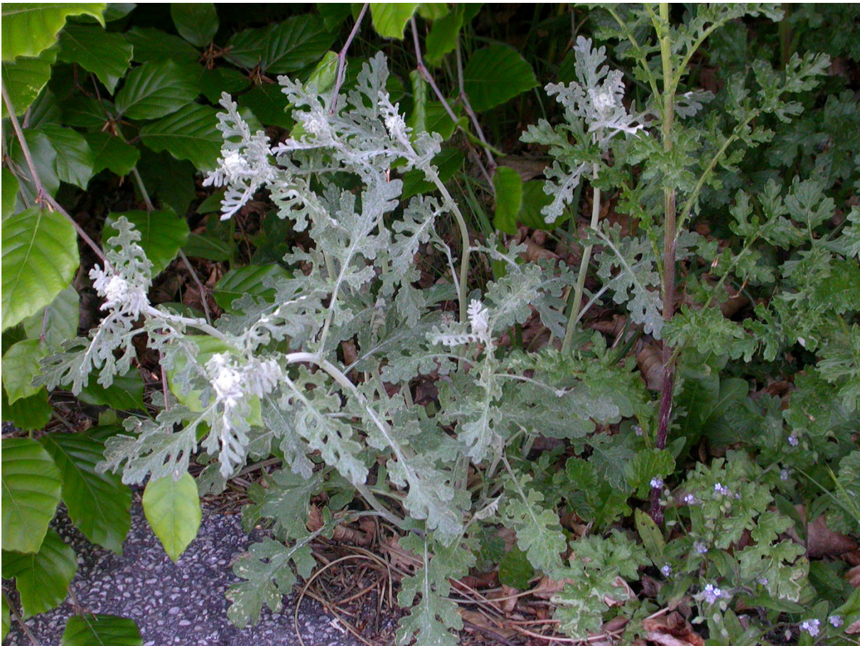
Abb. 30: Jacobaea \times albescens s. str. (links) und J. vulgaris s. str. (rechts) nebeneinander wachsend, Habitus des unteren und mittleren Stängelbereichs (Friedhof Aachen-Laurensberg-Hand/NRW, 21.05.2018,).