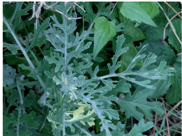
Abb. 19: Jacobaea \times albescens s. str., Stängelblätter mit oberseits graufilziger Behaarung und einem an J. vulgaris s. str. erinnernden Blattschnitt (Westfriedhof, Aachen/NRW, 21.09.2023,).