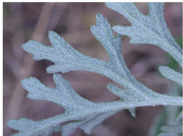
Abb. 21: Jacobaea \times albescens s. str., Stängelblatt-Unterseite mit lockerer, eher grau wirkender Behaarung (Westfriedhof, Aachen/NRW, 20.06.2023,).