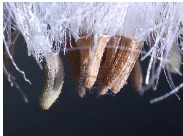
Abb. 27: Jacobaea xalbescens s. str., behaarte Achänen der Röhrenblüten (Friedhof Hüls, Aachen/NRW, 19.08.2023,).