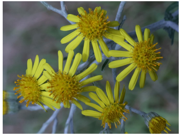
Abb. 7: Jacobaea xalbescens s. str., blühende Köpfchen (Westfriedhof, Aachen/NRW, 20.06.2023,).