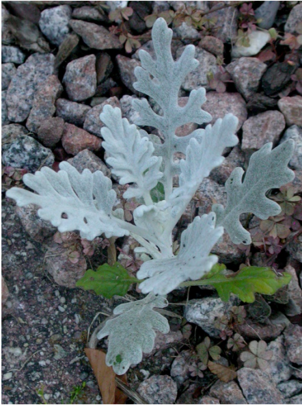
Abb. 1: Jacobaea maritima s. str., Jungpflanze (Friedhof Jülich-Barmen, Kreis Düren/NRW, 19.09.2019,).

Württemberg, Bayern, Niedersachsen, Nordrhein-Westfalen, Rheinland-Pfalz, Schleswig-Holstein und Sachsen.