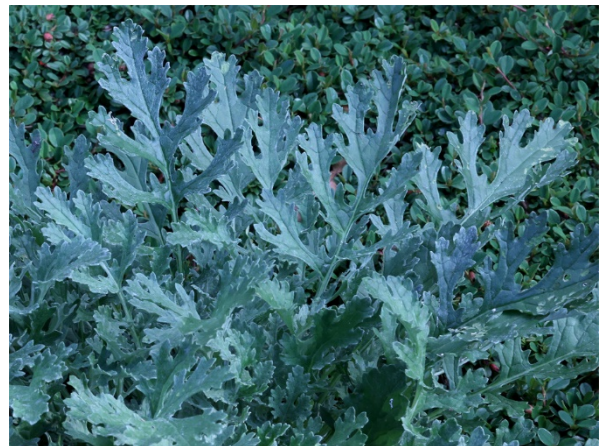
Abb. 15: Jacobaea xalbescens s. str., Grundblätter (Friedhof Hüls, Aachen/NRW, 19.08.2023,).