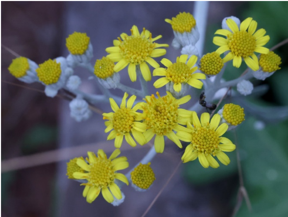
Abb. 24: Jacobaea maritima s. str., blühende Köpfchen mit kurzen und relativ breiten Zungenblüten (kultiviert, Westfriedhof, Aachen/NRW, 20.06.2023,).