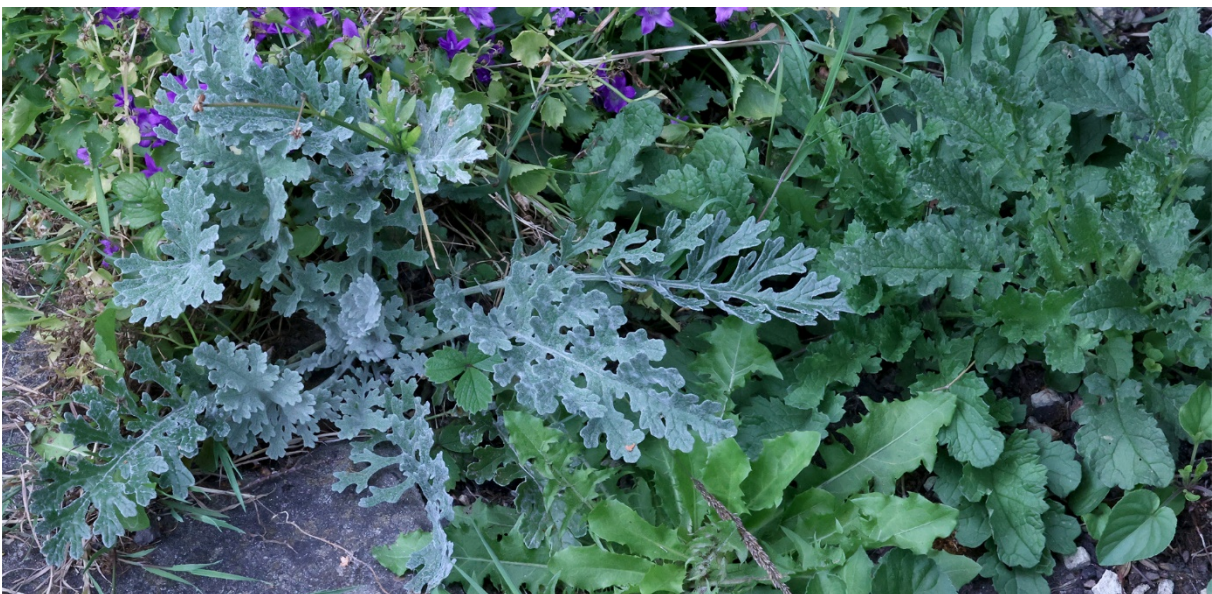
Abb. 28: Jacobaea \times albescens s. str. (links) und J. vulgaris s. str. (rechts), Grundblätter (Westfriedhof, Aachen/NRW, 19.07.2023,).