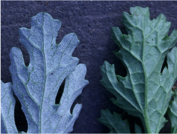
Abb. 29: Jacobaea xalbescens s. str. (links) und J. vulgaris s. str. (rechts), Grundblatt-Unterseiten (Westfriedhof, Aachen/NRW, 22.09.2023,). Während die Blattunterseiten zumindest der inneren Grundblätter von J. xalbescens s. str. dicht weiß- bis graufilzig behaart sind, fehlt eine filzige Behaarung bei J. vulgaris s. str.