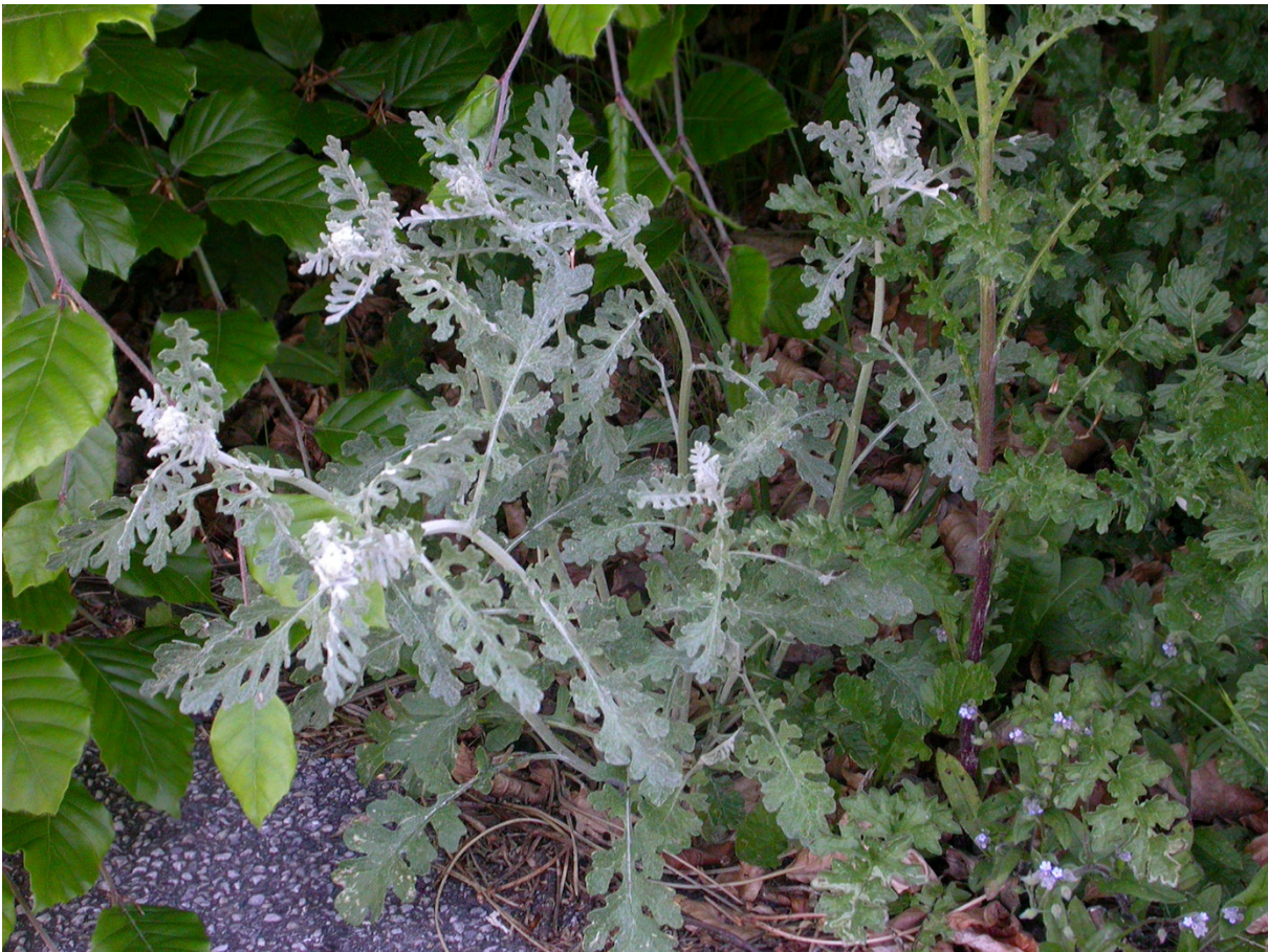
Abb. 30: Jacobaea xalbescens s. str. (links) und J. vulgaris s. str. (rechts) nebeneinander wachsend, Habitus des unteren und mittleren Stängelbereichs (Friedhof Aachen-Laurensberg-Hand/NRW, 21.05.2018,).