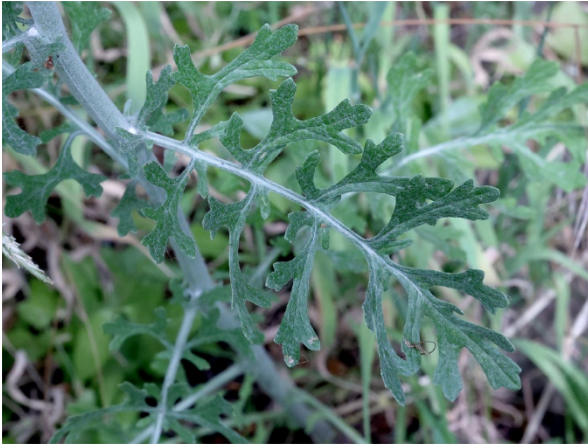
Abb. 10: Jacobaea xalbescens s. str., Stängelblatt (Westfriedhof, Aachen/NRW, 20.06.2023,).