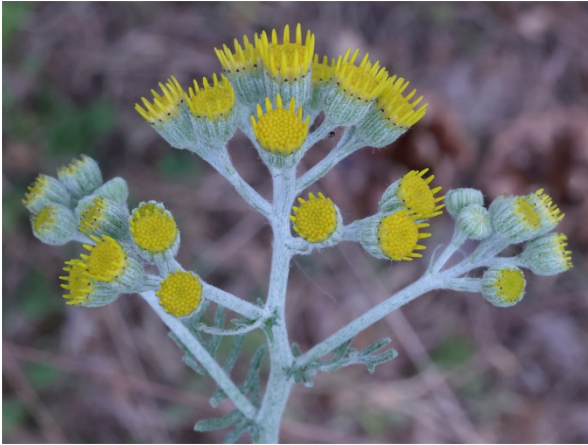
Abb. 4: Jacobaea xalbescens s. str., Gesamtblütenstand (Westfriedhof, Aachen/NRW, 20.06.2023,).