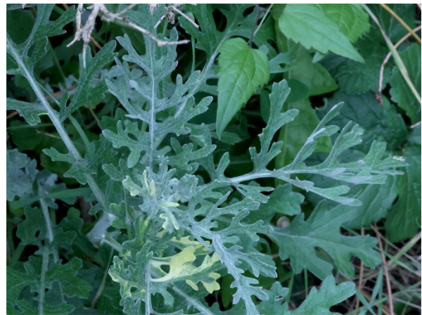
Abb. 19: Jacobaea ×albescens s. str., Stängelblätter mit oberseits graufilziger Behaarung und einem an J. vulgaris s. str. erinnernden Blattschnitt (Westfriedhof, Aachen/NRW, 21.09.2023,).