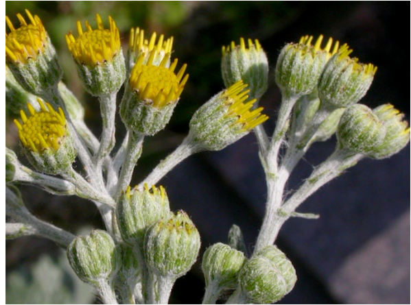
Abb. 23: Jacobaea xalbescens s. str., Köpfchen mit grünlicher filzig behaarten Hüllblättern (Friedhof Aachen-Laurensberg-Hand/NRW, 21.06.2017,).