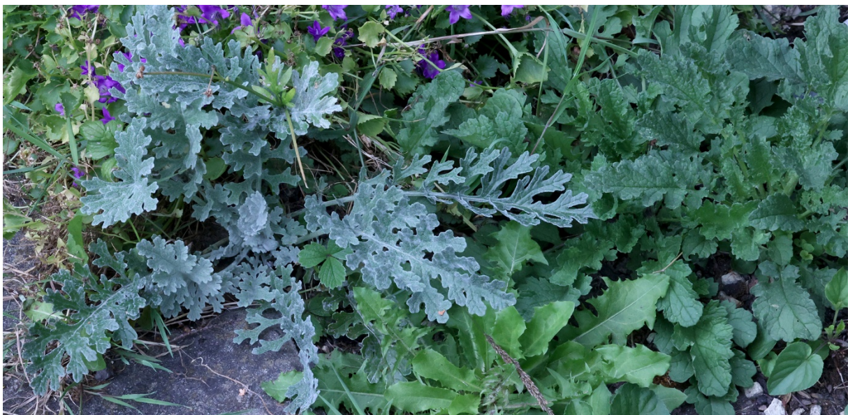
Abb. 28: Jacobaea \times albescens s. str. (links) und J. vulgaris s. str. (rechts), Grundblätter (Westfriedhof, Aachen/NRW, 19.07.2023,).