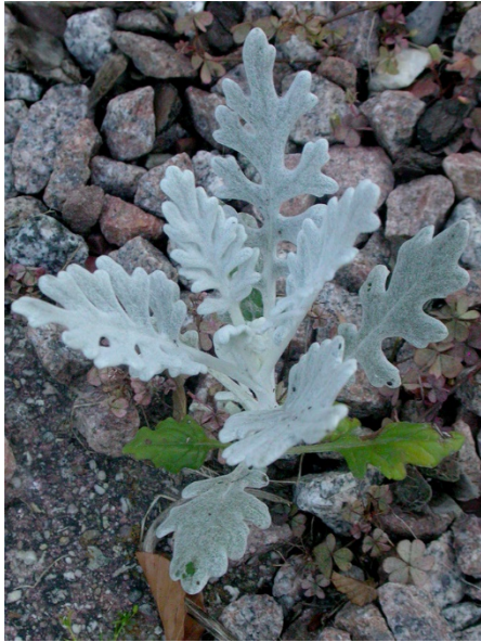
Abb. 1: Jacobaea maritima s. str., Jungpflanze (Friedhof Jülich-Barmen, Kreis Düren/NRW, 19.09.2019,).

Württemberg, Bayern, Niedersachsen, Nordrhein-Westfalen, Rheinland-Pfalz, Schleswig-Holstein und Sachsen.