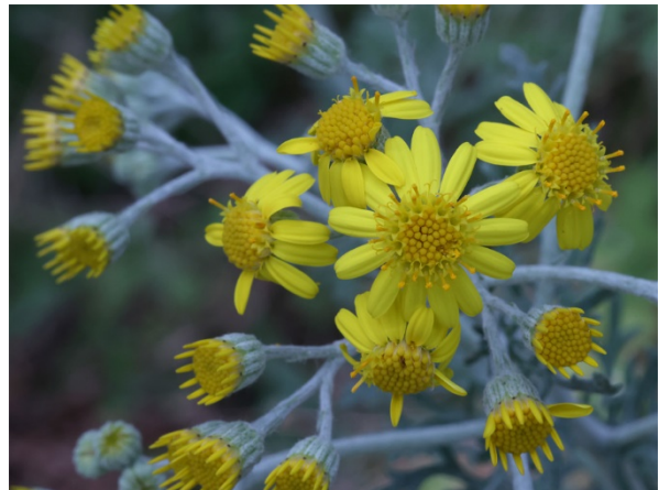
Abb. 25: Jacobaea xalbescens s. str., blühende Köpfchen mit längeren und relativ schmalen Zungenblüten (Westfriedhof, Aachen/NRW, 20.06.2023,).