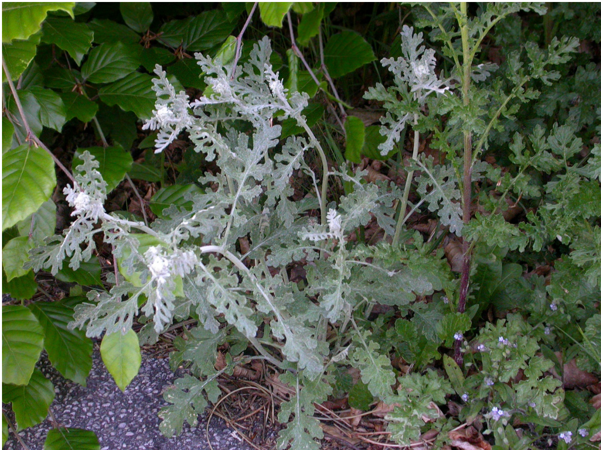
Abb. 30: Jacobaea \times albescens s. str. (links) und J. vulgaris s. str. (rechts) nebeneinander wachsend, Habitus des unteren und mittleren Stängelbereichs (Friedhof Aachen-Laurensberg-Hand/NRW, 21.05.2018,).