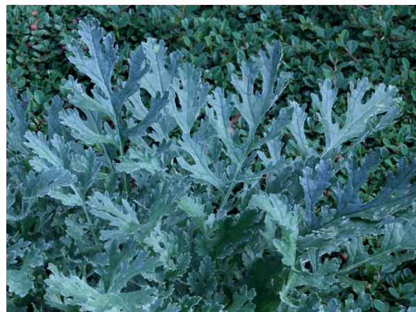
Abb. 15: Jacobaea xalbescens s. str., Grundblätter (Friedhof Hüls, Aachen/NRW, 19.08.2023,).