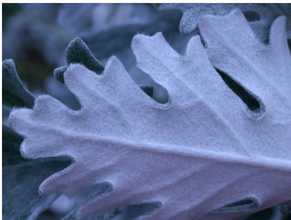
Abb. 20: Jacobaea maritima s. str., Stängelblatt-Unterseite mit dichter, rein weißer Behaarung (kultiviert, Westfriedhof, Aachen/NRW, 21.09.2023,).