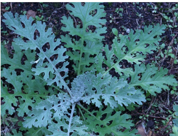
Abb. 14: Jacobaea xalbescens s. str., Grundblätter (Friedhof Grimlinghausen, Rhein-Kreis Neuss/NRW, 10.09.2023,).