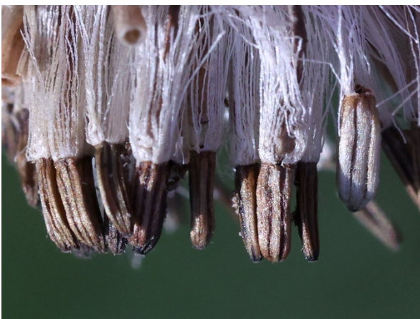
Abb. 26: Jacobaea maritima s. str., kahle Achänen der Röhrenblüten (kultiviert, Friedhof Aachen-Laurensberg/NRW, 23.09.2023,).