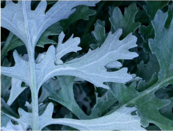
Abb. 16: Jacobaea xalbescens s. str., Unter- und Oberseite der Grundblätter (Friedhof Hüls, Aachen/NRW, 19.08.2023,).