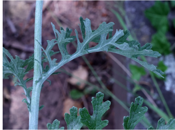
Abb. 11: Jacobaea xalbescens s. str., Stängelblatt (Westfriedhof, Aachen/NRW, 20.06.2023,).