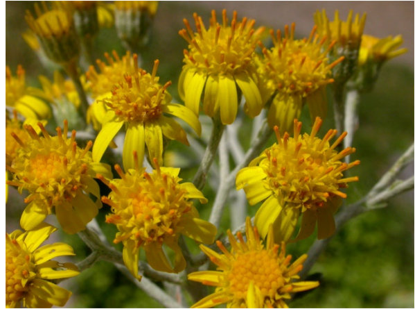
Abb. 5: Jacobaea xalbescens s. str., blühende Köpfchen (Friedhof Aachen-Laurensberg-Hand/NRW, 21.06.2017,).