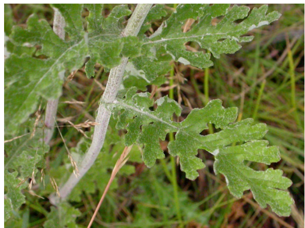
Abb. 9: Jacobaea xalbescens s. str., untere Stängelblätter (Friedhof Hüls, Aachen/NRW, 22.07.2015,).