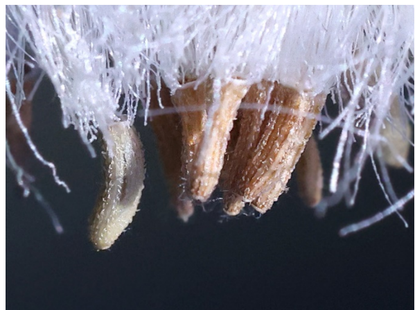
Abb. 27: Jacobaea xalbescens s. str., behaarte Achänen der Röhrenblüten (Friedhof Hüls, Aachen/NRW, 19.08.2023,).