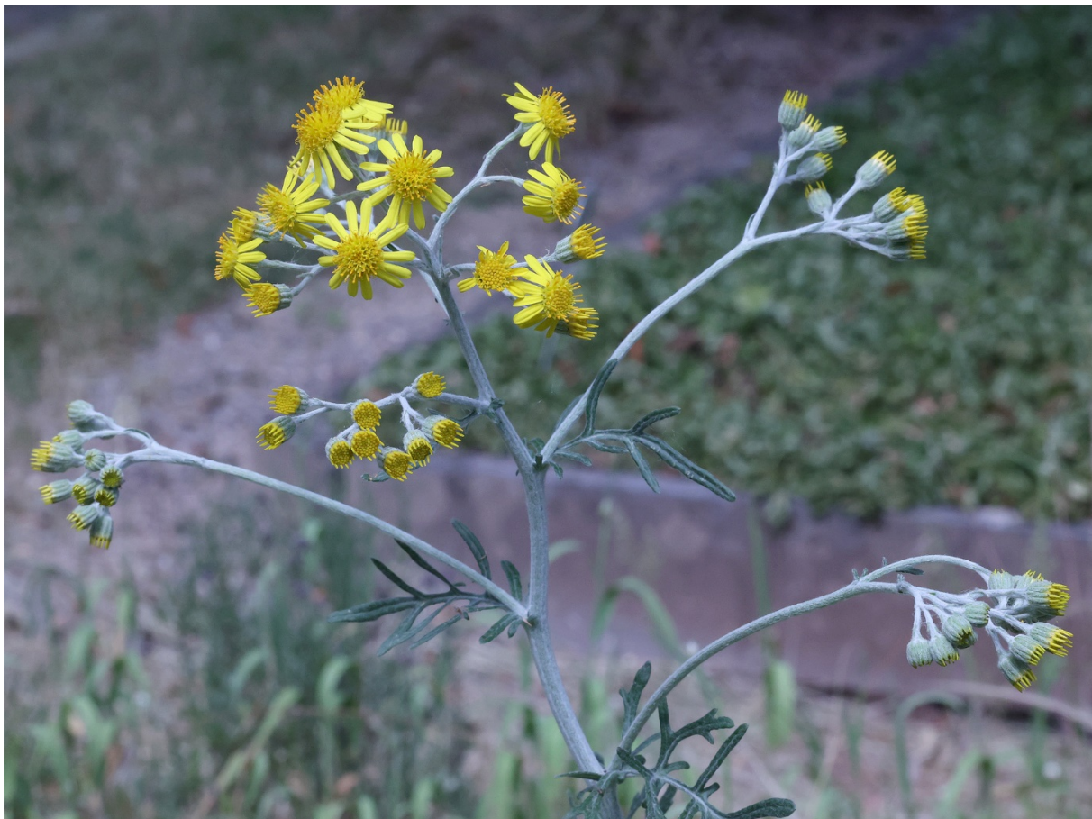
Abb. 3: Jacobaea ×albescens s. str., Gesamtblütenstand (Westfriedhof, Aachen/NRW, 20.06.2023,).