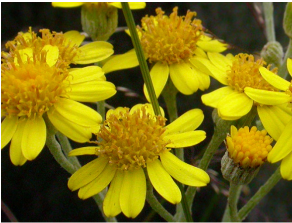
Abb. 6: Jacobaea xalbescens s. str., blühende Köpfchen (Friedhof Hüls, Aachen/NRW, 22.07.2015,).