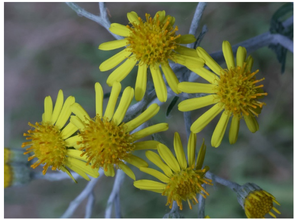
Abb. 7: Jacobaea xalbescens s. str., blühende Köpfchen (Westfriedhof, Aachen/NRW, 20.06.2023,).