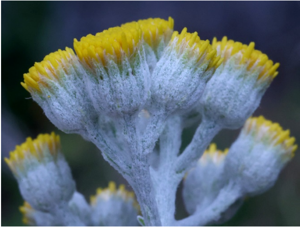
Abb. 22: Jacobaea maritima s. str., Köpfchen mit weißfilzig behaarten Hüllblättern (kultiviert, Westfriedhof, Aachen/NRW, 20.06.2023,).