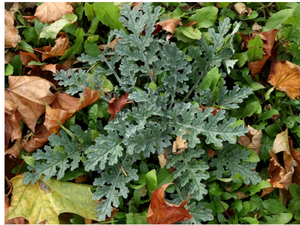
Abb. 13: Jacobaea xalbescens s. str., Grundblätter (Westfriedhof, Aachen/NRW, 28.10.2022,).