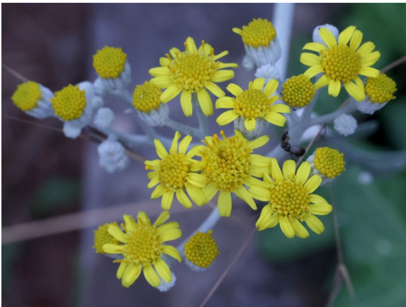
Abb. 24: Jacobaea maritima s. str., blühende Köpfchen mit kurzen und relativ breiten Zungenblüten (kultiviert, Westfriedhof, Aachen/NRW, 20.06.2023,).