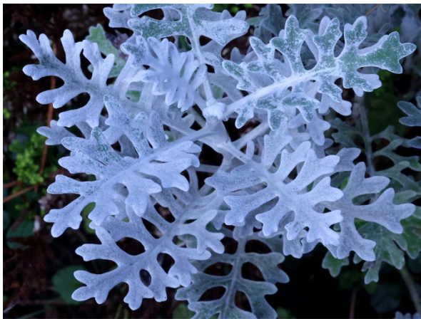
Abb. 18: Jacobaea maritima s. str., Stängelblätter mit oberseits weißfilziger Behaarung, wenig gezähnten Blattabschnitten und fehlender Bildung von Öhrchen (kultiviert, Friedhof Aachen-Lintert/NRW, 23.09.2023,).