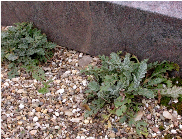
Abb. 12: Jacobaea xalbescens s. str., zwei überwinternde Pflanzen (Friedhof Kreuzau-Winden, Kreis Düren/NRW, 23.03.2019,).