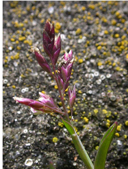
Abb.10 & 11:

Neben den wenig behaarten, kleinen und deutlich rötlich gefärbten Ährchen fällt Ochlopoa raniglumis im Frühjahr durch ihre Kleinwüchsigkeit und eine dunkle Blattfarbe auf.