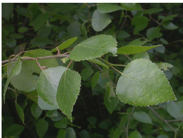
Abb. 3: Betula pubescens s. str. ist im Aachener Raum sehr selten. Betula pubescens s. str. is rare in the region of Aachen. Aachener Wald, Aachen/NRW (07.06.2006,).