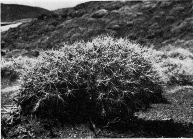
Fig. 4. Dorntragant-( Astragalus siculus -)Igelpolster, etwa \frac{1}{6} nat. Gr. — 23. April 1963.