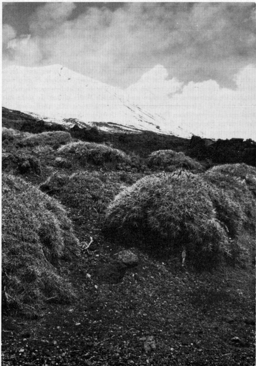
Fig. 1. Dorntragant- ( Astragalus siculus -) Polsterboden auf der Vulkan-Hochsteppe des Ätna in etwa 1850 m Höhe. Im Hintergrund die schneebedeckte Montagnola (2644 m). — 23. April 1963.