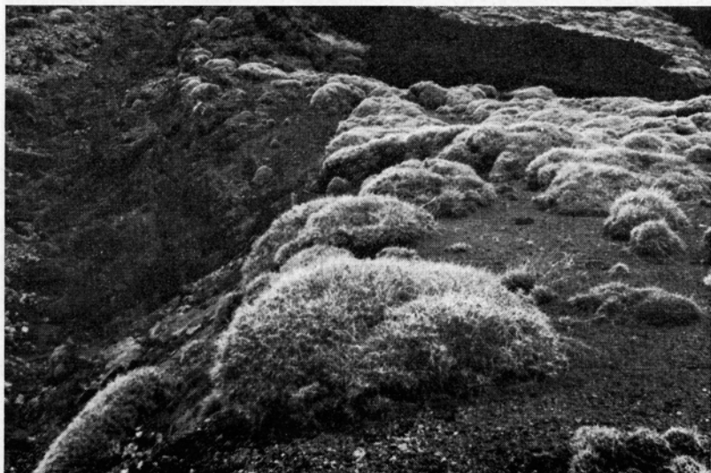
Fig. 3. Dicht gedrängte und zusammenfließende Igelpolster des Sizilischen Dorntragants ( Astragalus siculus ) gegen unbewachsenen Lavastrom von 1910. — 23. April 1963.