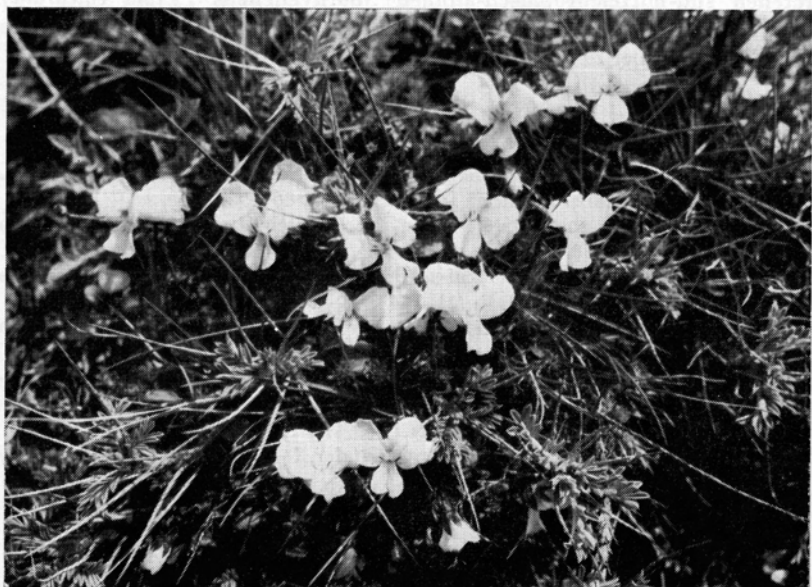
Fig. 7. Gelblichweiße Blüten des Ätna-Veilchens ( Viola aetnensis ) zwischen den Rhachisdornen des Sizilischen Dorntragants; etwa \frac{1}{1} nat. Gr. — 23. April 1963.