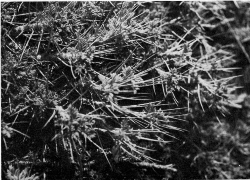
Fig. 5. Austreibende Sprosse des Sizilischen Dorntragants ( Astragalus siculus ); etwa \frac{1}{1} nat. Gr. — 23. April 1963.