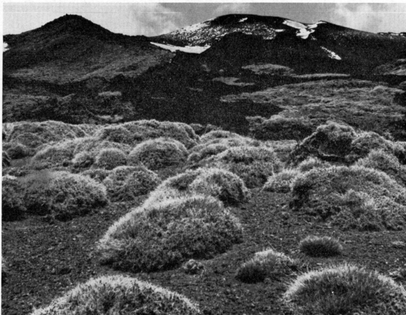
Fig. 2. Dorntragant- ( Astragalus siculus -) Polsterboden auf dem Ätna; im Hintergrund die schwarze, noch nicht bewachsene Lava des Ausbruchs von 1910. — 23. April 1963.