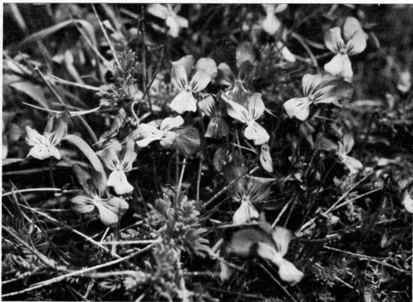
Fig. 6. Blaßviolette Blüten des Ätna-Veilchens ( Viola aetnensis ) zwischen den Rhachisdornen des Sizilischen Dorntragants; etwa \frac{1}{1} nat. Gr. — 23. April 1963.