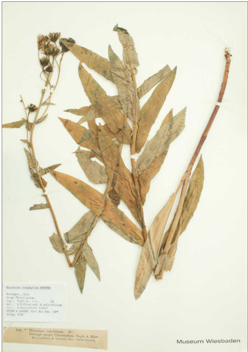
Abbildung 4: Hieracium iteophyllum (Fries No. 140*) aus dem Herbarium Wiesbaden; Foto: G. Gottschlich.