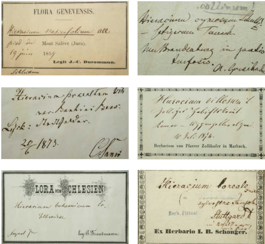
Abbildung 2: Ausgewählte Herbartiketten.