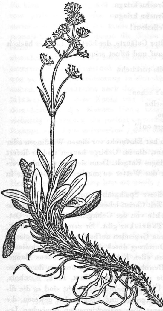
Abb. 5. Aus dem Werke von C. Clusius , Rarorium aliquot stirpium . . . Historia . Antwerpen 1576.

Eine kleine Schilderung dieser Speikgräber oder Wurzner, Pechschaber und Ameisenwühler gibt Rosegger in seinen „Schriftendes Waldschulmeisters“. Da Rosegger aus den Speikgegenden der Steiermark stammt, so ist sie sicherlich aus dem wirklichen Leben geschöpft. So schreibt