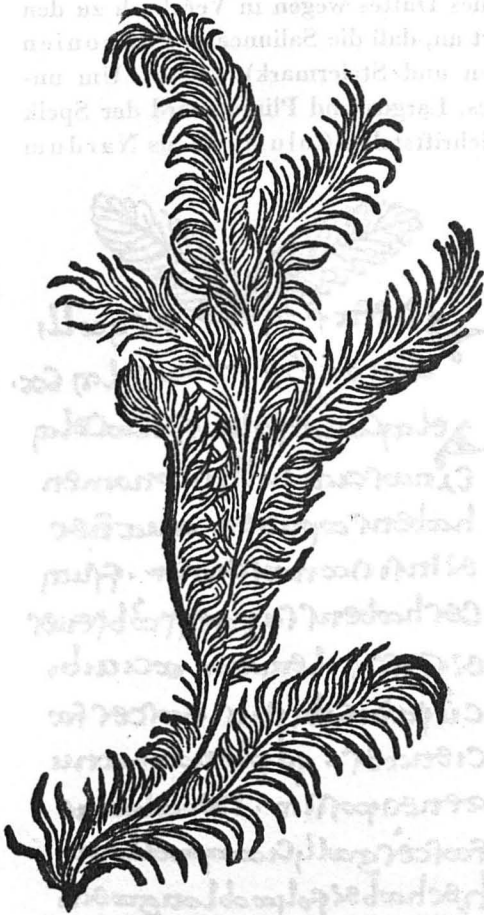
Abb. 2. Aus dem Hortus sanitatis (Mainz) vom Jahre 1485.

Spicanardus oder Spica, Nardus italica , Saliunca , Großer Speik unterschoben und medizinisch verwendet zu haben.