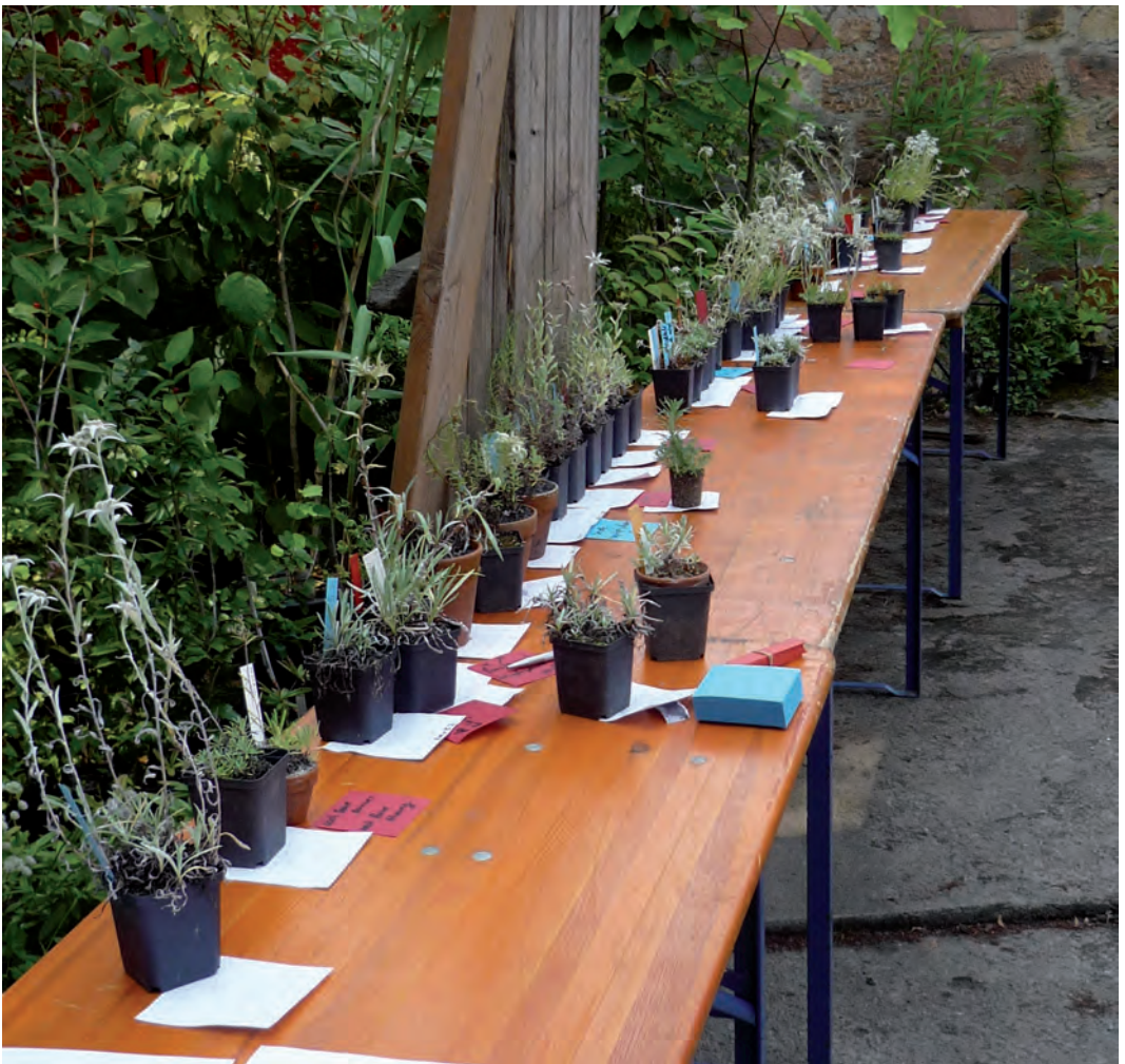
Abb. 17 a u. b: Die Edelweißsammlung des Botanischer Gartens Gießen.