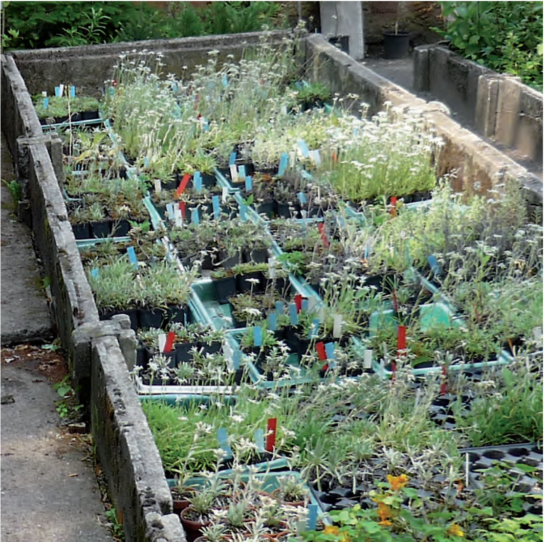
Abb. 16: Die Edelweißsammlung des Botanischen Gartens Gießen.