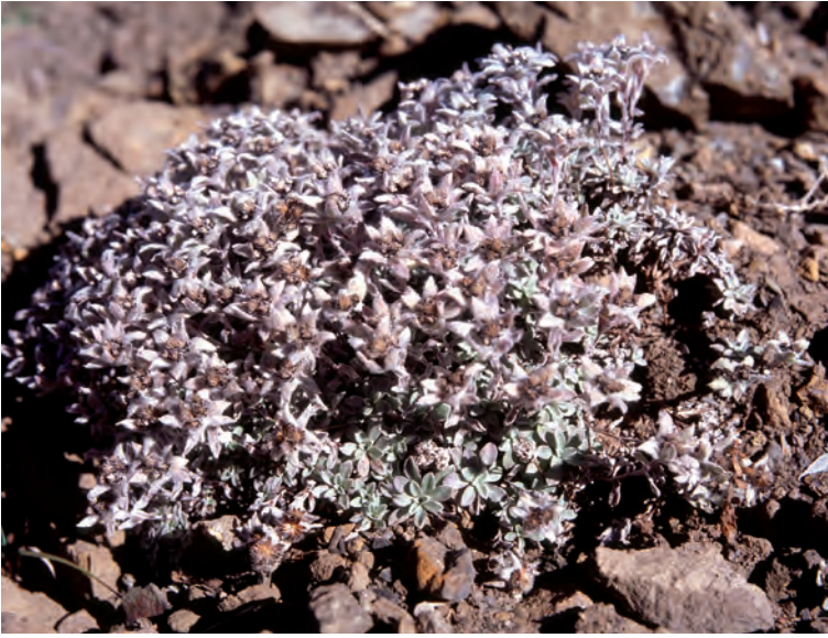
Abb. 7: Himalaya-Edelweiß ( Leontopodium himalayanum ) in der Annapurna-Region/Nepal auf ca. 4600 m.