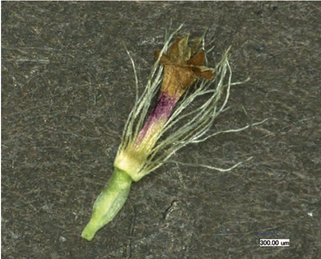
Abb. 11: Ein Pappus von Leontopodium spec. (Foto: S. Stille).

Aktuell untersuchen Wissenschaftler der Universität in Gießen die Mikromorphologie des Pappus innerhalb der Gattung Leontopodium . Ziel ist es, an Hand einer vergleichenden Morphologie des Pappus zur Klärung der Systematik der Gattung beizutragen. So könnten z.B. spezielle Strukturen an den Pappushaaren charakteristisch für eine Art sein oder nah miteinander verwandte Arten ähnliche Pappusstrukturen aufweisen.