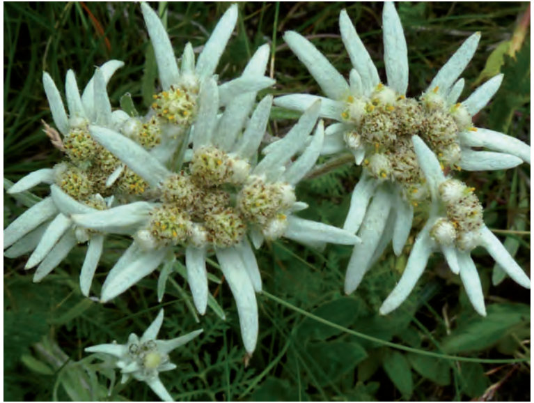
Abb. 9: Edelweiß-Art Leontopodium ochroleucum , Altai/Westsibirien.