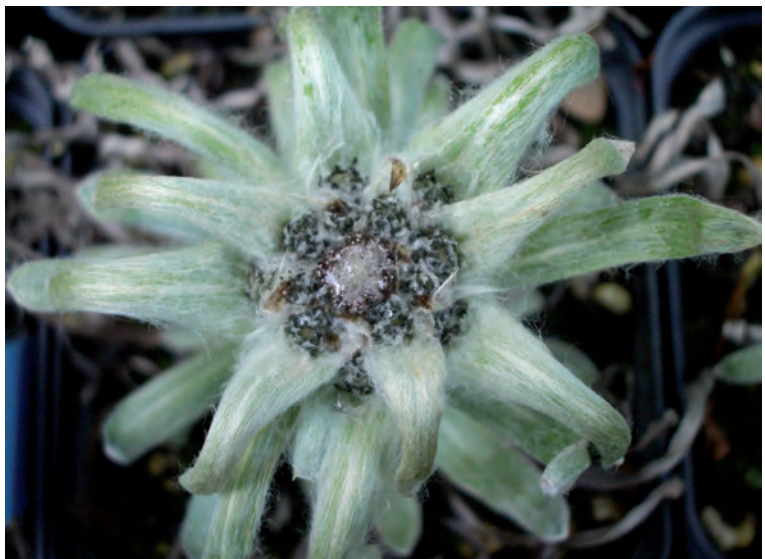
Abb. 13: Deutliche Hochblattbehaarung an einem Stern von L. himalayanum (Botanischer Garten Gießen) (Foto: S. Stille & M. Jäger in der Edelweiß-Sammlung des Botanischen Gartens der Universität Gießen).

VIGNERON et al. veröffentlichten 2005 eine Arbeit, in der sie die Beschaffenheit der Hochblattbehaarung von L. alpinum untersuchen. Mittels Rasterelektronenmikroskopie wurden die Haare untersucht. Die Forscher kamen zu dem Ergebnis, dass die Behaarung aus ökologischer Sicht einen Schutz gegen die hohe UV-Strahlung in den hochgelegenen Habitaten der Art bildet (VIGNERON et al. 2005).