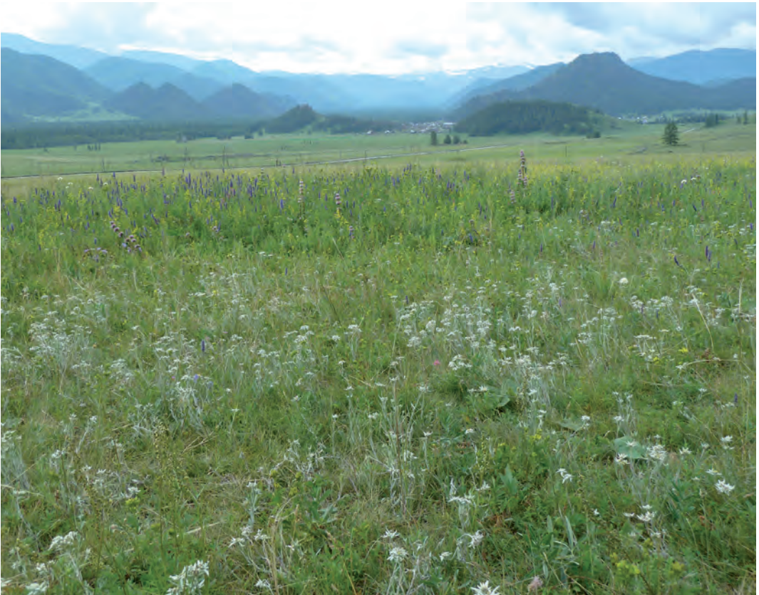
Abb. 8: Talwiese auf ca. 1000 m mit der Edelweiß-Art Leontopodium ochroleucum im Ethno-Naturpark Utsch-Enmek/Altai/Westsibirien.