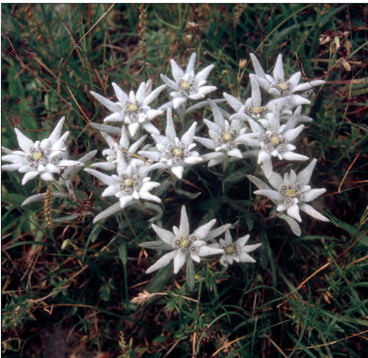
Abb. 3: Alpen-Edelweiß ( Leontopodium alpinum ) in den Julischen Alpen/Slowenien) (Foto: Th. Schauer).