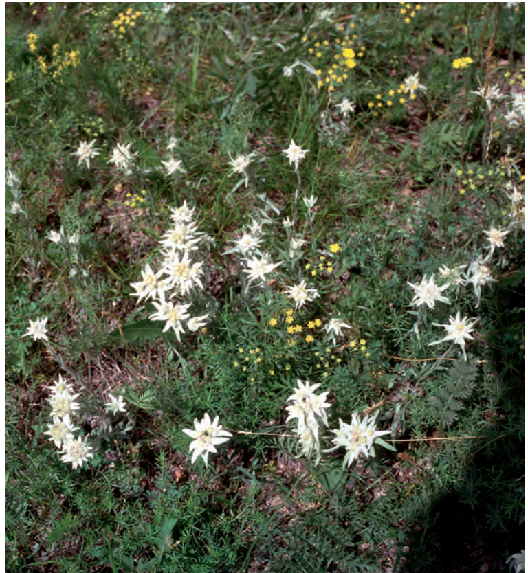
Abb. 6: Langstängelige Edelweiß-Art ( Leontopodium agg. ) in der Mongolei auf blumenreicher Wiese im Gorkhi-Terelje Nature Reserve (Nationalpark) in ca. 2500 m, etwa 80 km nordöstl. Ulanbator/Mongolei.

Auch in sehr hoch gelegenen Habitaten – bis über 5000m – findet man Vertreter der Gattung Leontopodium . Die Pflanzen (z.B. L. aurantiacum und L. muscoides ) wachsen hier in Anpassung an diesen Standort zu ganz dichten Polstern heran, die ein wenig an Moos erinnern, blühen jedoch mit dem charakteristischen Stern.