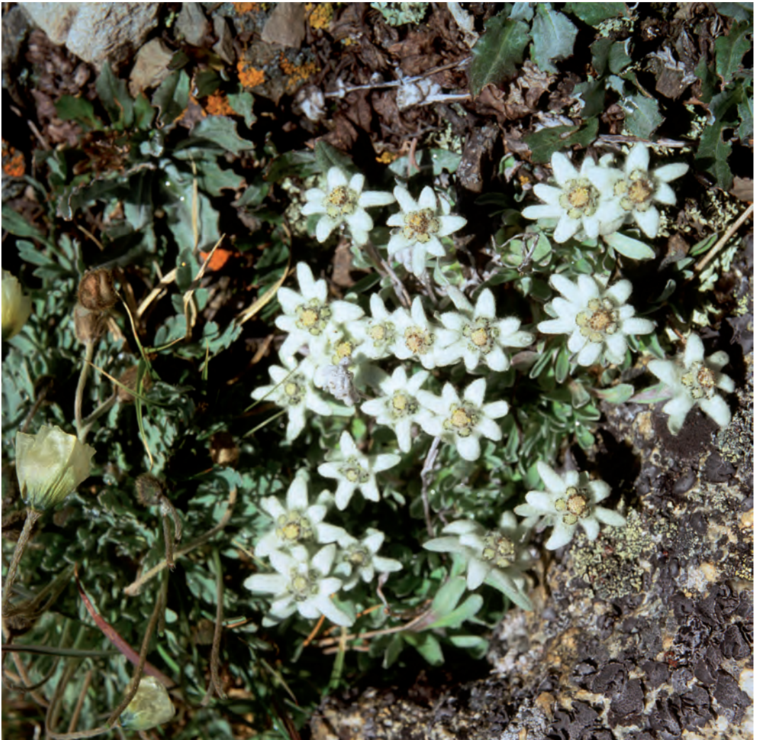
Abb. 5: Edelweiß-Art ( Leontopodium agg.) im Mongolischen Altai, Bereich Malchin auf ca. 3300 m.

Heute ist das Edelweiß im ganzen Alpenraum streng geschützt. In Deutschland ist es nach der Bundesartenschutzverordnung eine besonders geschützte Art und wird auf der Roten Liste in Bayern als "stark gefährdet" eingestuft (BArtSchV 2005 & KHELTA 2013).