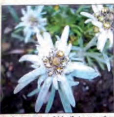
Das bekannte Alpen-Edelweiß: Leontopodium alpinum .