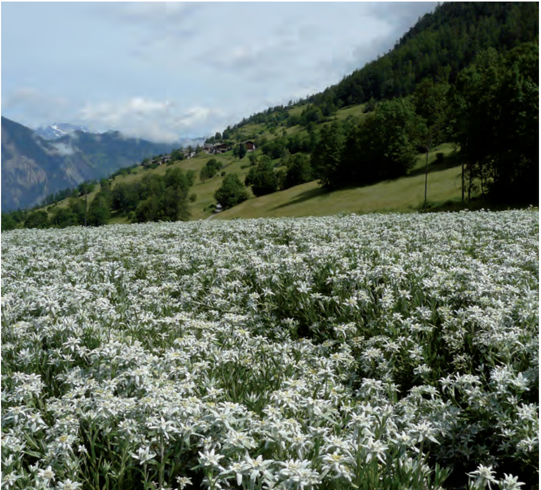
Abb. 15: Züchtung und Anbau der Edelweißsorte Helvetia in Conthey/Wallis.

Mit dem Ziel, eine gut zu kultivierende, wirkstoffreiche Sorte zu züchten, führte Agroscope (Schweizer Kompetenzzentrum des Bundes für landwirtschaftliche Forschung) seit den 1990er-Jahren ein Zucht-, Kreuzungs- und Selektionsprogramm durch. In diesem Kontext wurden Pflanzen der Art L. alpinum unterschiedlicher Herkunft gezielt miteinander gekreuzt. Gesucht wurde nach einer Sorte, die besonders wirkstoffreich – z.B. für die Kosmetik-Branche (z.B. Antioxidantien) – ist und sich im Alpenraum auf ca. 1000-1500 m besonders gut kultivieren lässt. Außerdem sollte sie möglichst regelmäßig wachsen und viele schöne Blütenstände – z.B. auch für den Blumenhandel – ausbilden. Bis zum Jahre 2003 war das Selektionsprogramm so weit vorangeschritten, dass die neue Sorte – "Helvetia" genannt – im Handel etabliert werden konnte. Heute können von jedem Interessierten Edelweißsamen dieser Sorte in riesiger Stückzahl (mehrere Zehntausend) bestellt werden (REY et al. 2011).