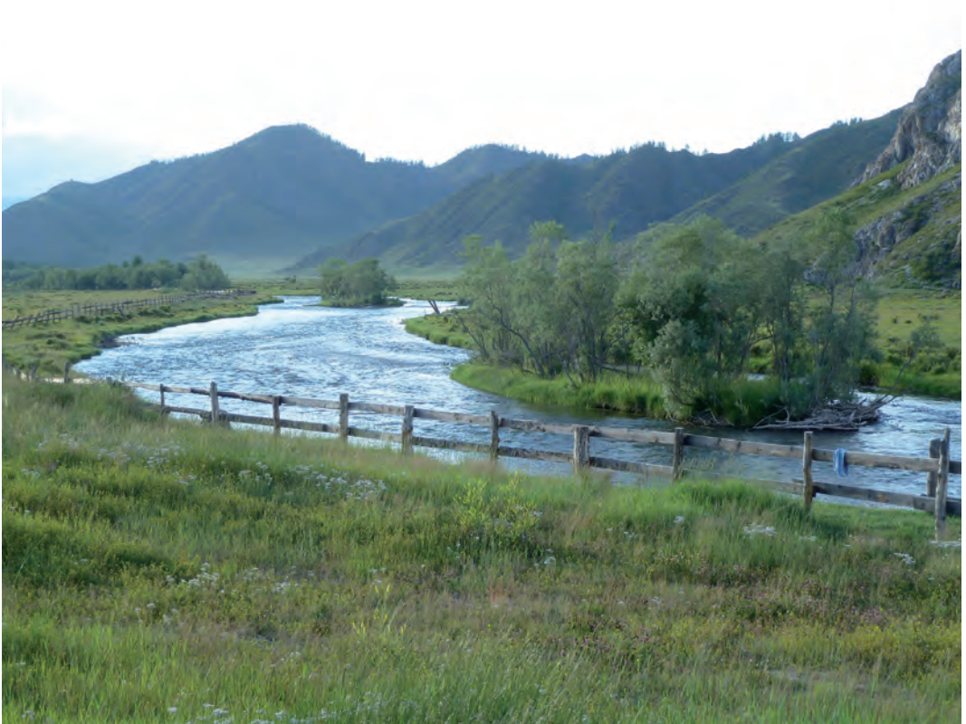
Abb. 10: Talwiese auf ca. 1000 m mit der Edelweiß-Art Leontopodium ochroleucum am Fluss Charysh, Nähe Ust-Khan-Höhle/Altai/Westsibirien.