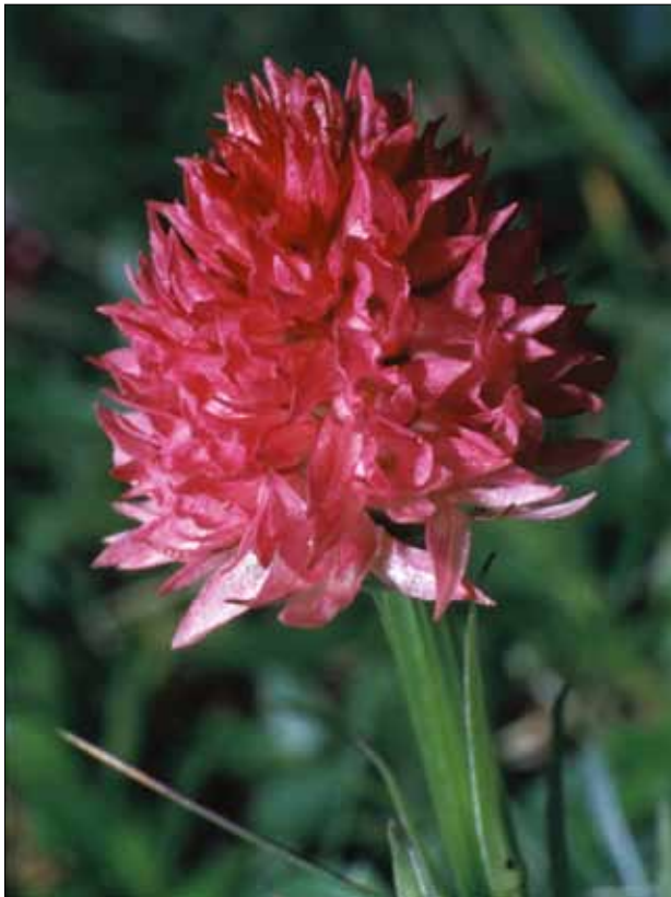
Abb. 2: Nigritella archiducis-joannis , Traweng im Toten Gebirge; 13. Juli 1999.

Diese ganz ungewöhnlich späte Blütezeit von Kohlröschen in einem Jahr, das eher unauffällig war, wenn man sich die Klima-Reihen bei HISTALP ansieht ( http://www.zamg.ac.at/histalp ), sollte nicht dazu verleiten, sich darauf zu verlassen, dass man in den Ostalpen im August noch schöne Nigritellen finden wird, ausgenommen die später blühende N. rhellicani . (Anm.: Beim Fensterbachsturz haben die Nigritellen 2011 schon Ende Juni geblüht, und bei den als N. miniata bezeichneten Pflanzen handelt es sich um N. bicolor .)