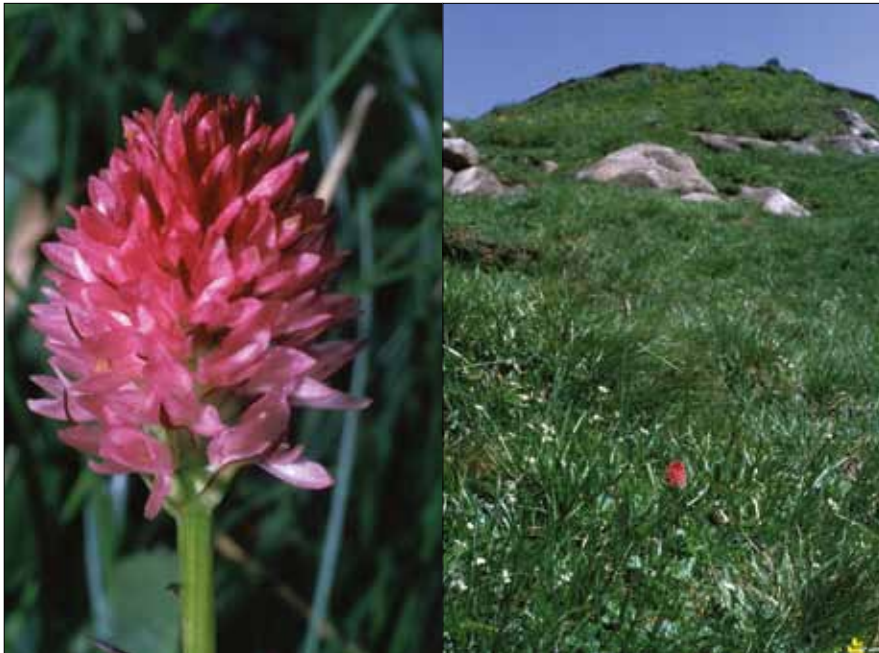
Abb. 6: Nigritella archiducis-joannis am Seespitz auf der Koralpe, rechts die Fundstelle, 20. Juli 2006.

Noch zu Beginn des 20. Jahrhunderts waren erst zwei Arten wissenschaftlich beschrieben, nämlich Nigritella nigra (L.) RCHB. fil. und Nigritella rubra (WETTST.) K. RICHT.