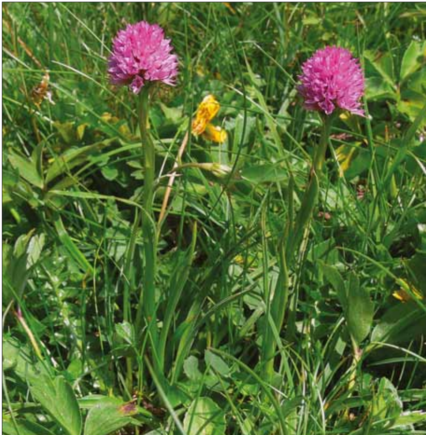
Abb. 5: Nigritella archiducis-joannis , Hochobir (Karawanken); 6. Juli 2006, Foto: Helmuth Zelesny.