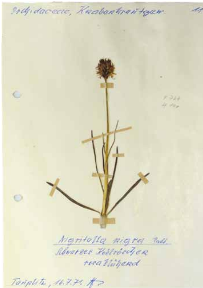
Abb. 3: Herbarbeleg von (höchstwahrscheinlich) Nigritella archiducis-joannis , gesammelt am 16. Juli 1971 (oder am 15. Juli?) von Erwin Hofmann auf der Tauplitzalm.

Detail: Zwischen zwei Seiten des Tagebuches liegt lose ein gepresstes, hellblütiges Kohlröschen, vermutlich eine der drei Pflanzen, die auf dem Dia abgebildet sind.