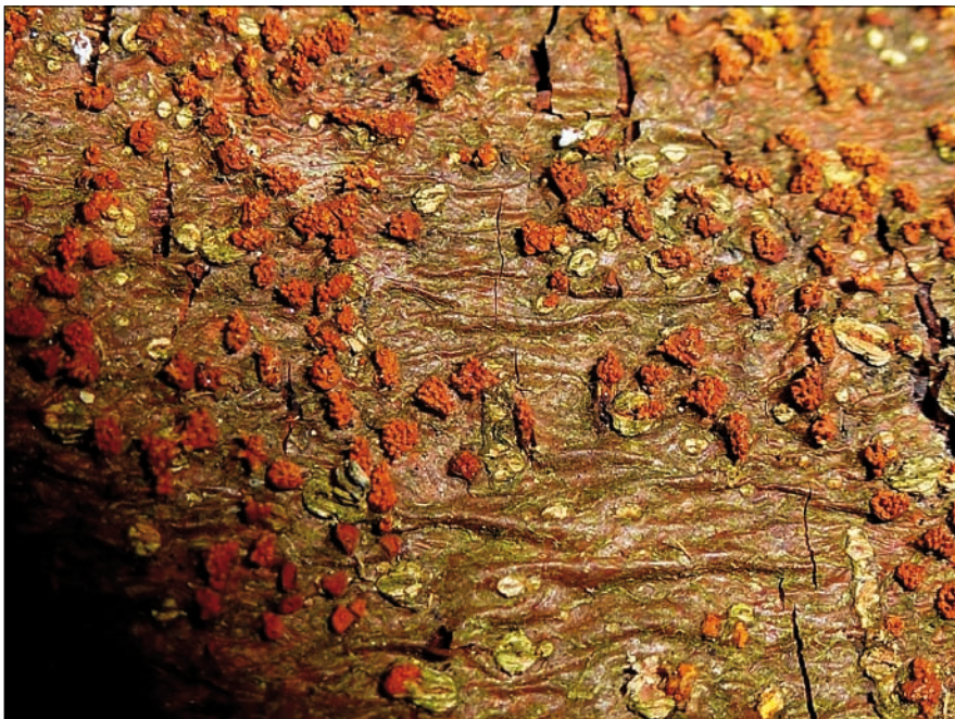
Abb. 2: Der Edelkastanienkrebs oder Kastanienrindenkrebs ( Cryphonectria parasitica ) aus der Umgebung von Bad Gams in der Weststeiermark