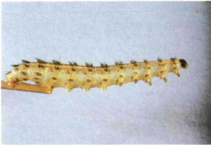
Abb. 7: Dysauxes punctata F., Coll. OÖ. Landesmuseum, ausgeblasene Raupe.

ancilla L., D. punctata F. (Abb. 7 und 8), von den Spannern (Geometridae) Alcis jubata THNB., Cleorodes lichenaria HUFN. (Abb. 9 und 10) und von den Sackträgern (Psychidae) Solenobia manni Z. (Abb. 11), Narycia monilifera GEOFF-