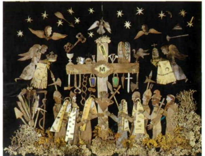
Abb. 20: Arma-Christi-Bild, das um 1887 von einem kränklichen Burschen in Freistadt angefertigt wurde. Als Sträucher sind die Flechten Pseudevernia furfuracea und Hypogymnia physodes verwendet worden.