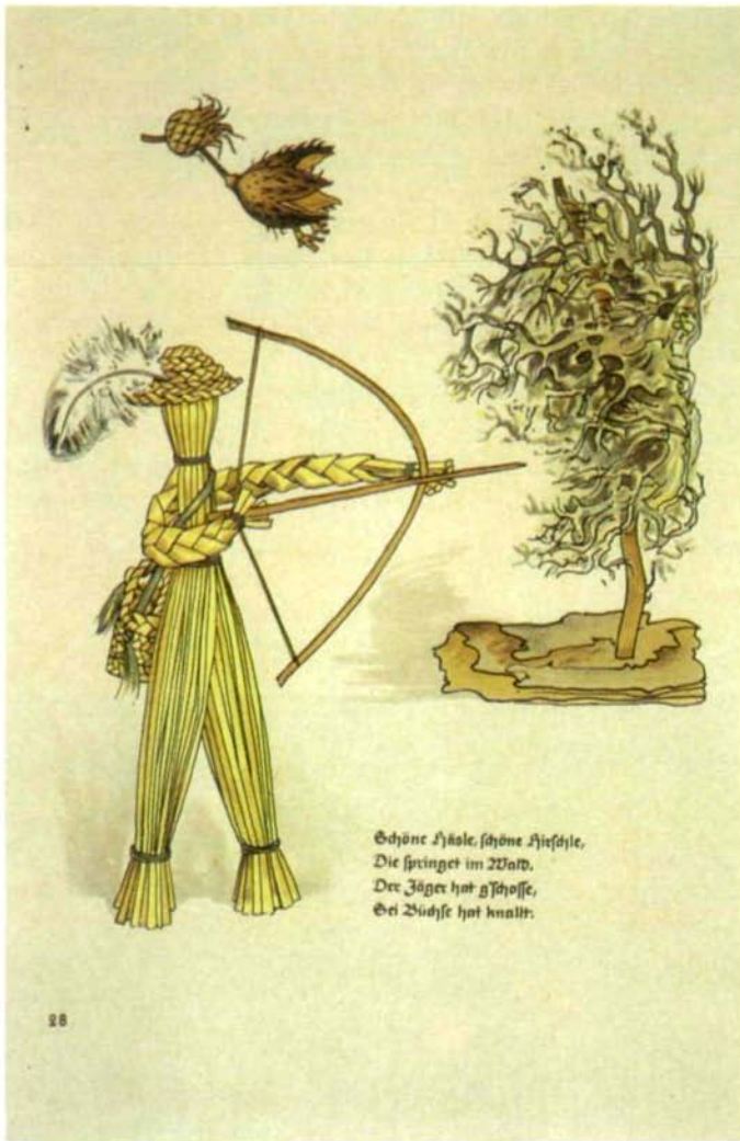
Abb. 18: „Spielzeug aus Wald und Wiese.“