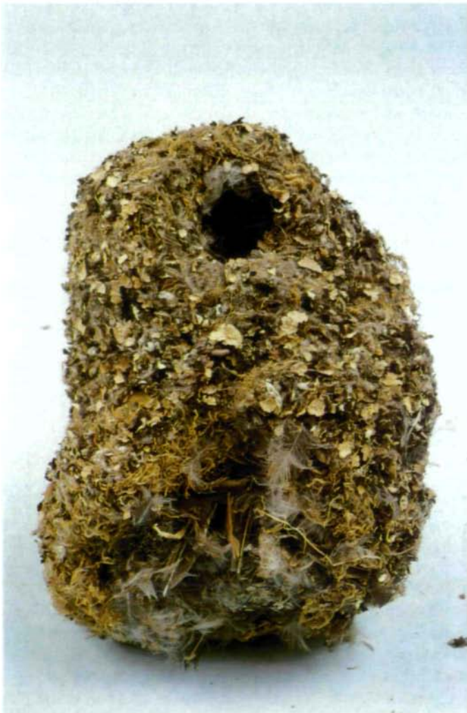
Abb. 16: Nest einer Schwanzmeise = Aegithalos caudatus (L.), das hauptsächlich aus der Flechte Parmelia sulcata besteht. Coll. OÖ. Landesmuseum (Inv. Nr. 1943/778).

Flechten zum Basteln an (Abb. 18). Beim Krippenbau werden sie schon seit langem verwendet. Vereinzelt sind auch andere Bastelarbeiten erhalten geblieben, die Flechten zur Dekoration zeigen. So haben einzelne Bände der Xylothek, die am OÖ. Landesmuseum aufbewahrt wird, am Buchrücken oben einen gelben Streif aus aufgeklebter Xanthoria parietina und im oberen Drittel befindet sich zudem ein grauer Thallus von Evernia