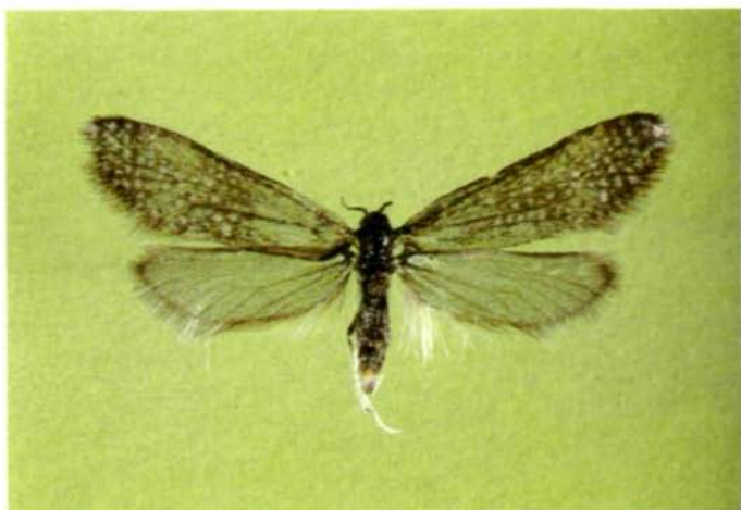
Abb. 11: Solenobia manni Z., Männchen aus Aggsbach, Niederösterreich, leg. F. LICHTENBERGER.