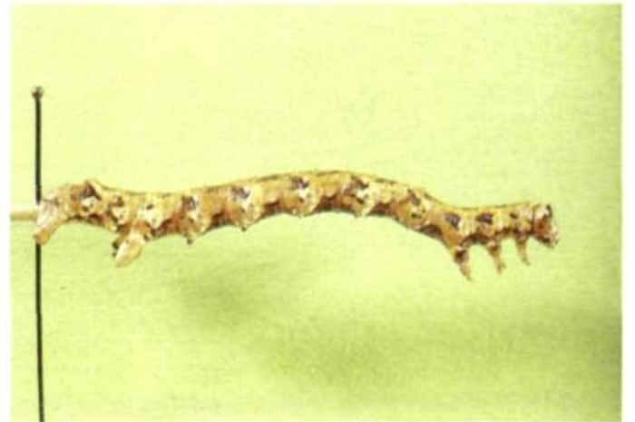
Abb. 10: Cleorodes lichenaria HUFN., Coll. OÖ. Landesmuseum, ausgeblasene Raupe.