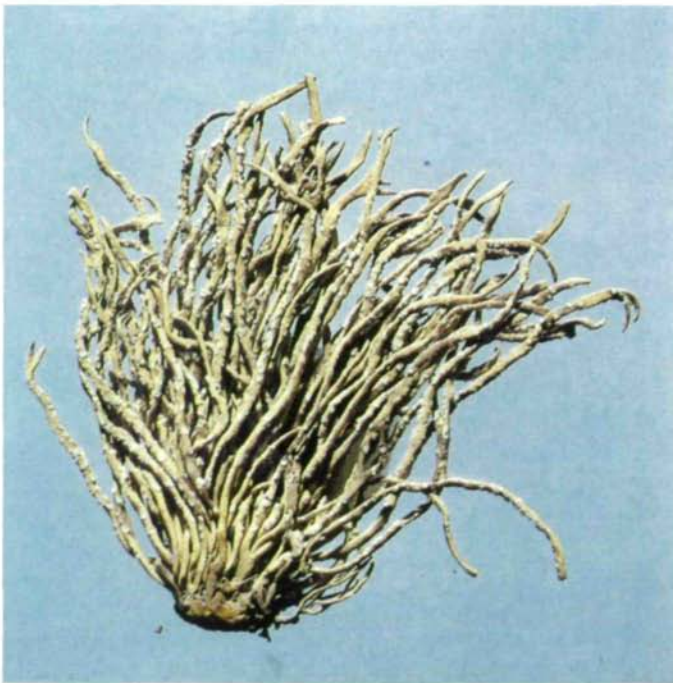
Abb. 23: Rocella tinctoria L., die Lackmusflechte, ein Exemplar, das auf einem heißen Felsen der atlantischen Steilküste in Gibraltar gesammelt wurde (W).

licherweise nicht sehr lange lichteht. Chemisch handelt es sich dabei vor allem um Abkömmlinge der Erythrinsäure, Lecanorsäure und Gyrophorsäure. Heute wird nur in England der „Harris Tweed“ mit solchen Flechtenfarben gefärbt. Die käufliche Orseille ist eine teigige Masse von rotvioletter bis dunkelvioletter Farbe, die nach Ammoniak riecht und ekelerregenden Geschmack hat. Es ist wahrscheinlich ein Farbstoffgemenge, dessen wesentlichster Bestandteil das Orcein ist. Die Masse enthält außerdem noch Reste der Flechten, besonders die gut erhaltenen Gonidien und außerdem hie und da korrodierte Kristalle oxalsäuren Kalks. Orseille ist ein subjektiver Farbstoff und wurde ursprünglich zur Färbung von Wolle und Seide verwendet. Pflanzenfasern lassen sich mit ihr nicht färben. Zur Färbung löste man Orseille in warmem Wasser fast bis zum Kochen auf. Wolle wird bei hoher, Seide bei niedrigerer Temperatur gefärbt. Die Farbe ist sehr schön, doch wenig haltbar. Dies ändert sich auch nicht bei Verwendung einer Beize wie Alaun oder Weinstein. Aus diesem Grunde wandte man Or-