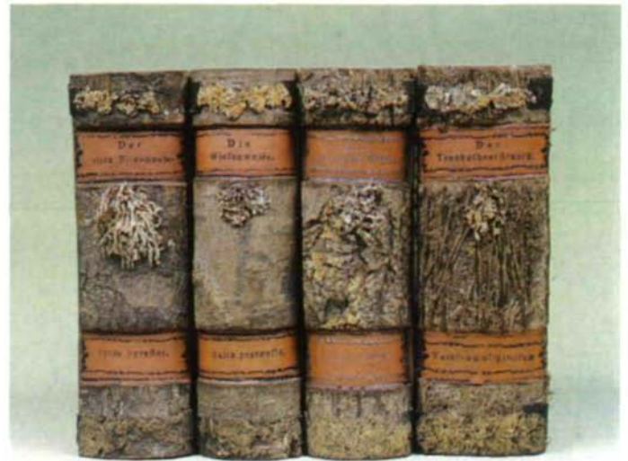
Abb. 19: Vier Bände aus der 100bändigen Xylotheke (= Holzbibliothek des OÖ. Landesmuseums). Auf jedem Rücken ist oben ein Streifen mit Xanthoria parietina (L.) Th. Fr. und unterhalb der deutschen Beschriftung ein Thallus von Evernia prunastri (L.) ACH. aufgeklebt.