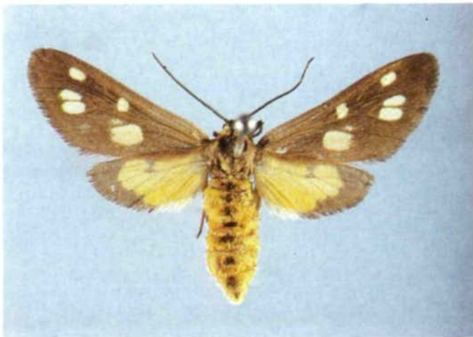
Abb 8: Dysauxes punctata F., Coll. OÖ. Landesmuseum, Falter.