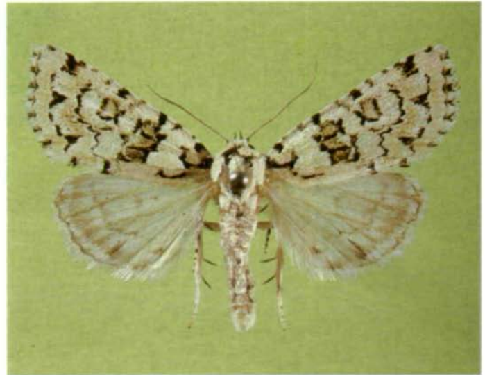
Abb 5: Bryophila muralis FORST., leg. A. BINDER, Coll. OÖ. Landesmuseum.

87 Schmetterlingsarten, deren Raupen Flechten fressen! Aus dieser großen Zahl von Schmetterlingen können hier freilich nur wenige vorgestellt werden. Von den Eulen (Noctuidae) werden Cyrphila receptricula HBN., Bryoleuca ereptricula TR.