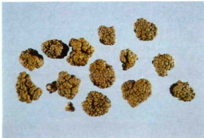
Abb. 1: Sphaerothallia esculenta (= Lecanora esculenta ), die Mannaflechte aus Karput in Kurdistan, März 1864, H. W. REICHARDT (W).

Arten der Gattung Umbilicaria s.l., den Entdeckern als „tripe