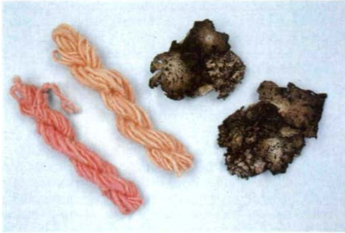
Abb. 24: Schafwolle, die mit Farbstoff aus Lasallia pustulata gefärbt wurde.

fig als Giftköder eingesetzt, da die in ihr enthaltene Vulpinsäure besonders für fleischfressende Tiere sehr giftig ist. Es ist demnach abzuraten, sie zu verwenden.