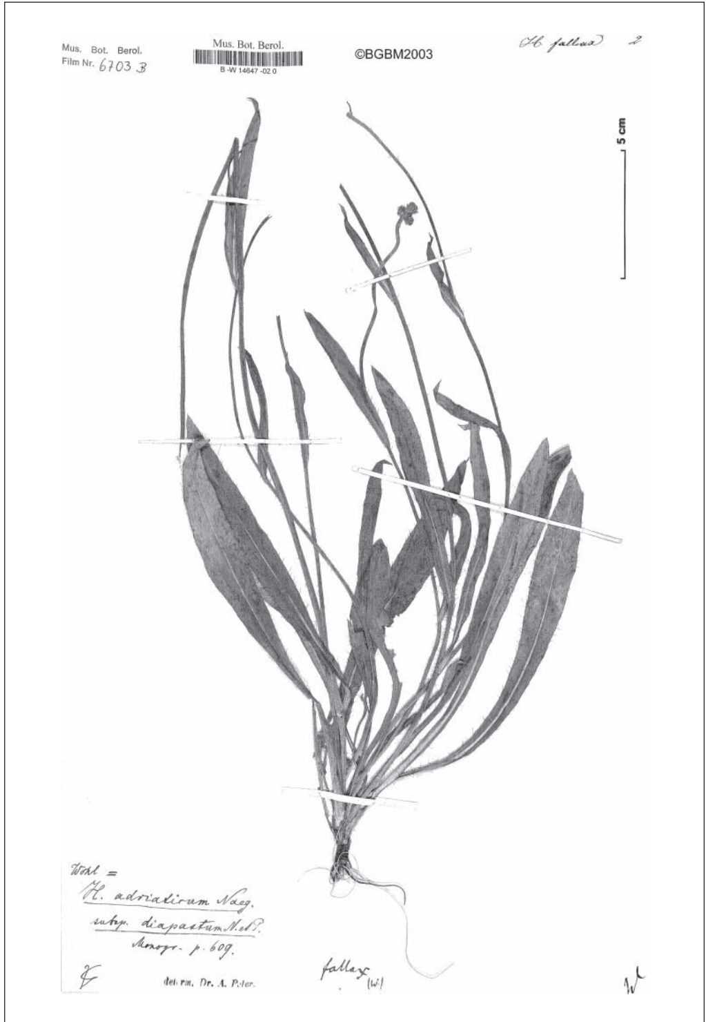
Abb. 3: Hieracium fallax , Lectotypus, Herbarium Willdenow, Berlin (B-W-14647-2).