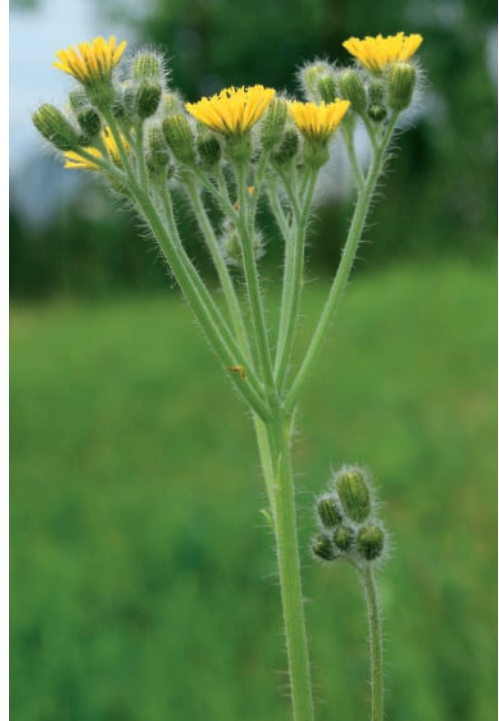
Abb. 1: Pilosella cymosiformis (= Hieracium fallax auct. non WILLD.), Synfloreszenz; Rheinland-Pfalz, Kirchheimbolanden, Industriegebiet (MTB 6314/13), 8.6.2012 (Go-50813).

Anmerkungen: Über die Herkunft des oder der Typus-Exemplare schreibt Frölich im Protolog, dass er von Heim gesammeltes Material gesehen habe („v[idi] s[peciem] s[iccam] et cult. à cl. Heim“). Bei diesem Sammler handelt es sich vermutlich um den berühmten Berliner Arzt Ernst Ludwig Heim (geb. 1747 in Solz, Thüringen, 1764–66 Gymnasium Meiningen, 1766–70(?) Studium der Medizin in Halle, ab 1775 Arzt in Berlin, gest. 1834 in Berlin), von dem sich Belege in HAL befinden (freundl. Mitt. von U. Braun, Halle), leider keine von P. cymosiformis . Auch aus den leider nur auszugsweise publizierten Tagebüchern Heims (KÖRNER 1989) lässt sich nicht entnehmen, wann Heim bei