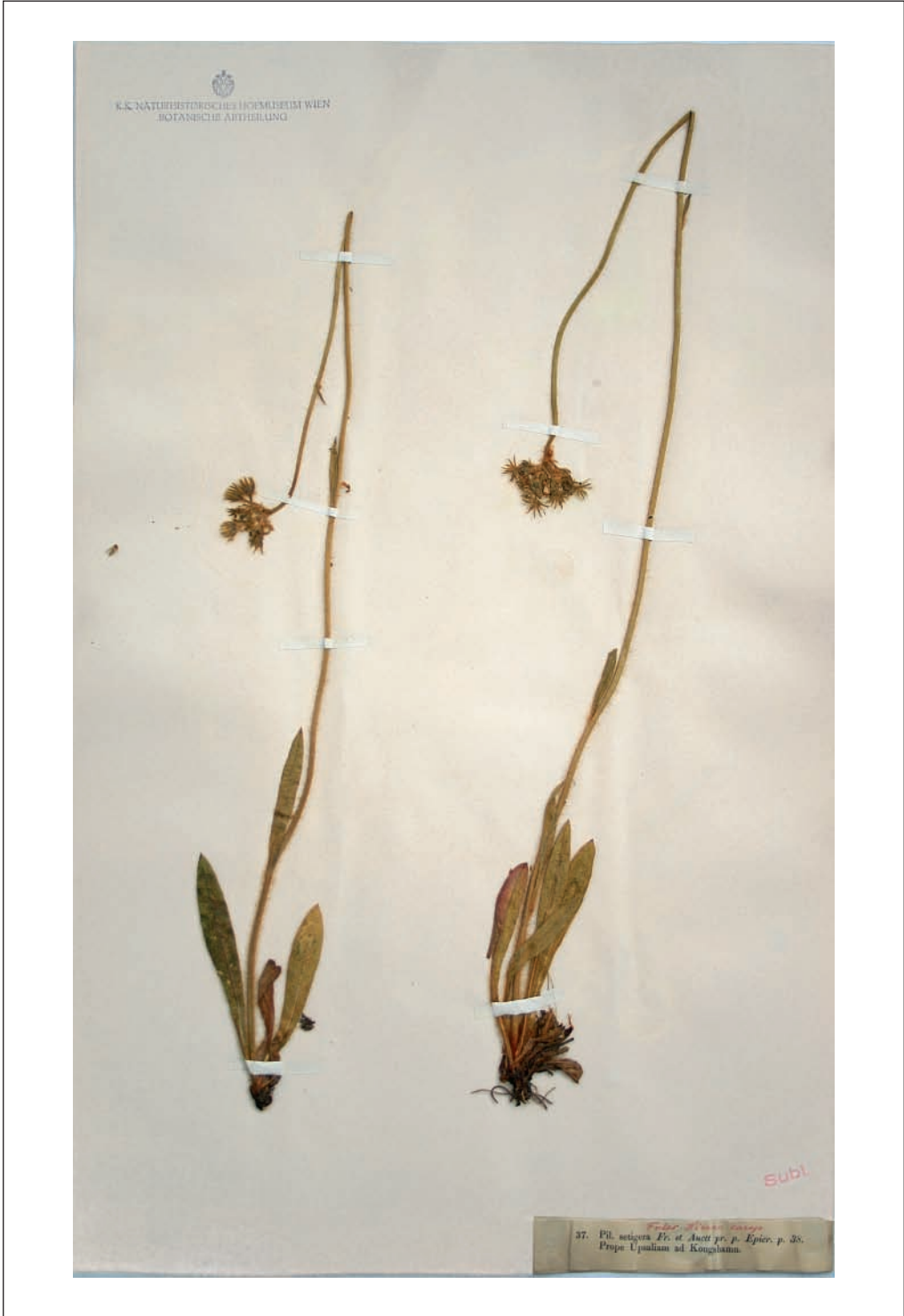
Abb. 6: Pilosella setigera (W.), Lectotypus.