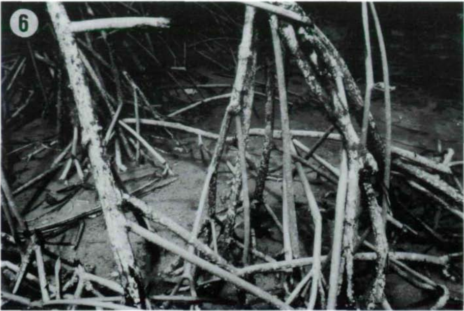
Abb. 6: Playa El Coco, Stelzwurzeln von Rhizophora mangle mit ungewöhnlich reichlichem Flechtenbewuchs.