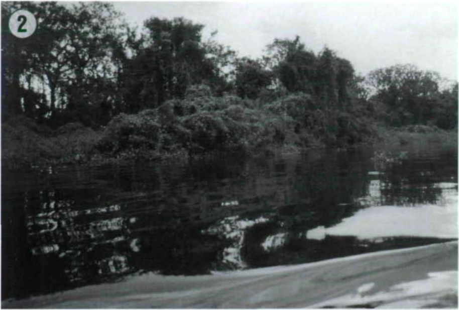
Abb. 2: Überschwemmungswald am Rio San Juan westlich von El Castillo.