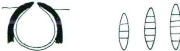
Abb. 7-8: 7 - Lasioloma appendiculata , Konidie. 8 - Porina pseudomalmei , Perithecium und Sporen.