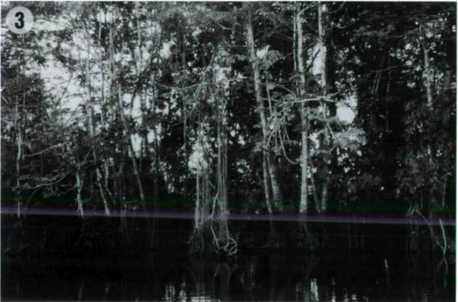
Abb. 3: Tieflandregenwald am Rio Bartola.