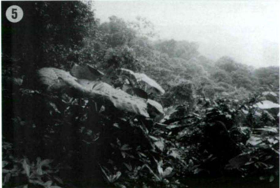
Abb. 4-5: Bergregenwald am Vulkan Madera.