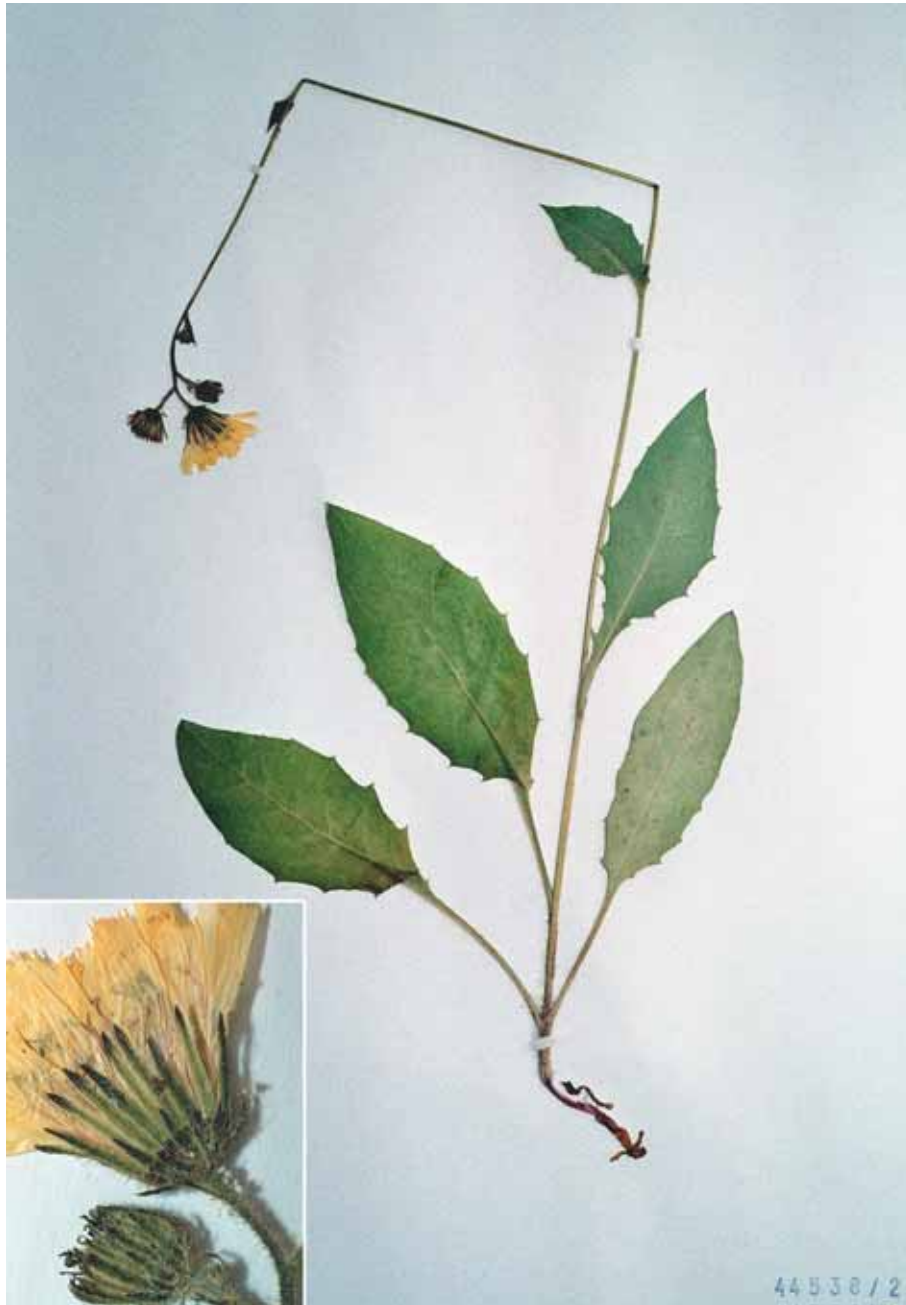
Abb. 5: Hieracium metallicorum GOTTSCHL.