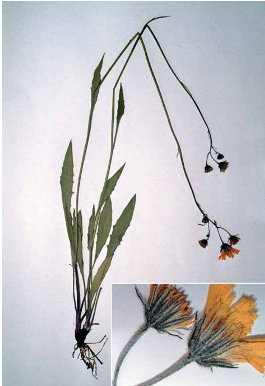
Abb. 2: Hieracium insubricum GOTTSCHL.