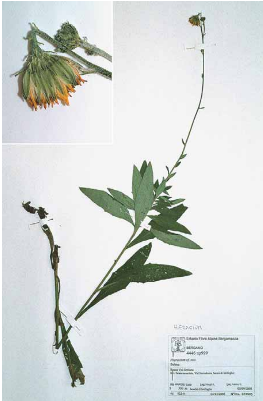
Abb. 7: Hieracium brevifolium subsp. lombardense GOTTSCHL.