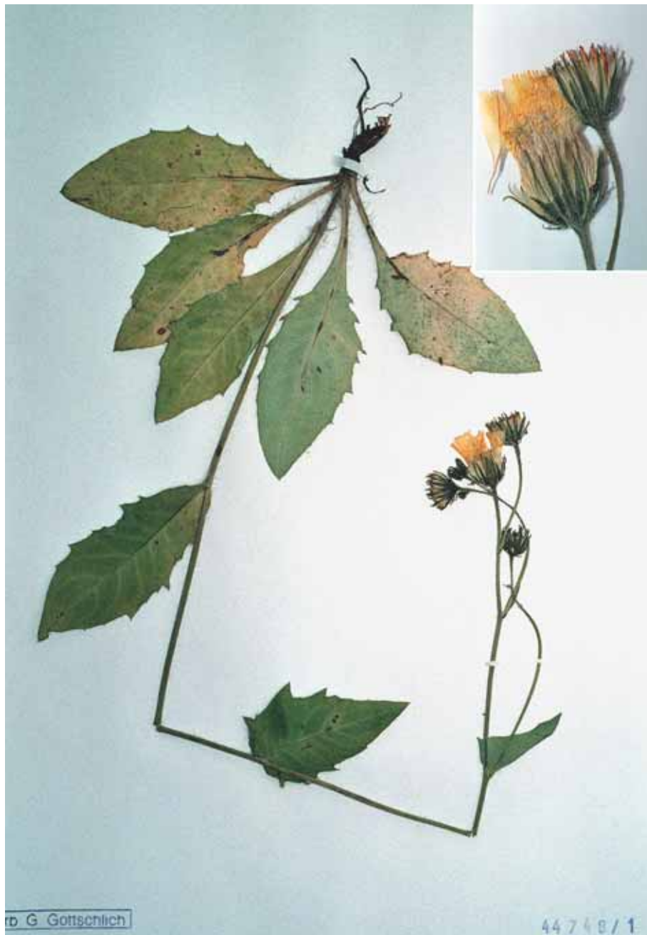
Abb. 3: Hieracium duronense GOTTSCHL.