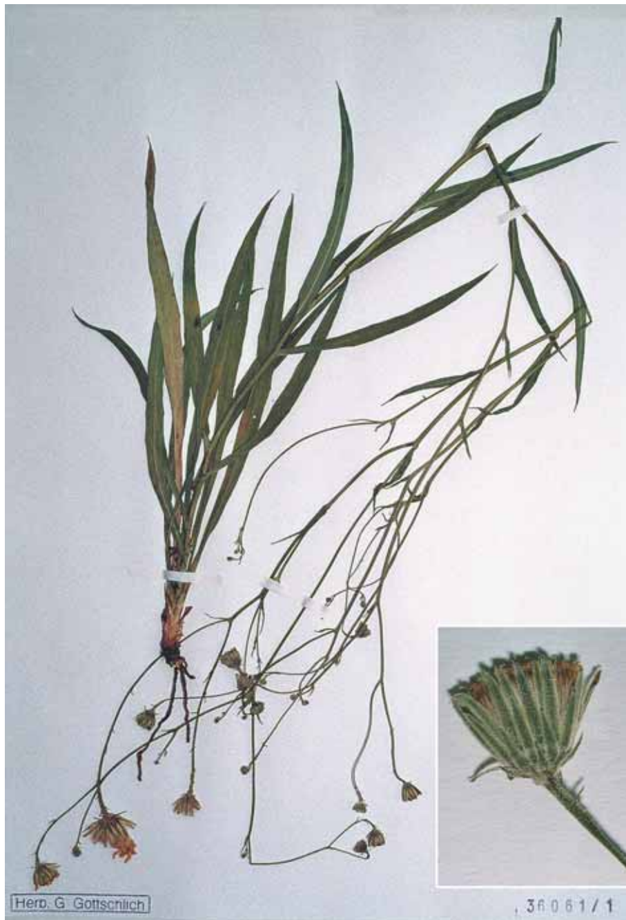
Abb. 1: Hieracium thesioides GOTTSCHL.