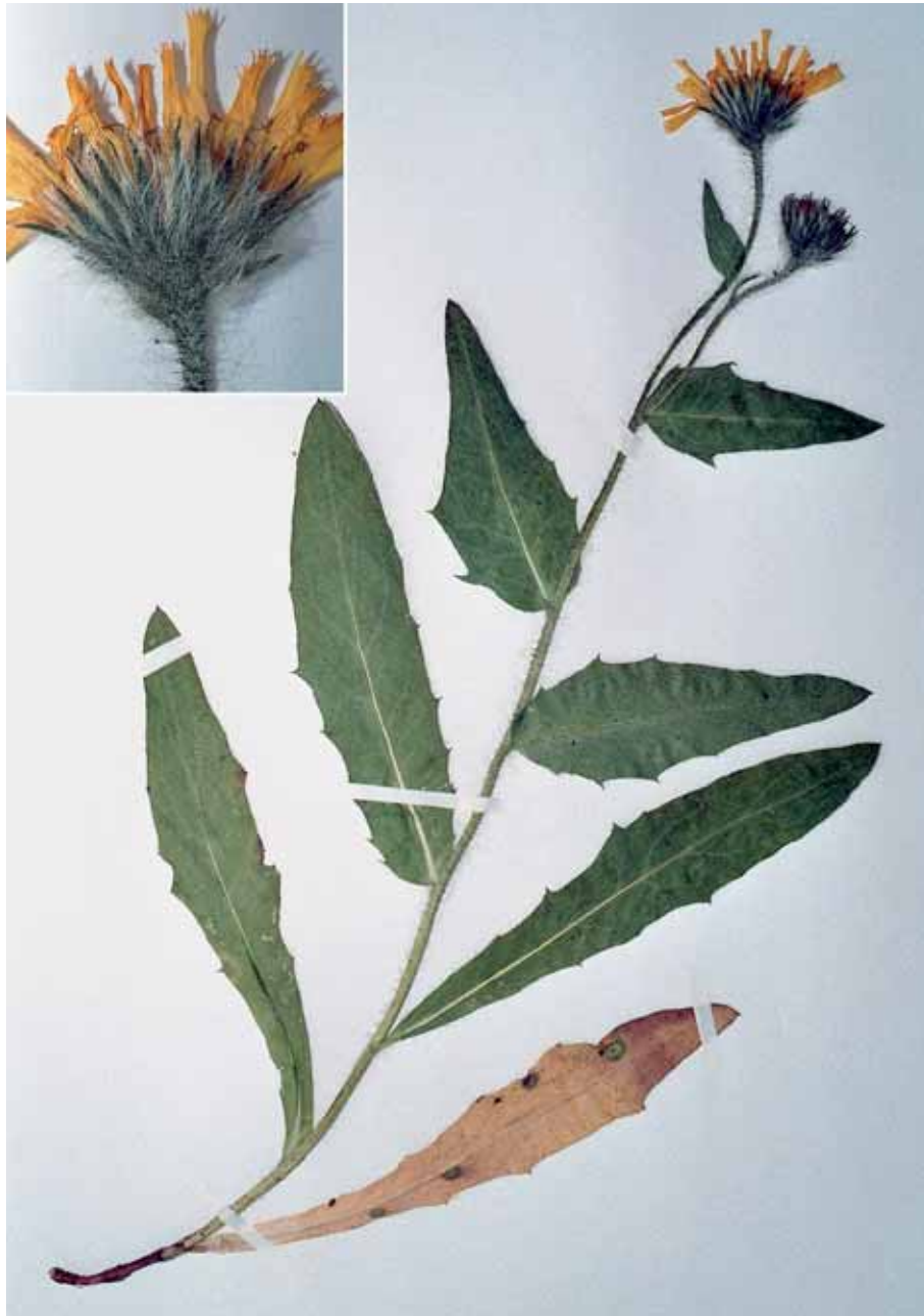
Abb. 4: Hieracium grossicephalum GOTTSCHL., BRANDST. & DUNKEL