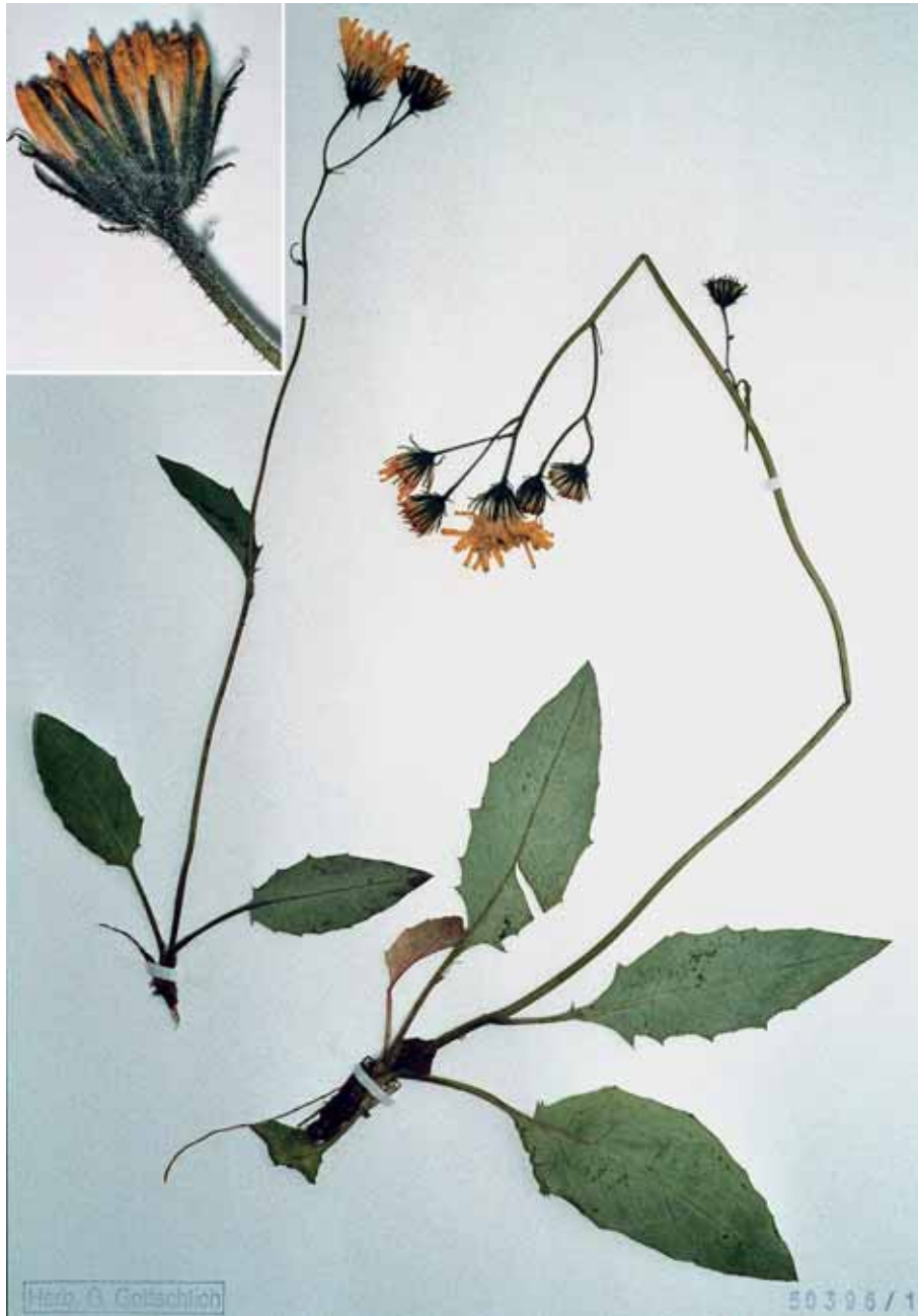
Abb. 6: Hieracium murorum subsp. macilentigenum GOTTSCHL.