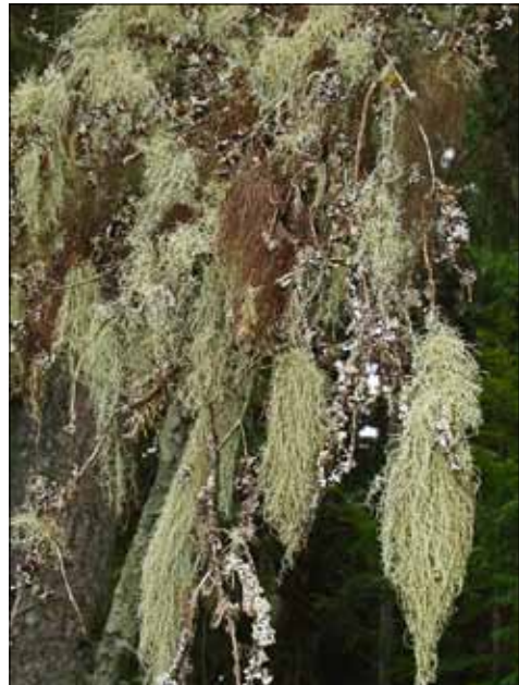
Abb. 3 und 4. An sehr luftfeuchten, nebelreichen Lokalitäten entwickeln sich Bartflechten. Sie gehen infolge Klimaerwärmung und durch forstliche Eingriffe deutlich zurück. Gelbgrünliche Bärte gehören zur Gattung Usnea (hier U. dasopoga ), graue bis braune Bärte zu Bryoria .