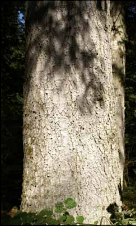
Abb. 22. Ein mächtiger Tannen-Stamm, scheinbar ohne Flechten; doch ist er hier bis auf das letzte Fleckchen mit der seltenen Tannen-Strahlflechte ( Lecanactis abietina ) bewachsen. Diese Art ist typisch für sehr luftfeuchte, kühle bis kalte Habitate (Totdmoos).