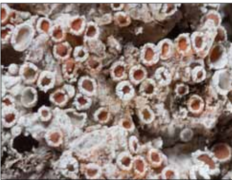
Abb. 23. Die Ulmen-Gruffflechte, die auf basenreichen Borken von Altbäumen in naturnahen Wäldern lebt, ist außerhalb der Alpen in Mitteleuropa nur noch von wenigen Lokalitäten bekannt.

stände. Derzeit nehmen die Bestände rapide ab. Von Cyphelium inquinans und C. karelicum kennen wir nur noch ca. sechs besiedelte (Uralt-)Bäume im gesamten Schwarzwald. Die gefährdeten Gesellschaften historisch alter Wälder sind zumeist im Privat- und Gemeindewald zu finden, Schutzbemühungen sind daher schwieriger als im Staatswald, so dass auch das Zielartenkonzept (WIRTH 2002, BRAUNISCH et al. 2020) nicht greift, mit dem 10 Prozent der Fläche des Staatswaldes aus der Nutzung genommen werden sollen.