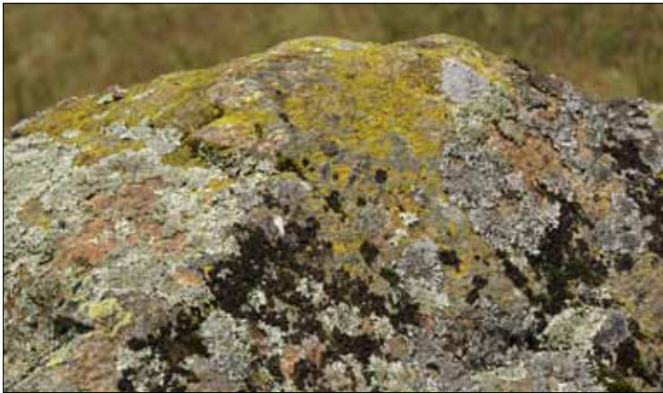
Abb. 12. Häufig von Vögeln besuchte, entsprechend gedüngte Felskuppen heben sich durch die gelbe Farbe der Korallen-Dotterflechte ( Candelariella coralliza ) ab (Muggenbrunn).

Recht typisch für den Südschwarzwald ist eine durch die orange Färbung auffallende Flechtengesellschaft, die an der Basis alter Bergahorne wächst, wie sie im Bereich von Bauernhöfen oder vereinzelt noch an Landstraßen stehen (Abb. 9). Die auch Laien auffallende Färbung wird verursacht von einer kleinlappigen Art, die in größeren Herden auftritt, von einer Verwandten der Gelbflechte: Gallowayella ( Xanthoria , Xanthomendoza ) fulva . Die Konzentration dieser nitrophytischen Flechte auf die Stammbasis ist durch das größere Nährstoffangebot (und einen erhöhten pH-Wert) am Stammfuß bedingt, der durch Staub-