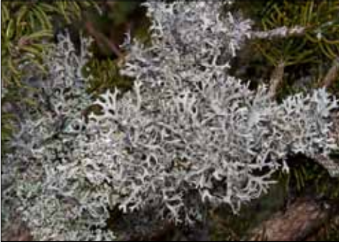
Abb. 2. Die Gabelflechten-Gesellschaft mit der struppigen Pseudevernia furfuracea ist wohl die häufigste Flechtengesellschaft im Schwarzwald. Die Biomasse kann erheblich sein.

glauca , Parmelia saxatilis und Hypogymnia physodes , an Stämmen zusätzlich Hypogymnia farinacea , alle wie die Gabelflechte weißgrau bis graue, „lappig“ bis strauhig wachsende Arten. Es handelt sich bei ihnen um ausgeprägte Acidophyten; sie besiedeln also Rinden, die an der Oberfläche deutlich sauer reagieren, wie dies besonders bei Nadelbäumen der Fall ist.