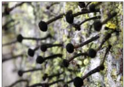
Abb. 7. Die Stecknadelflechten (Gattungen Chaenotheca und Calicium , hier Calicium viride ) finden sich an regengeschützten Flanken alter Bäume, besonders Nadelbäume in höheren Lagen.