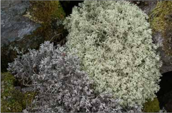
Abb. 20. Die beiden Rentierflechten Cladonia rangiferina (weiß: Echte R.) und Cladonia arbuscula (gelblich: Wald-R.).