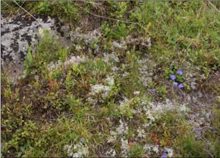
Abb. 19. Auf Extensivweiden können sich zwischen Felsblöcken an weniger trittgefährdeten Stellen mitunter noch Rentierflechten halten. Derartige Biotope sind sehr organismenreich (Muggenbrunn).

aurella , Caloplaca citrina -Aggr., Caloplaca oasis , Lecanora dispersa , Protoblastenia rupestris , Rusavskia elegans . Sie kommen nur selten oder sehr selten im Schwarzwald in natürlichen Felshabitaten vor. Einige Arten, wie Candelariella medians , sind im Südschwarzwald bislang nur auf künstlichen Unterlagen gefunden worden. Derartige Flechten sind für den Naturschutz ohne Bedeutung und tragen nicht zur Eigenständigkeit und zum Charakter der Flechtenbiotope des Schwarzwaldes bei, sind aber gerade in einem Biosphärengebiet, das Siedlungen einschließt, erwähnenswert, vor allem in einer Hinsicht: Sie erhöhen in einem Gebiet, in dem kalkreiche Gesteine von Natur aus fehlen, die Diversität der Flechtenflora erheblich.