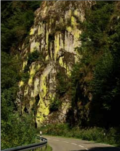
Abb. 16. Die Schwefelflechte Chrysothrix chlorina kann ganze Felspartien gelb einfärben (Wehratal).