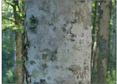
Abb. 5. Buchenstamm in Bergahorn-Buchenwald im Feldberggebiet. Die Oberfläche ist ganz mit hellen Krustenflechten der Gattungen Pertusaria ( amara , coccodes ) und Phlyctis argena bedeckt.

In hochmontanen Lagen kommt die „Schneepegel-Gesellschaft“ vor, bevorzugt an Fichten, Tannen, Buchen und Ebereschen. Der Name rührt daher, dass sie die im Winter schneebedeckte Basis der Bäume einnimmt (Abb. 6). Eine der Charakterarten dieser Assoziation, des Parmeliopsidetum ambiguae , ist die leuchtend gelbe Kiefern-Tartschenflechte Cetraria pinastri ; sie ist sel-