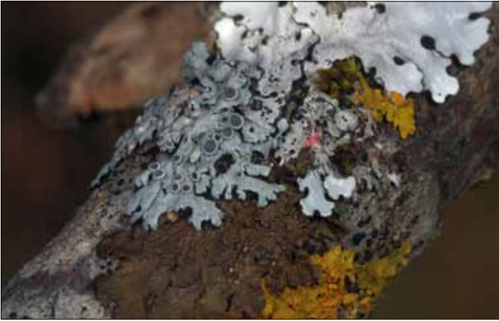
Abb. 8. Eschenzweig mit buntem Flechtenmosaik. Grau (mit Früchten): Physcia ai-polia , grauweiß (oben): Parmelina pastillifera , braun: Melanelixia subargentifera , gelb: Xanthoria parietina , rosa: Flechtenparasit Illosporopsis christiansenii auf Resten von Physcia adscendens , schwarze Fruchtkörper: Lecidella elaeochroma . Astbreite ca. 2 cm. Geschwend.

ten geworden, vermutlich eine Folge des Klimawandels. Rückgänge zeigt auch die graue Parmeliopsis hyperopta . Die sehr ähnliche, namengebende Kennart Parmeliopsis ambigua mit ihren kleinen schmallappigen gelblichgrünen Rosetten ist hingegen noch verbreitet. Die Schneepegel-Gesellschaft kommt auch an den Flanken von entrindeten Stümpfen und an stehendem Totholz vor, an Habitaten, die sonst eher von sehr unauffälligen Flechten mit oft kaum entwickeltem, im Holz lebendem Thallus besiedelt werden, so dass sie von Nicht-Flechtenkundlern selten wahrgenommen werden. Gleichwohl bergen sie eine große Anzahl von Arten. An senkrechten, regenabgewandten Flächen wachsen mehrere Arten von Stecknadelflechten ( Chaenotheca und Calicium ) (Abb. 7), die mit ihren Millimeter großen stecknadelförmigen Fruchtkörpern größere Flächen bedecken können; am häufigsten ist Calicium glaucellum . Eine der Charakterflechten auf Holz ist an beregneten Habitaten in hohen Lagen die "Holzrunne" Xylographa parallela . Die Hirschnitte der Stümpfe werden nach etlichen Jahren und nach Jahrzehnten von dichten Rasen von Säulenflechten, vor allem von Cladonia coniocraea und von der rotfrüchtigen C. macilenta , eingenommen.