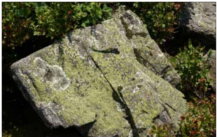
Abb. 11. Die Land- kartenflechte – eine gelbgrünliche Krus- tenflechte – ist die kennzeichnende Art lichtoffener Silikat- felsen; links Rosetten von Xanthoparmelia conspersa (Todtnau).

An den Stämmen freistehender Eschen – einem außerordentlich flechtenreichen Habitat, von dem man derzeit Abschied nehmen muss – und Bergahornen findet sich oft ein bunt-scheckiges Gemisch von Laub- und Krustenflechten sowie Moosen. Recht großwüchsige Blattflechten an solchen lichtreich stehenden Bäumen sind die Linden-Schüsselflechte Parmelina tiliacea mit ihren weißen, gegen die Mitte der Lager grauen Rosetten und die Essigflechte ( Pleurosticta acetabulum ) mit düster grün gefärbten Thalli. Sie sind durch die starke Abnahme an straßenbegleitenden Bäumen auf dem Rückgang (vgl. Abb. 9). Gewöhnlich sind zwei oder drei Arten aus der Physcia -Verwandtschaft (Schwielenflechten) beige-sellt. Intensiv gelbe Flechten gehören zur alten Sammelgattung Xanthoria , mit der bekannten Gelbflechte ( Xanthoria parietina ), die auch im Schwarzwald durch Eutrophierung in den letzten drei Jahrzehnten zugenommen hat. Braune Laubflechten an diesen Habitaten sind Angehörige der Gattungen Melanelixia und Melanohalea (früher Parmelia , Braunparmeli- en, Braunflechten). Auf den Ästen der Eschen und Ahorne sind ähnliche Bestände entwik- kelt (Abb. 8). Sie wirken oft noch bunter, weil auf kleinem Raum artenreicher entwickelt,