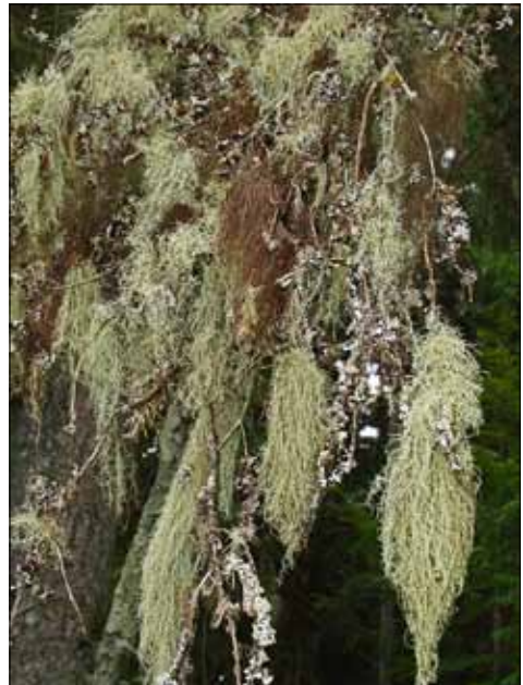
Abb. 3 und 4. An sehr luftfeuchten, nebelreichen Lokalitäten entwickeln sich Bartflechten. Sie gehen infolge Klimaerwärmung und durch forstliche Eingriffe deutlich zurück. Gelbgrünliche Bärte gehören zur Gattung Usnea (hier U. dasopoga ), graue bis braune Bärte zu Bryoria .