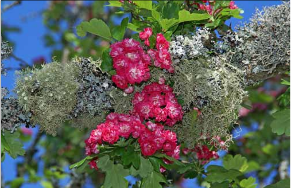
Abb. 24. Typisch für lichte, luftfeuchte Standorte in der Krone von Laubbäumen ist eine Gesellschaft mit buschig wachsenden Bartflechten, darunter die „Blühende Bartflechte“ ( Usnea florida ) mit scheibenförmigen Fruchtkörpern. An Rotdorn, St. Blasien.

gleiter sind Hypogymnia physodes und Lecanora pulicaris . Extrem selten gesellt sich die braune Blattflechte Melanohalea olivacea hinzu. Von ihr, einer in der Tundra und in der borealen Zone verbreiteten Art, ist in Südwestdeutschland derzeit nur noch ein Vorkommen im Schluchsee-Gebiet bekannt, von Cetraria sepicola sind es im Biosphärengebiet noch zwei; letztere Art hat in den vergangenen 50 Jahren einen fast beispiellosen Rückgang zu verzeichnen. Fast alle der früher teilweise recht individuenreichen Vorkommen sind erloschen. Es ist zweifelhaft, ob Pflegemaßnahmen noch etwas bewirken können – einen Versuch ist es wert.