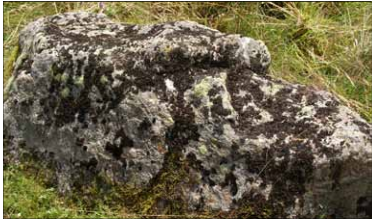
Abb. 15. Kennzeichnende und leicht erkennbare Flechte windoffener Felsen ist die alpine Umbilicaria cylindrica (Fransen-Nabelflechte).

Abb. 14. Niedrige Felsblöcke in hochmontanen Lagen werden oft von der dunkelbraunen, wie berußt erscheinenden Nabelflechte Umbilicaria deusta eingenommen, die nährstoffreiche, nach Regen länger feucht bleibende Flächen bevorzugt (Muggenbrunn).