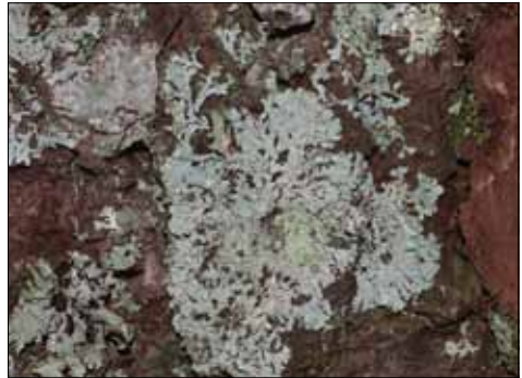
Abb. 6. Parmeliopsis hyperopta mit 2 cm großen, schmallappigen grauen Rosetten ist eine der Kennarten der Schneepegel-Gesellschaft an der Basis von Bäumen.