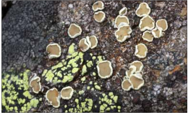
Abb. 27. Der locus classicus von Lecanora silvae-nigrae , der Schwarzwald-Kuchenflechte, liegt am Belchen. Links (gelb) Landkartenflechte.

und Felsblöcken hat die Ansiedlungsmöglichkeiten von Gesteins- und bodenbewohnenden Flechten, die in ihrer überwiegenden Zahl von lichtoffenen Habitaten abhängig sind, erweitert. Heute im Grünland reich mit Flechten besetzte Felsblöcke wären im ursprünglichen Wald in aller Regel unbedeutende Flechtenstandorte. Sie haben für das Überleben hochmontaner und subalpiner Arten im nicht allzu üppig mit lichtoffenen Felsgruppen ausgestatteten Schwarzwald eine große Rolle gespielt, in jüngster Zeit allerdings durch die verbreitete "Entsteinung" durch Flurneuordnungsverfahren und Eigeninitiativen der Landwirte wieder an Bedeutung verloren. Nicht zuletzt haben künstliche Substrate, vom Grabstein bis zur Betonmauer, im Biosphärenreservat die ökologische Amplitude von Flechten und auch Moosen erweitert (Kap. 2.4). Angesichts des von Natur aus vorhandenen silikatischen, sauren (allerdings sehr lokal auch kalkhaltigen) Untergrundes ist das zwar nicht reiche, aber verbreitete Angebot von künstlichen kalkhaltigen Substraten im Biosphärengebiet für eine Reihe von Kalkbewohnern bedeutsam. Dabei wird neu "angebotener" Kunststein rasch besiedelt, wie z. B. Betonformteile für Sitzbänke, Dachziegel oder Mörtel von Mauern.