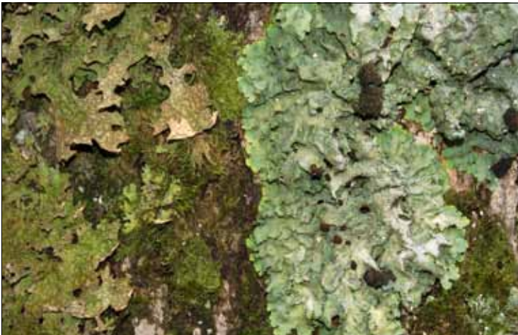
Abb. 21. Die seltene Lungenflechten-Gesellschaft ist heute meist nur noch mit der Lungenflechte (links) selbst zu finden. Weitere Charakterarten treten nur noch extrem selten auf, so die Große Lungenflechte (rechts), eine der größten Flechten-Seltenheiten in Deutschland. In feuchtem Zustand (Belchen-Gebiet).