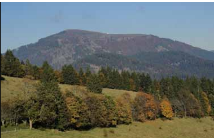
Abb. 9. Alleen und straßenbegleitende Bäume sind sehr bedeutende Habitate lichtliebender Flechtenarten. Diese Baumreihe unterhalb des Sirnitz-Passes wurde im Jahr 2015 gefällt. Biodiversität ist für die Straßenbaubehörden auch im Südschwarzwald ein Kriterium, das gegenüber zügigem Vorankommen zurückzutreten hat.

ten geworden, vermutlich eine Folge des Klimawandels. Rückgänge zeigt auch die graue Parmeliopsis hyperopta . Die sehr ähnliche, namengebende Kennart Parmeliopsis ambigua mit ihren kleinen schmallappigen gelblichgrünen Rosetten ist hingegen noch verbreitet. Die Schneepegel-Gesellschaft kommt auch an den Flanken von entrindeten Stümpfen und an stehendem Totholz vor, an Habitaten, die sonst eher von sehr unauffälligen Flechten mit oft kaum entwickeltem, im Holz lebendem Thallus besiedelt werden, so dass sie von Nicht-Flechtenkundlern selten wahrgenommen werden. Gleichwohl bergen sie eine große Anzahl von Arten. An senkrechten, regenabgewandten Flächen wachsen mehrere Arten von Stecknadelflechten ( Chaenotheca und Calicium ) (Abb. 7), die mit ihren Millimeter großen stecknadelförmigen Fruchtkörpern größere Flächen bedecken können; am häufigsten ist Calicium glaucellum . Eine der Charakterflechten auf Holz ist an beregneten Habitaten in hohen Lagen die "Holzrunne" Xylographa parallela . Die Hirschnitte der Stümpfe werden nach etlichen Jahren und nach Jahrzehnten von dichten Rasen von Säulenflechten, vor allem von Cladonia coniocraea und von der rotfrüchtigen C. macilenta , eingenommen.