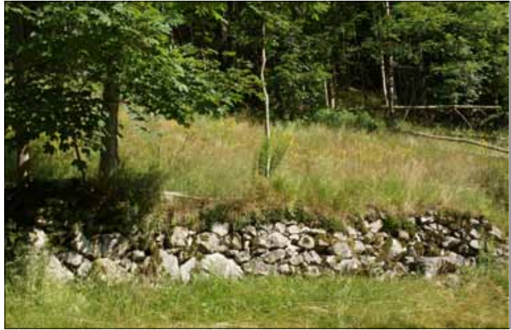
Abb. 10. Selbst niedrige Trockenmauern aus Bruchsteinen sind wich- tige Flechtenstandorte.

An den Stämmen freistehender Eschen – einem außerordentlich flechtenreichen Habitat, von dem man derzeit Abschied nehmen muss – und Bergahornen findet sich oft ein bunt-scheckiges Gemisch von Laub- und Krustenflechten sowie Moosen. Recht großwüchsige Blattflechten an solchen lichtreich stehenden Bäumen sind die Linden-Schüsselflechte Parmelina tiliacea mit ihren weißen, gegen die Mitte der Lager grauen Rosetten und die Essigflechte ( Pleurosticta acetabulum ) mit düster grün gefärbten Thalli. Sie sind durch die starke Abnahme an straßenbegleitenden Bäumen auf dem Rückgang (vgl. Abb. 9). Gewöhnlich sind zwei oder drei Arten aus der Physcia -Verwandtschaft (Schwielenflechten) beige-sellt. Intensiv gelbe Flechten gehören zur alten Sammelgattung Xanthoria , mit der bekannten Gelbflechte ( Xanthoria parietina ), die auch im Schwarzwald durch Eutrophierung in den letzten drei Jahrzehnten zugenommen hat. Braune Laubflechten an diesen Habitaten sind Angehörige der Gattungen Melanelixia und Melanohalea (früher Parmelia , Braunparmeli- en, Braunflechten). Auf den Ästen der Eschen und Ahorne sind ähnliche Bestände entwik- kelt (Abb. 8). Sie wirken oft noch bunter, weil auf kleinem Raum artenreicher entwickelt,