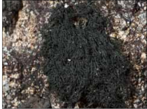
Abb. 26. Unscheinbare schwarze, niedergedrückte schwarze Strähnen kennzeichnen die Strähnenflechte Ephebe lanata , von der aktuelle Vorkommen in Deutschland nur im Schwarzwald bekannt sind.