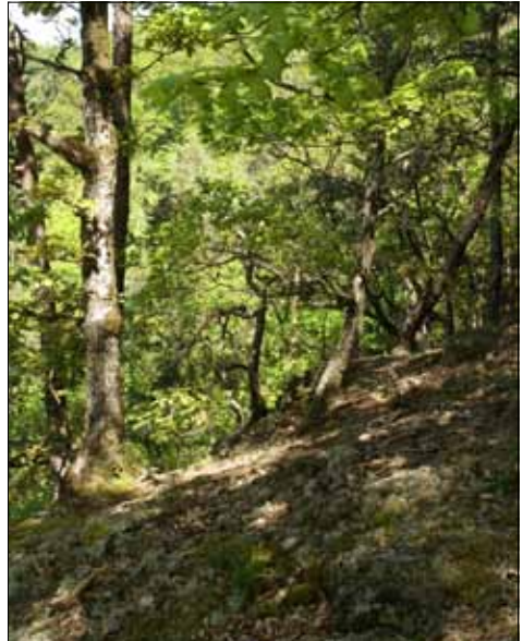
Abb. 18. In lichtreichen Eichenwäldern auf bodensauren, flachgründigen Böden können die selten gewordenen Rentierflechten aufkommen (Albtal).

ten grauen bis gelblichgrünen Flächen weiter unten. In warmen montanen Lagen ist die Pustelflechte ( Lasallia pustulata ) eine charakteristische braune Art an Blöcken und Felsen, vor allem an Flächen, die leichter „Verschmutzung“ durch Boden- oder organische Teilchen ausgesetzt sind (Abb. 13). Unter und zwischen den plastischen Lagern sammeln sich Samen, Früchte, Blattfragmente, Nadeln und Humusteilchen. Die Pustelflechte ist durch ihre nabelartige Festheftung an nur einer zentralen Stelle und die halbkugeligen bis ellipsoiden Aufwölbungen eine unverkennbare Art.