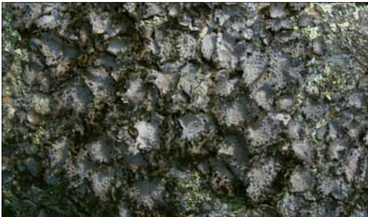
Abb. 13. Die Pustelflechte ( Lasallia pustulata ) ist eine durch ihre ovalen Aufwölbungen leicht erkennbare Nabelflechte, die warme, oft leicht staubinkrustierte Felsflächen besiedelt (Todtnau).