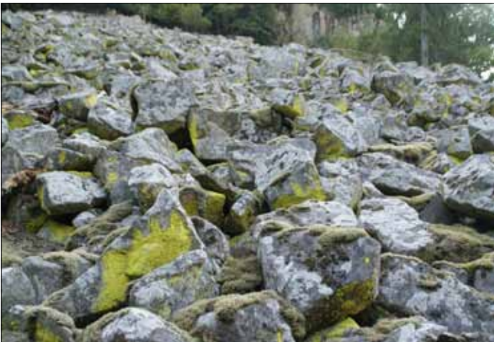
Abb. 17. Während Blockhalden an besonnten Hängen von der gelbgrünlichen Landkartenflechte geprägt sind, werden solche in schattiger Lage von weißen und grauen Krusten dominiert, wie Pertusaria corallina . Regengeschützte Stellen nimmt die Schwefelflechte ein ( Chrysothrix chlorina ) (Schwarzatal).

ten grauen bis gelblichgrünen Flächen weiter unten. In warmen montanen Lagen ist die Pustelflechte ( Lasallia pustulata ) eine charakteristische braune Art an Blöcken und Felsen, vor allem an Flächen, die leichter „Verschmutzung“ durch Boden- oder organische Teilchen ausgesetzt sind (Abb. 13). Unter und zwischen den plastischen Lagern sammeln sich Samen, Früchte, Blattfragmente, Nadeln und Humusteilchen. Die Pustelflechte ist durch ihre nabelartige Festheftung an nur einer zentralen Stelle und die halbkugeligen bis ellipsoiden Aufwölbungen eine unverkennbare Art.