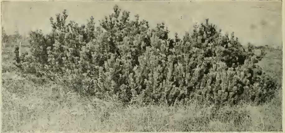
Abb. 10. Moorlatsche. Pinus montana var. prostrata . Auf Chiemseemoor bei Bernau.

Diese hier geschilderten und abgebildeten Wuchsformen der Bergkiefer, Pinus montana , sind, soweit nicht Bastarde vorliegen, samenbeständig. Wo aber mehrere Wuchs- und Zapfenformen miteinander vorkommen, dürften sie auch miteinander bastardieren, da ja auch die Bergkiefer, Pinus montana , mit der gemeinen Waldkiefer, Pinus silvestris Bastarde bildet.