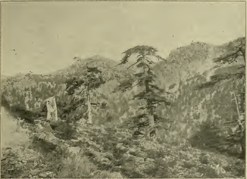
Cedrus Libani Barr. in Cilicien.

Sehr erfreulich ist es jedenfalls, daß wir nun diese schöne Tanne zweifellos echt besitzen, und weiter beobachten können und daß jeder Zweifel, ob hier wirklich eine gut unterschiedene Art vorliegt, nunmehr endgültig beseitigt ist. —