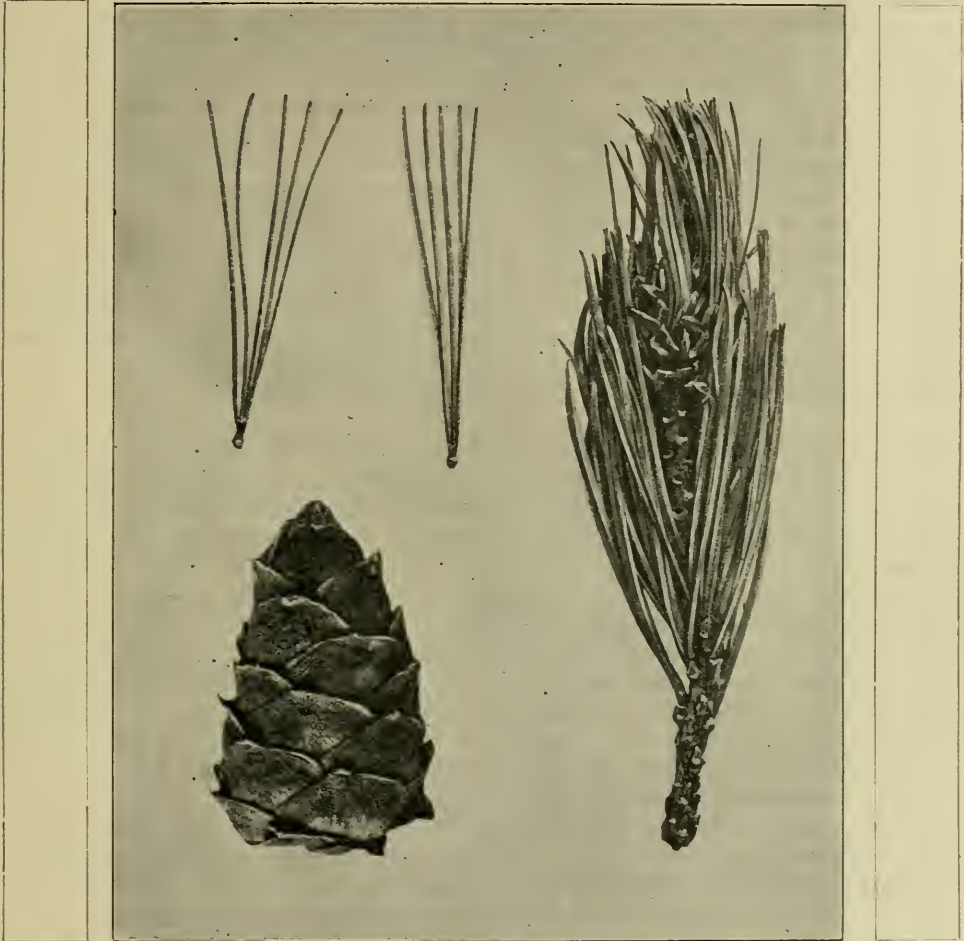
Pinus pumila Rgl. Zapfen, Zweig, Nadelbüschel. Natürliche Größe.

Leider verschwinden jedoch diese Merkmale bei unzulänglichem Herbarmaterial nur zu oft. So ergab eine anatomische Untersuchung von sehr starren Blättern, die als P. Thunbergii angesehen worden waren, die Zugehörigkeit zu P. densiflora , also diese wäre somit für China sicher nachgewiesen, wie ich selbst feststellen konnte. Mayr bezweifelte das Vorkommen beider Kiefern in China, Masters gibt verschiedene Standorte und Sammler für P. Thunbergii in China an. Dieses Material müßte also genau nachgeprüft werden, was ja in diesem Falle leicht