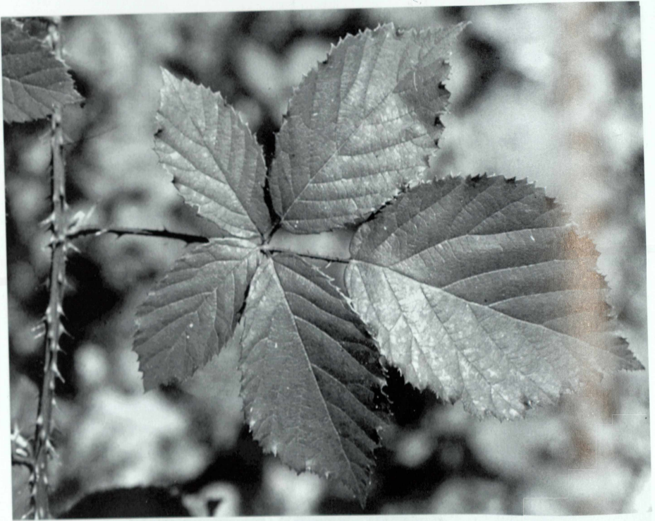
Abb. 3 Rubus leinigeri W. LANG am Eiswoog westl. Ramsen, Schösslingsblatt