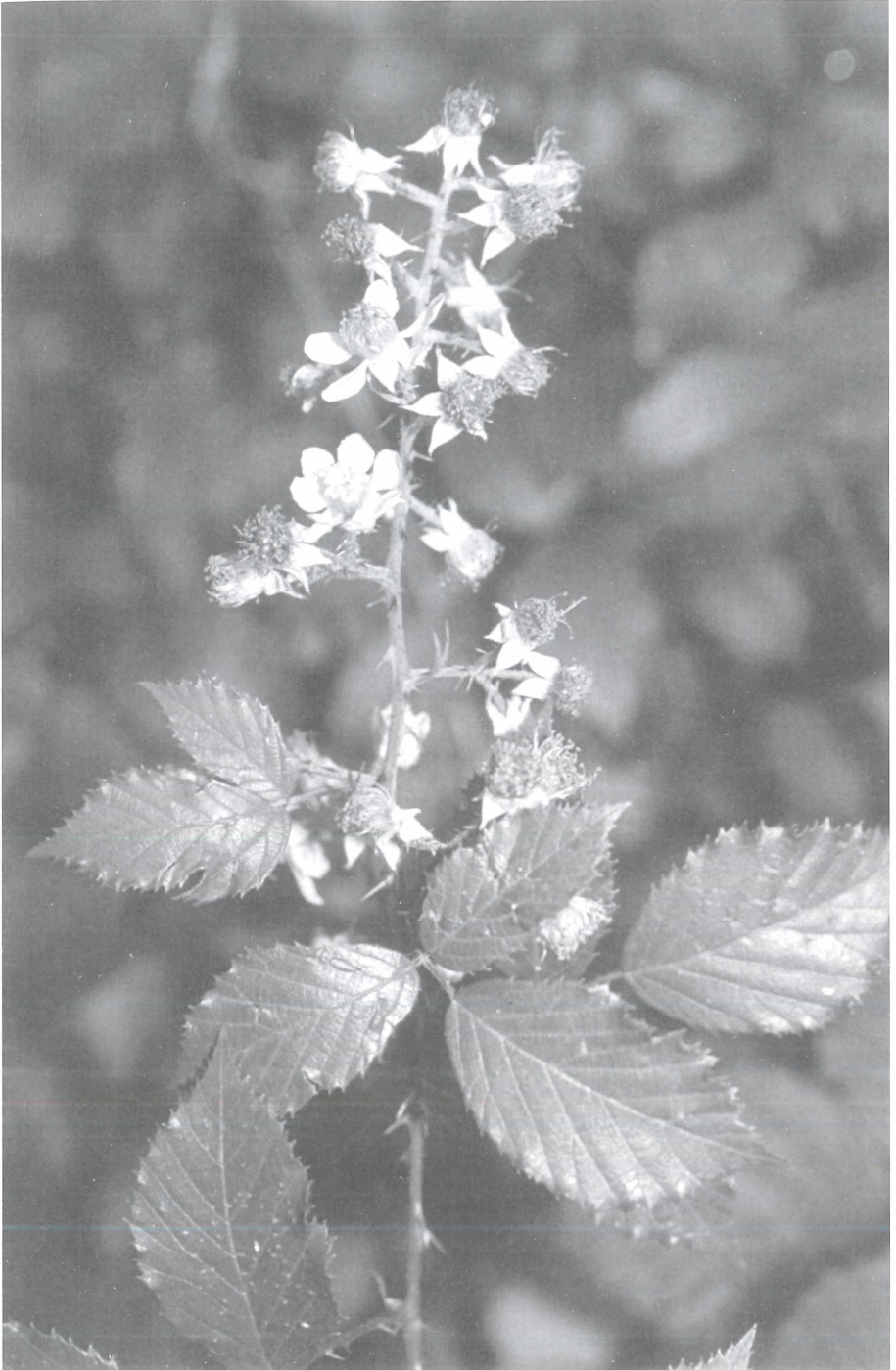
Abb. 2 Rubus leinigeri W. LANG am Eiswoog westl. Ramsen, Blütenstand