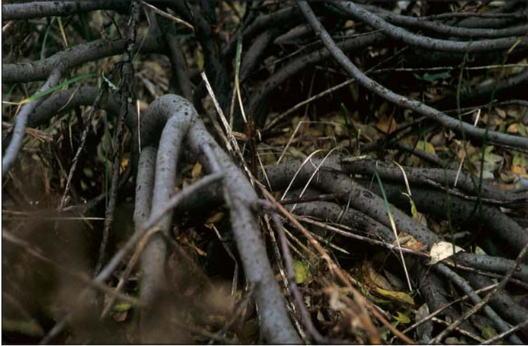
Abb. 2: Verzweigung und Dicke der Äste der Salix bicolor am Richt-funkturn.