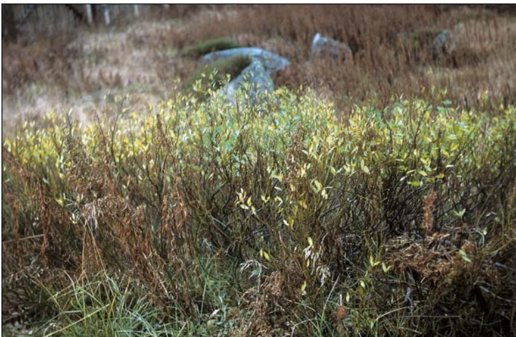
Abb. 4: Wuchsform der Salix bicolor am Richt-funkturn (Brocken).