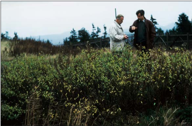
Abb. 3: Größenvergleich der Salix bicolor am Richt-funkturn (Brocken).