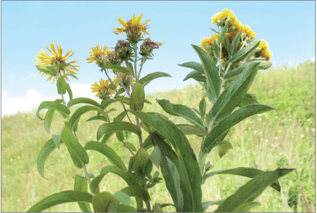
Abb. 12: Inula salicina, Inula × media und Inula germanica von links nach rechts. S Göhren, 14.07.2017