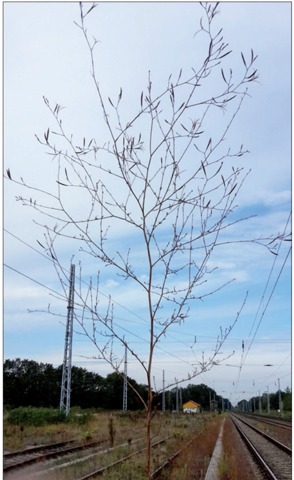
Abb. 24: Epilobium brachycarpum. Güterbahnhof Coswig, 07.09.2019