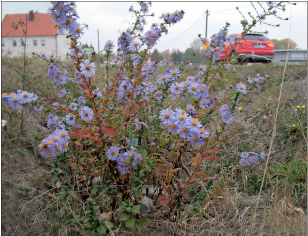
Abb. 28: Eurybia radula. Oppin, 04.11.2018