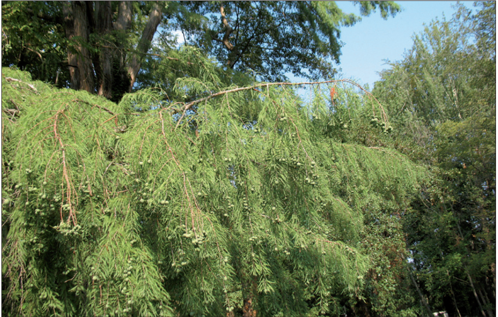
Abb. 32: Taxodium distichum. Park Zöschen, 27.08.2019