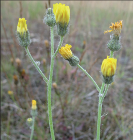
Abb. 3: Hieracium cinereiforme. NO-Seite des Wallendorfer Sees, 24.06.2013

cken Ruderalstellen, sandigen Brachen und zwischen Trockengebüschen. Beispiele für Vorkommen: