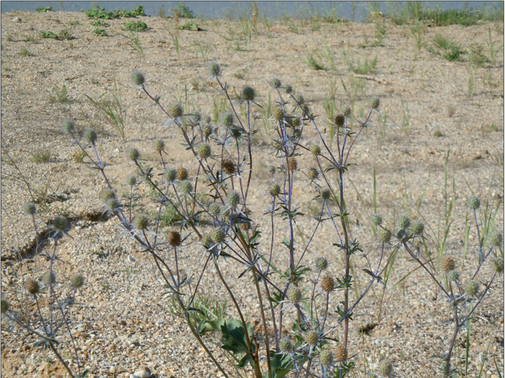
Abb. 27: Eryngium planum. Innenkippe Geiseltalsee bei Mücheln, 12.08.2012