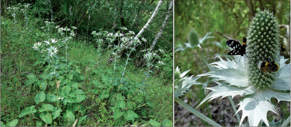
Abb. 25 und 26: Eryngium giganteum. Halde Blösien, 03.07.2016

liegt an der N-Seite der Halde bei Blösien (4637-324), an der sich an vier Stellen Bestände von insgesamt über 100 Exemplaren entwickelt haben.