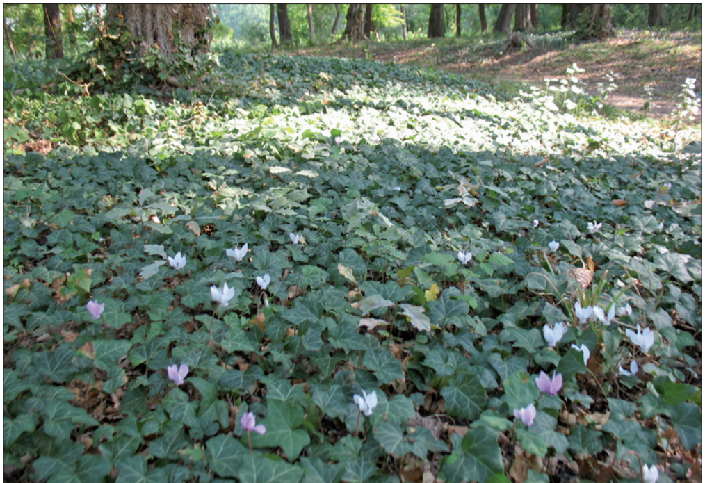
Abb. 21: Cyclamen hederifolium zwischen Hedera helix. Park Zöschen, 27.08.2019