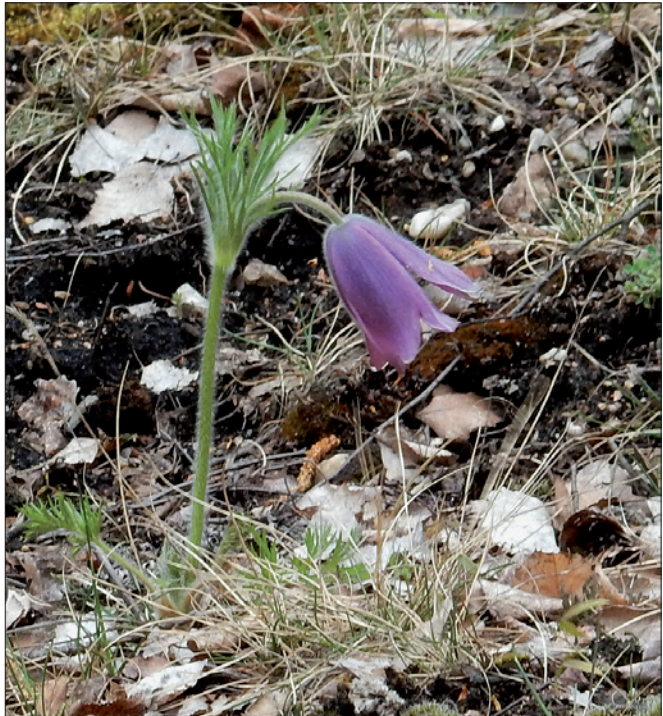
Abb. 16: Pulsatilla vulgaris auf Abraumhalde am Geiseltalsee, 19.04.2016