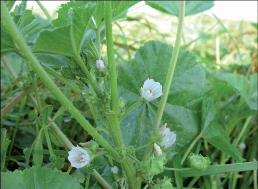
Abb. 14: Malva × adulterina, 2. Typ. Ackerrand bei Salzmünde, 12.10.2014