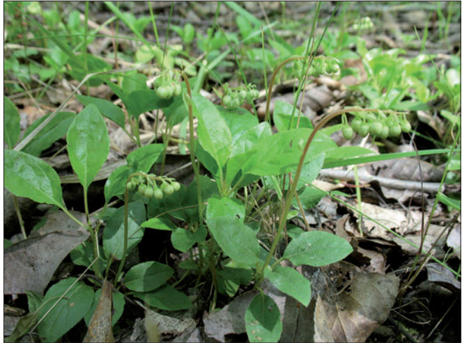
Abb. 15: Orthilia secunda. Balsampappelforst bei Stedten, 25.05.2017

30) befasste sich kritisch mit den Fundortangaben der Vorkommen der Art. Er kam zu dem Schluss, dass 1992 in Thüringen und Sachsen-Anhalt nur noch drei Vorkommen existierten. Offensichtlich kam es auch zu Fehlbestimmungen. In ST fand er nur noch ein Vorkommen: 3734-3 Olbetal SW Hundisburg. Nicht erwähnt war: