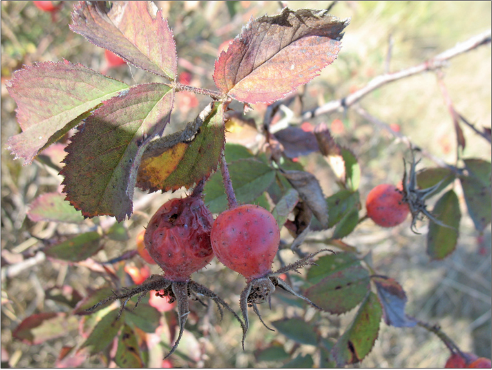
Abb. 17: Rosa marginata. Kolonie an der Steinbruchböschung NW Gimritz, 27.08.2016