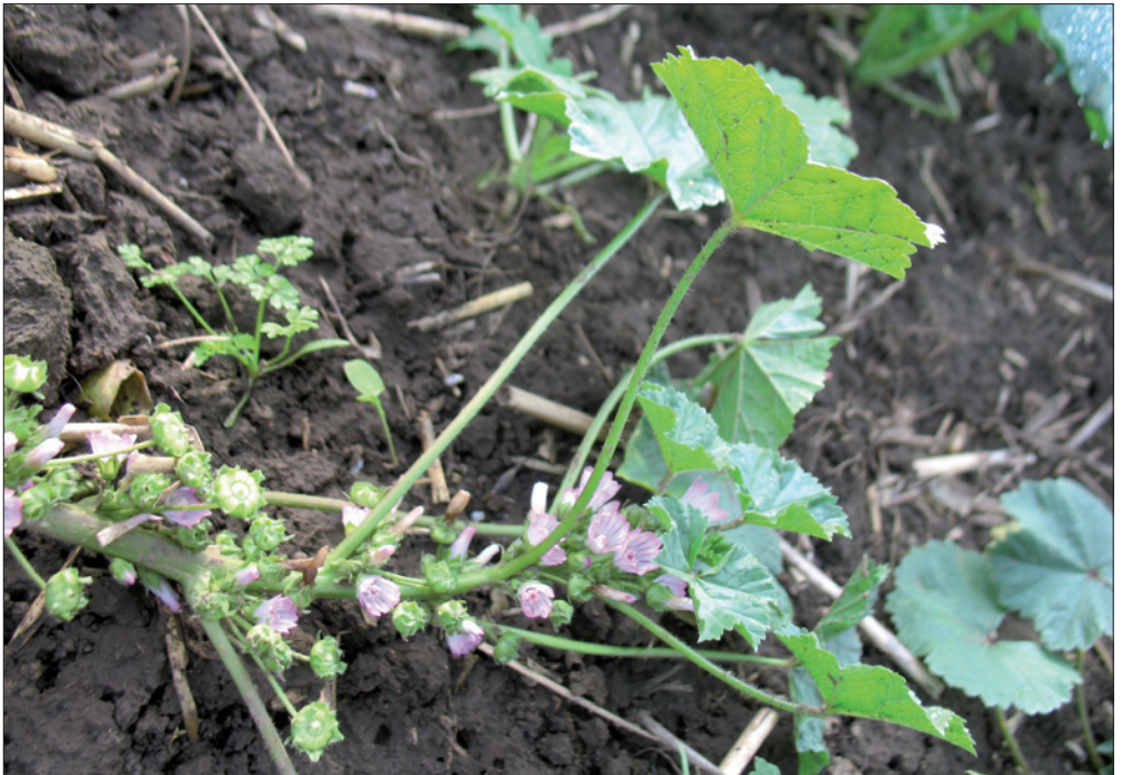
Abb. 13: Malva × adulterina, 1. Typ. Ackerrand bei Salzmünde, 18.10.2014