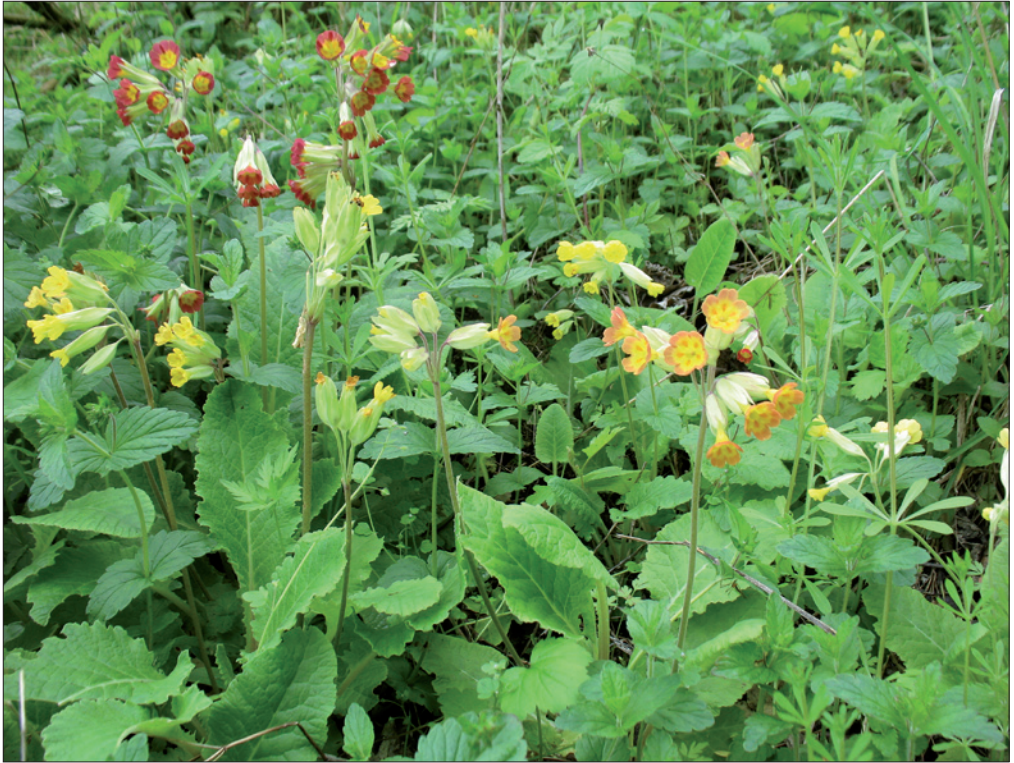
Abb. 30: Primula veris mit Einkreuzung von Primula-julia - bzw. Primula-pruhonicensis -Hybriden. Rätsch bei Gutenberg, 09.05.2017