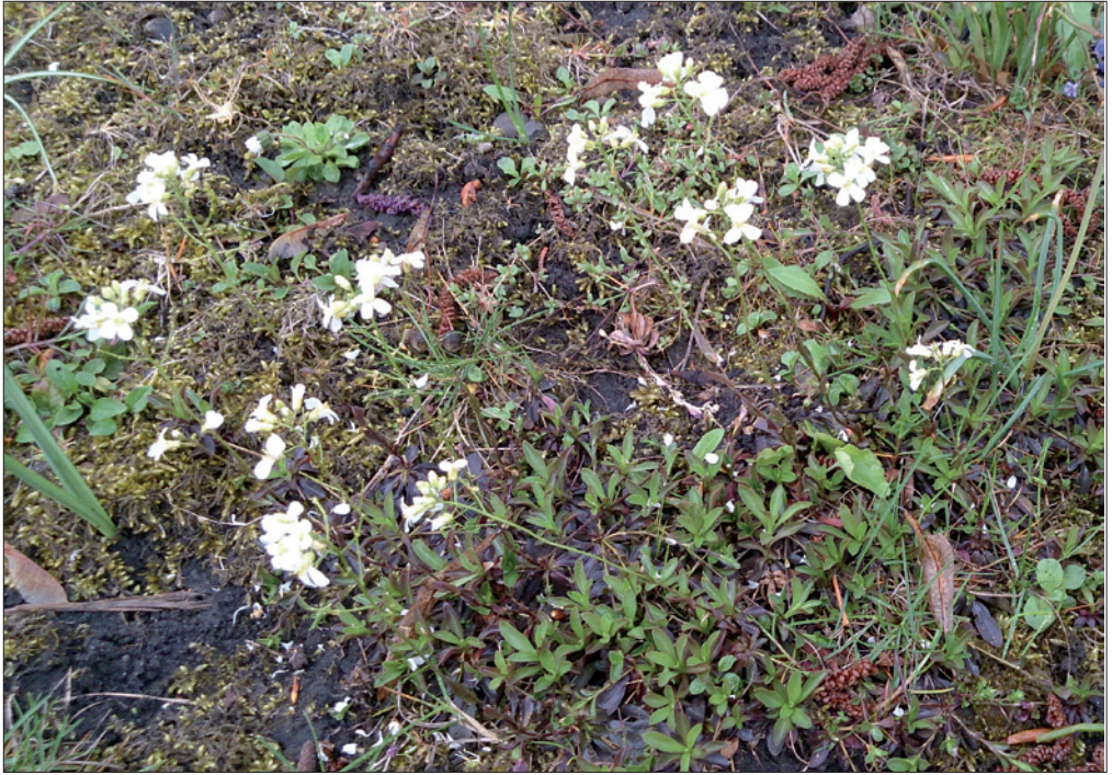
Abb. 20: Arabis procurrens. Friedhof Leuna, 27.04.2015