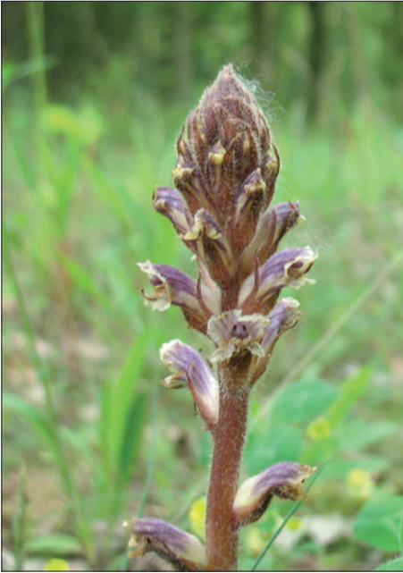
Abb. 29: Orobanche minor auf Trifolium repens -Ansaat. Zwischen Höhenmölsen und Theißen, 11.06.2016

wird über die Bastardfreudigkeit einiger Primelgruppen geschrieben: „Bastarde sind innerhalb der Untergattungen Vernales und Auricula zahlreich ... Wo zwei Arten nebeneinander wachsen, wird man in der Mehrzahl der Fälle auch ihre Bastarde finden können... In der Mehrzahl sind die Hybriden unfruchtbar, können aber trotzdem in verschiedenen Formen auftreten... Mehrere Arten bilden fruchtbare Bastarde, die dann durch Aufspaltung und Rückkreuzung einen großen Formenreichtum erzeugen und gewöhnlich alle Übergangsformen von der einen Art zur anderen enthalten (gleitende Reihen).“