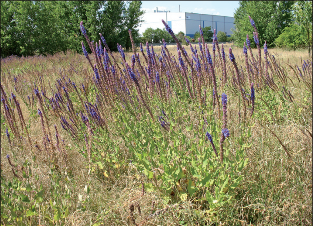
Abb. 31: Salvia amplexicaulis. Straße zwischen Leuna und Spergau, 14.07.2018