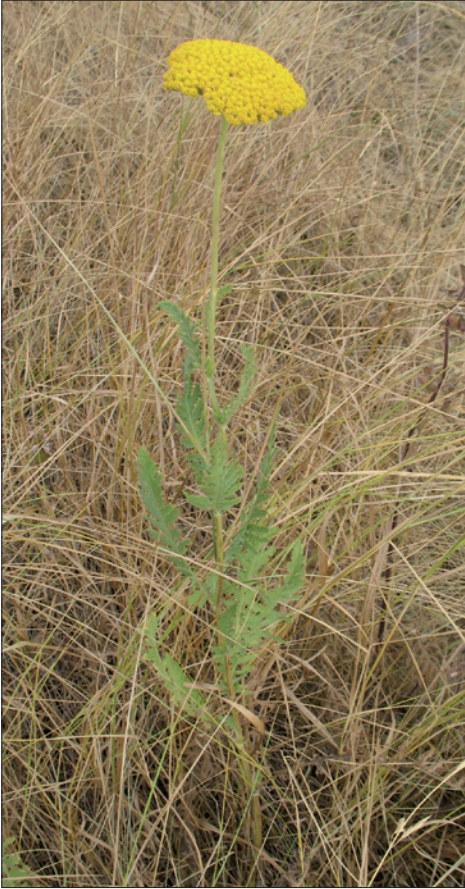
Abb. 18: Achillea filipendulina. Wansleben, 24.07.2013