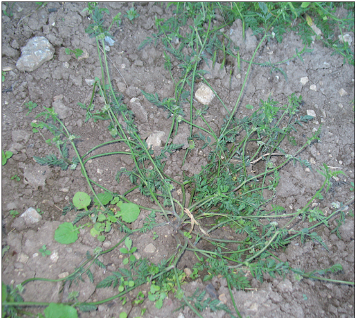
Abb. 33: Torilis nodosa. Ackerrand bei Niederschmon, 03.06.2014