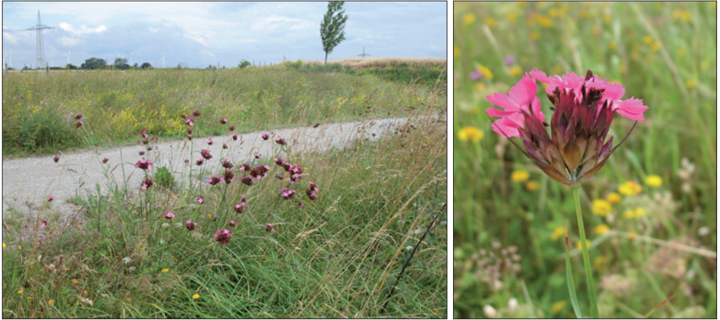
Abb. 22 und 23: Dianthus giganteus. NO Schkortleben an Böschungen bei der Brücke über die A38, 05.07.2007