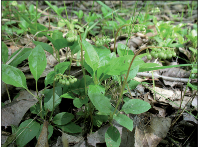
Abb. 15: Orthilia secunda. Balsampappelforst bei Stedten, 25.05.2017

30) befasste sich kritisch mit den Fundortangaben der Vorkommen der Art. Er kam zu dem Schluss, dass 1992 in Thüringen und Sachsen-Anhalt nur noch drei Vorkommen existierten. Offensichtlich kam es auch zu Fehlbestimmungen. In ST fand er nur noch ein Vorkommen: 3734-3 Olbetal SW Hundisburg. Nicht erwähnt war: