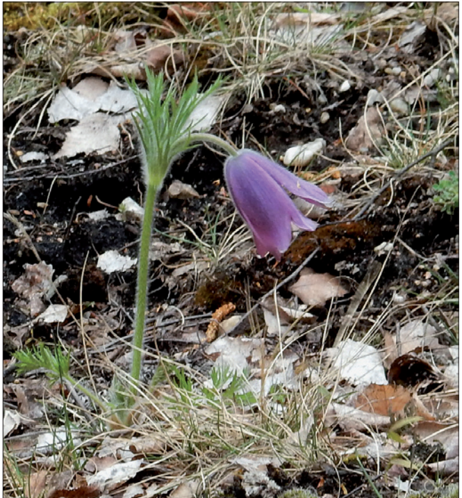
Abb. 16: Pulsatilla vulgaris auf Abraumhalde am Geiseltalsee, 19.04.2016