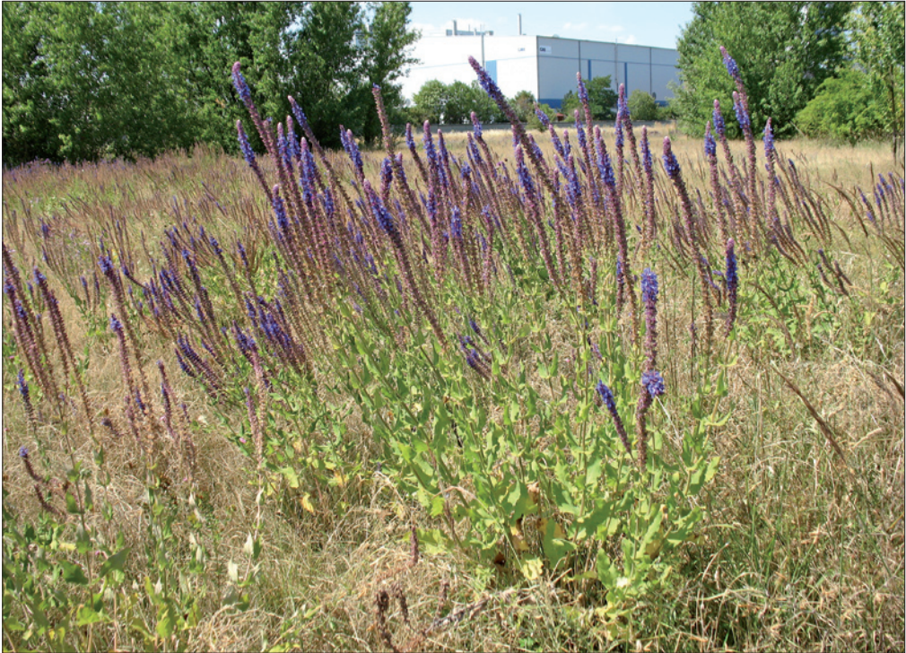
Abb. 31: Salvia amplexicaulis. Straße zwischen Leuna und Spergau, 14.07.2018