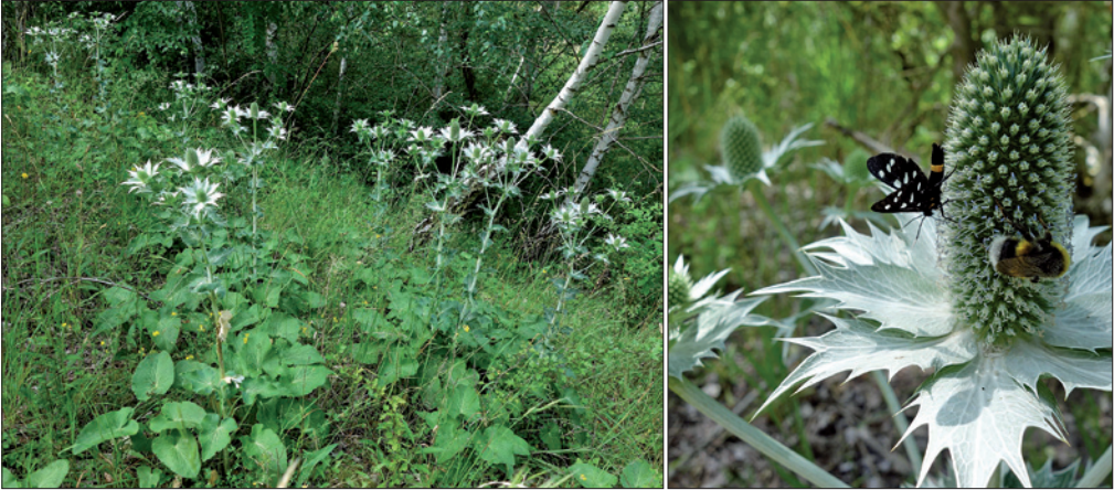
Abb. 25 und 26: Eryngium giganteum. Halde Blösien, 03.07.2016

liegt an der N-Seite der Halde bei Blösien (4637-324), an der sich an vier Stellen Bestände von insgesamt über 100 Exemplaren entwickelt haben.