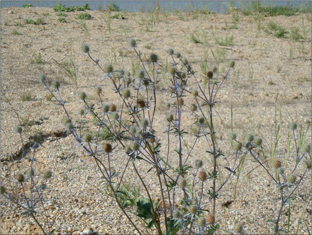
Abb. 27: Eryngium planum. Innenkippe Geiseltalsee bei Mücheln, 12.08.2012