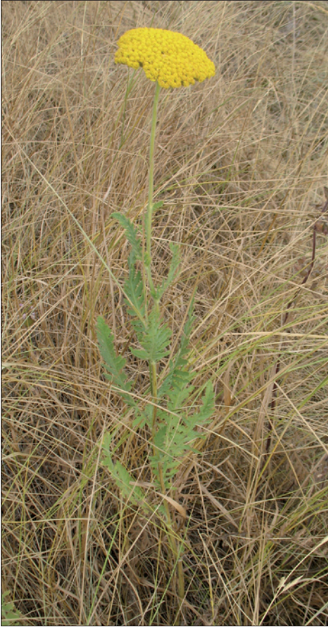
Abb. 18: Achillea filipendulina. Wansleben, 24.07.2013