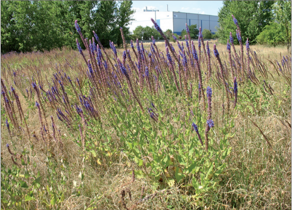
Abb. 31: Salvia amplexicaulis. Straße zwischen Leuna und Spergau, 14.07.2018