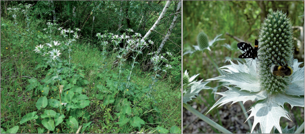
Abb. 25 und 26: Eryngium giganteum. Halde Blösien, 03.07.2016

liegt an der N-Seite der Halde bei Blösien (4637-324), an der sich an vier Stellen Bestände von insgesamt über 100 Exemplaren entwickelt haben.