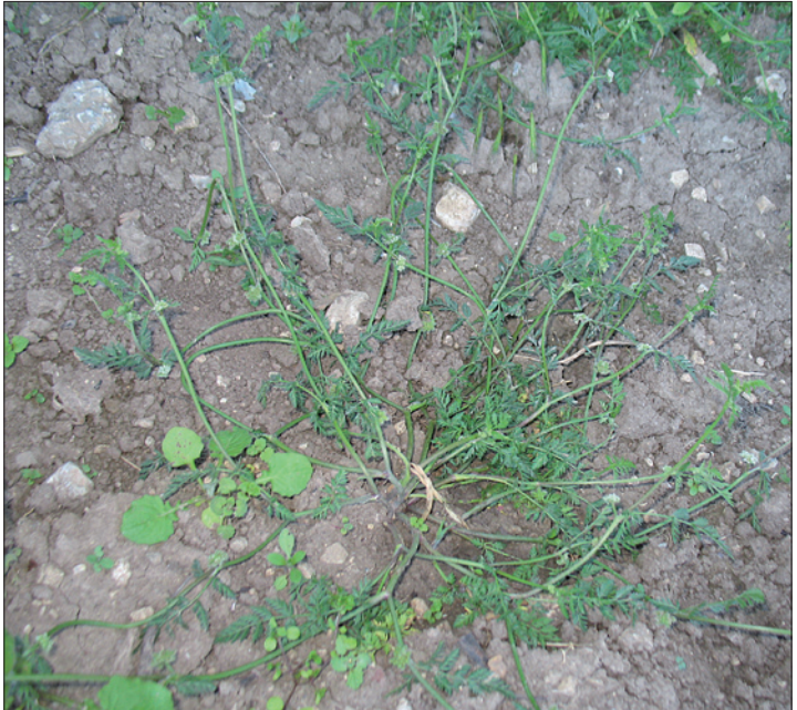
Abb. 33: Torilis nodosa. Ackerrand bei Niederschmon, 03.06.2014