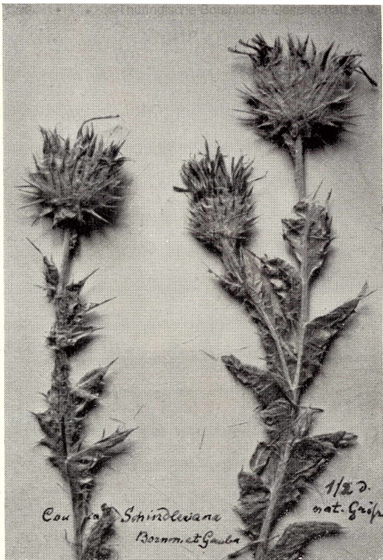
2. Cousinia Schindleriana Bornm. et Gauba