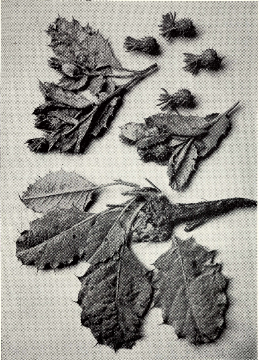
Cousinia Stahlia Borm. et Gauba