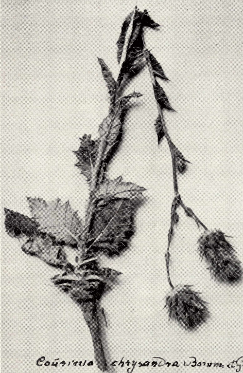
Cousinia chrysantra Bornm. et Gauba ( \frac{1}{8} d. nat. Gr.)