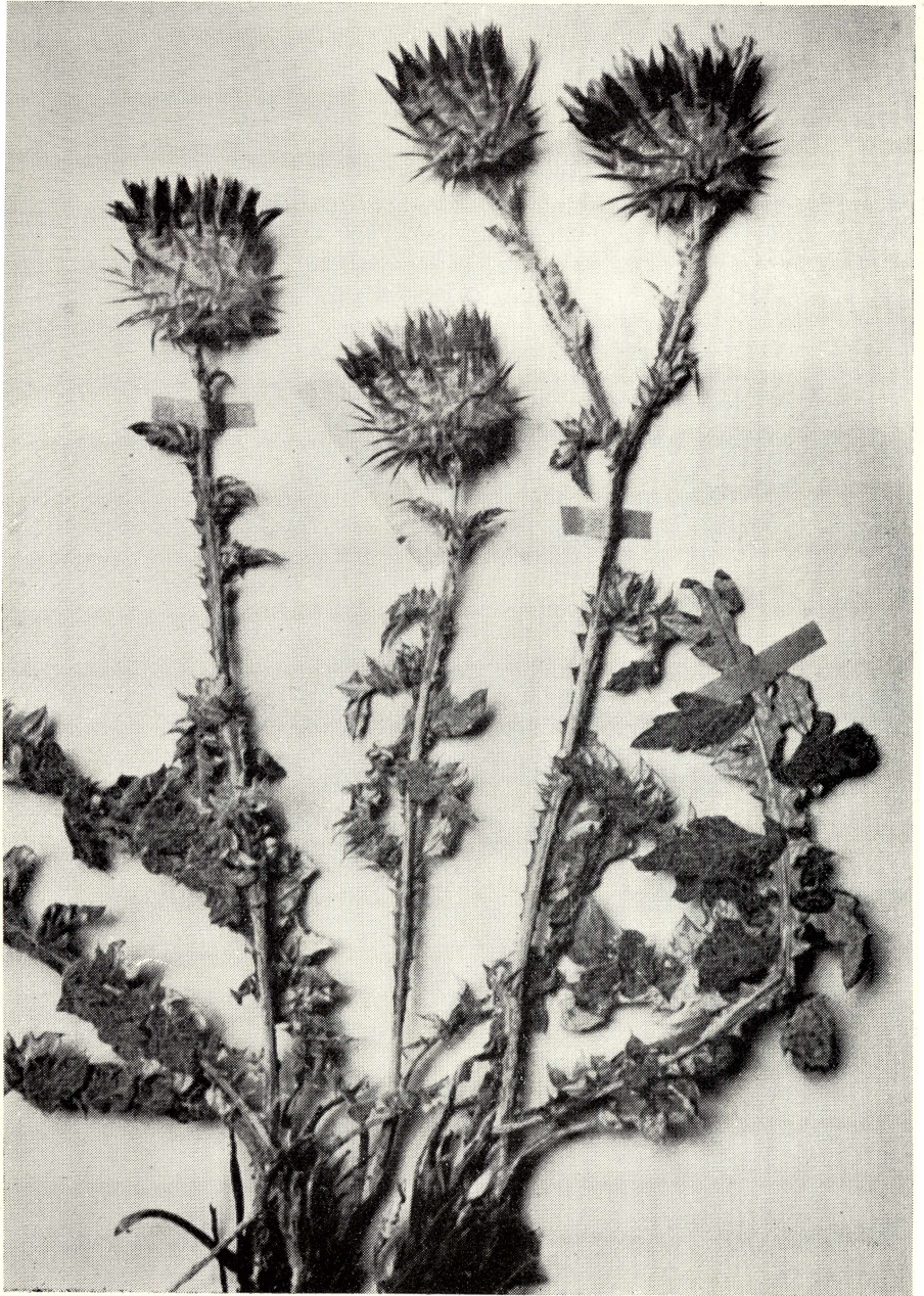
Cousinia Barbarae Gauba