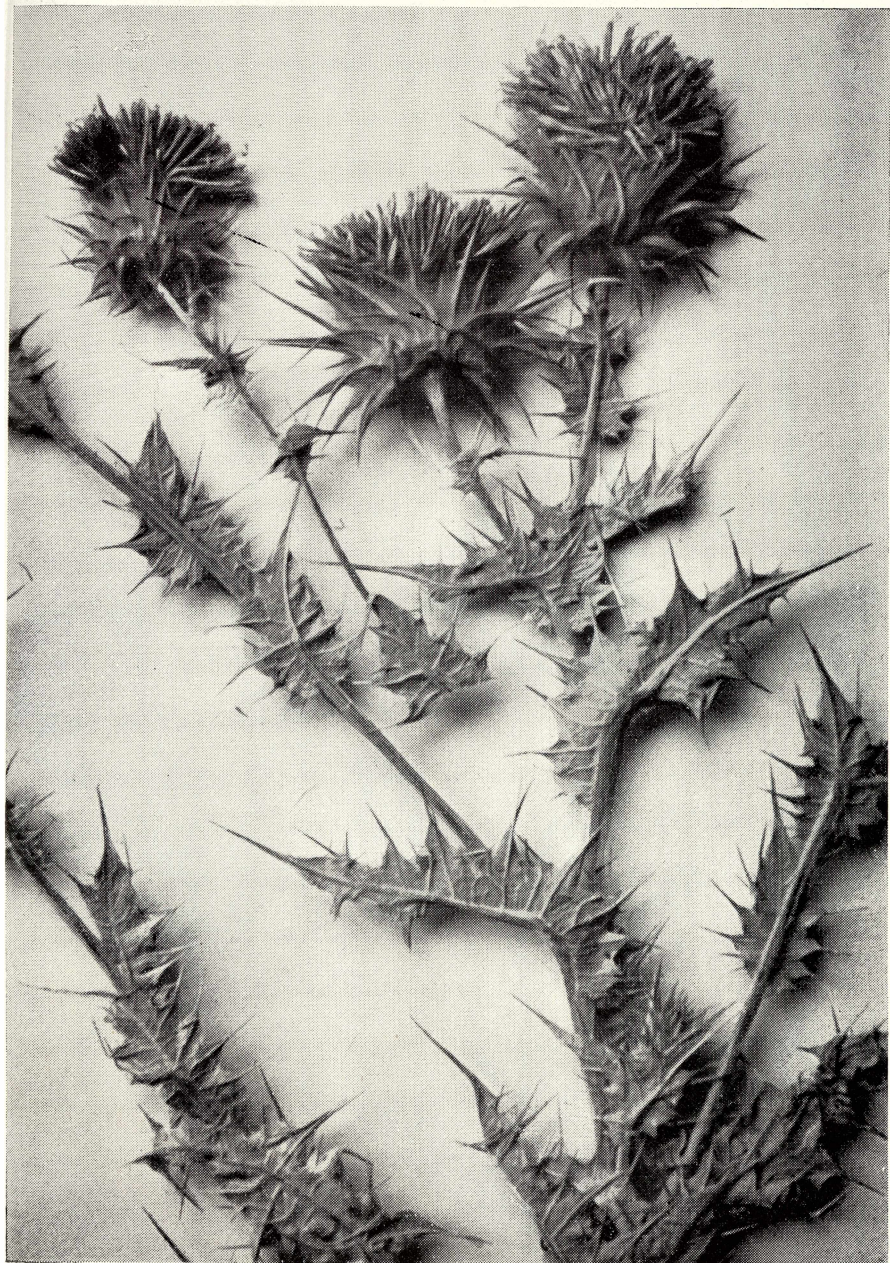
Cousinia Gabrielae Bornm.