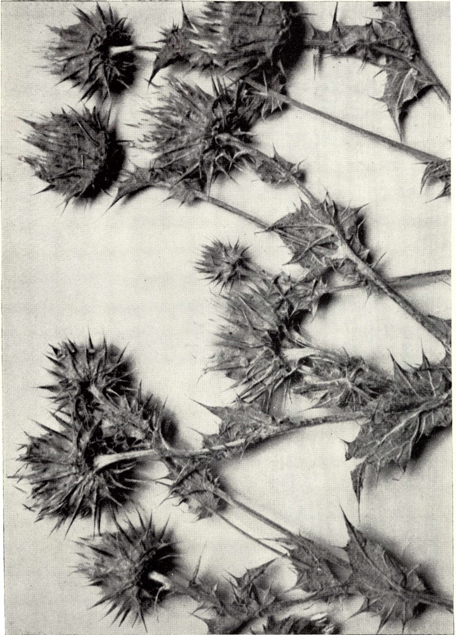
Cousinia gedrosiaca Bornm. et Gauba