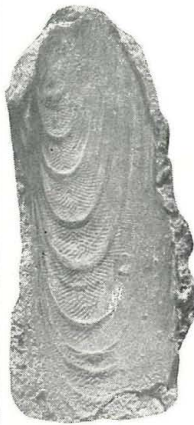
Lithodomus styriacus. n. sp.