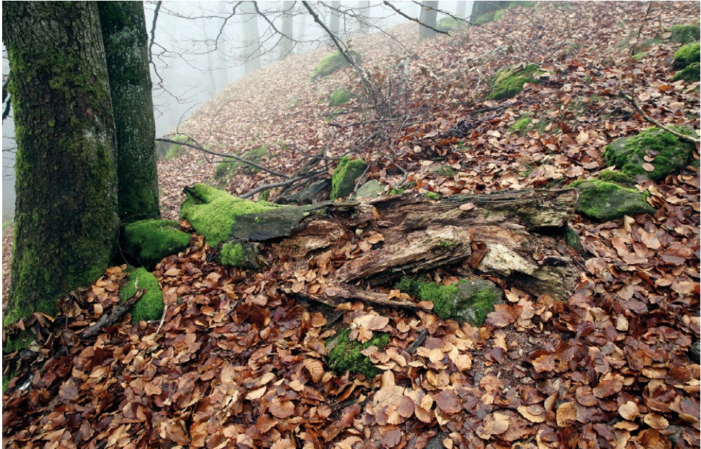
Abb. 6 – Habitat mit liegendem Buchenstamm (Fundort)