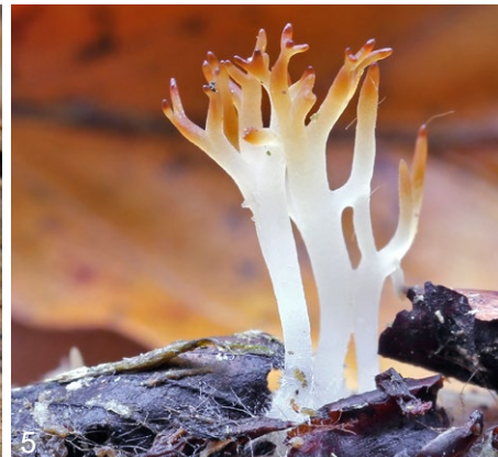
Abb. 1-5 – L. subcaulescens, Standortaufnahmen - und Detailaufnahmen. 1) 28.09.2019, 2) 17.10.2020, 3) 28.09.2019, 4) 01.10.2019, 5) 27.10.2021.