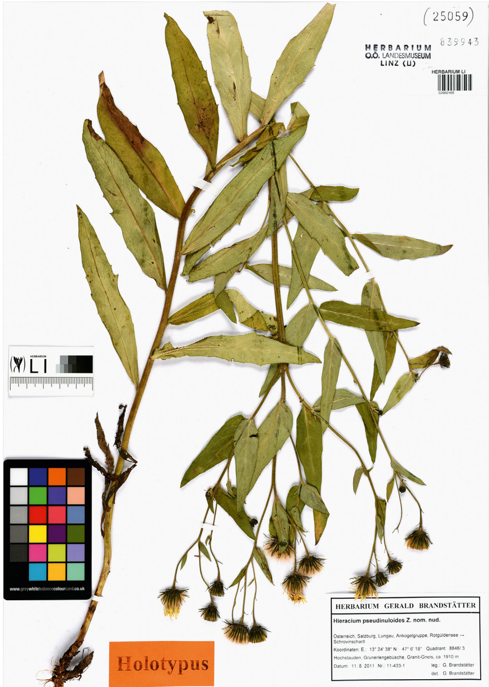
Abb. 3/ Fig. 3: Hieracium pseudinuloides , sp. nov., Holotypus.