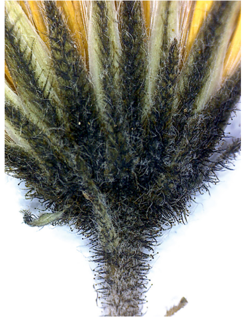
Abb. 2: Hieracium kuekenthalianum , Korbhülle mit charakteristischer Behaarung. — Fig. 2: Hieracium kuekenthalianum , phyllaries with characteristic indumentum.