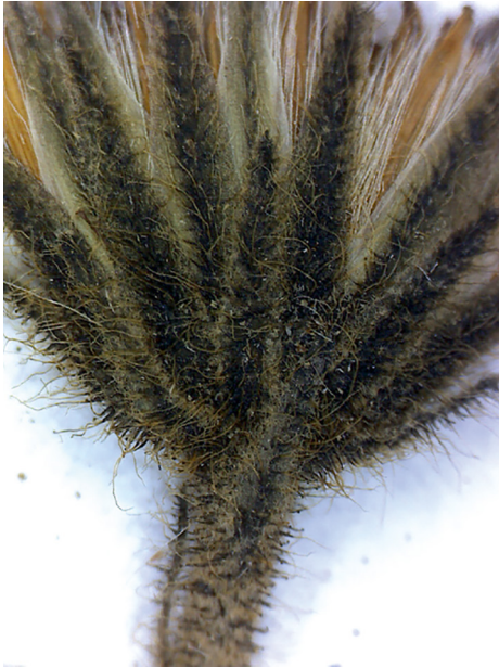
Abb. 1: Hieracium tephrosoma , Korbhülle mit charakteristischer Behaarung. — Fig. 1: Hieracium tephrosoma , phyllaries with characteristic indumentum.