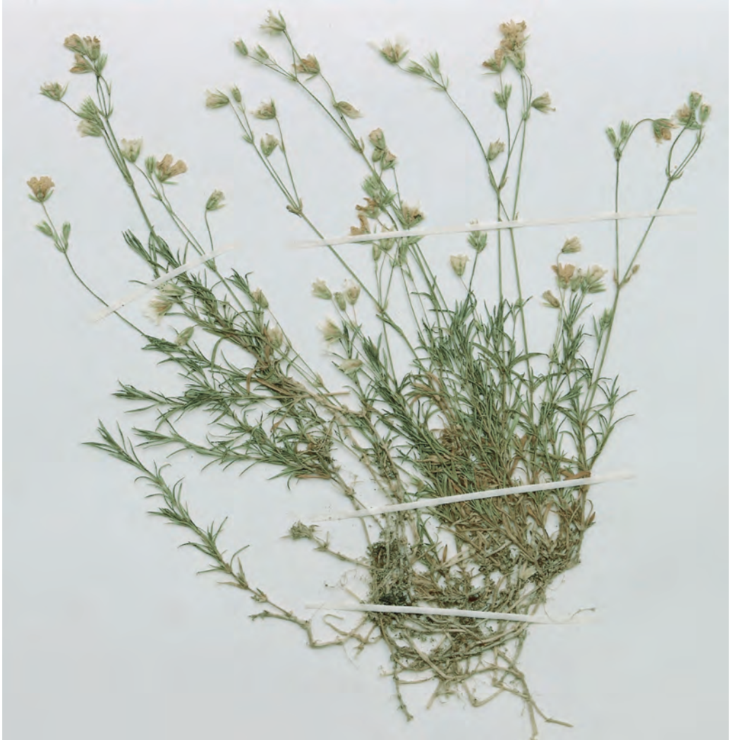
Abb. 1: Habitus von Cerastium arvense subsp. suffruticosum (Defereggental in Osttirol, östlich vom Weiler Zotten).

Diese Pflanzen, die in Abb. 1 exemplarisch dargestellt sind, fallen sofort durch ihre schmalen, zumeist leicht zurückgekrümmten Laubblätter, durch ein reich verzweigtes, zum Teil im Substrat liegendes Rhizom, kompakten und rasigen Wuchs sowie durch