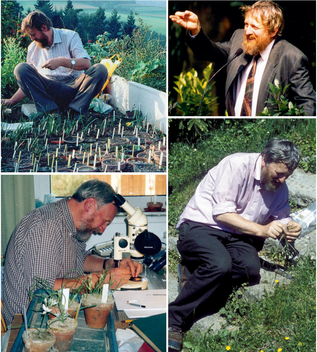
Tafel 2: Oben links: Kultivieren von Zwiebelpflanzen in seinem Garten in Kulm, Gemeinde Altenberg bei Linz. Oben rechts: Bei der Eröffnung des Biologiezentrums Linz, 25. Juni 1993. Unten links: Bei der Arbeit am Binokular im Biologiezentrum Linz. Unten rechts: Aufsammeln einer Ornithogalum -Art beim Schloß Ehrenhausen, Steiermark. — Plate 2: Top left: Cultivating bulbous plants in his garden in Kulm, municipality of Altenberg bei Linz. Top right: At the opening of the Biocentre Linz, 25 June 1993. Bottom left: Working with a stereo microscope at the Biocentre Linz. Bottom right: Collecting a species of Ornithogalum at Ehrenhausen castle in Styria.