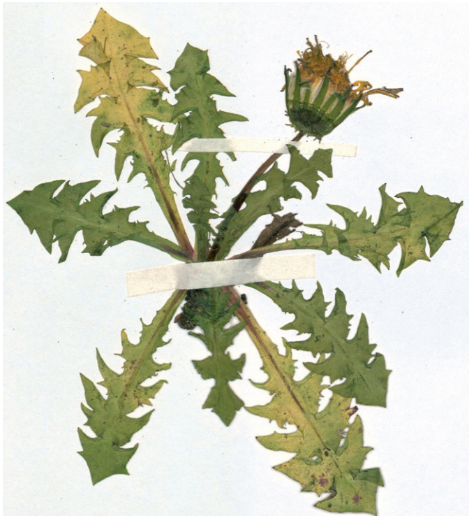
Abb. 2: Taraxacum obtusiense vom Kraxenkogel in den Radstädter Tauern aus dem Hb. Pilsl Nr. 23101. — Fig. 2: Taraxacum obtusiense from Kraxenkogel, Radstädter Tauern, Hb. Pilsl Nr. 23101.

Aus Salzburg ist diese Art bereits mehrfach dokumentiert, nachfolgend dazu die drei relevanten Literaturstellen: SOEST (1959): Mallnitzer Tauern, 2300 msm, 1904, leg. Dolenz (GZU); – SAHLIN & LIPPERT (1983) sowie LIPPERT & al. (1997): Tennengau, Hochgöll, 7500', 1846, Einsele (M); – POLATSCHKE (1999): Pinzgau, Geißstein. Neuere