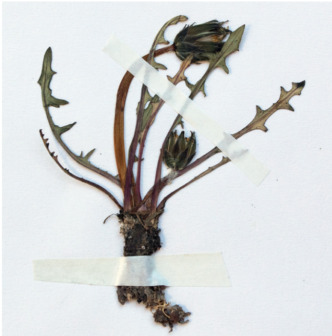
Abb. 10: Taraxacum ancoriferum aus Fuschl aus dem Hb. Stöhr Nr. 6591 (Foto: O. Stöhr). — Fig. 10: Taraxacum ancoriferum from Fuschl, Hb. Stöhr Nr. 6591 (Photo: O. Stöhr).

SW Hundsmarkt, Uferstreuwiese, ca. 670 msm, 8145/4, 3.5.2008, leg. O. Stöhr, det. I. Uhlemann; – F l a c h g a u : Thalgau, Hundsmarkt NE Fuschlsee, beim Fußballplatz im NSG Fuschlsee, wechselfeuchte Viehweide, ca. 670 msm, 8145/4, 3.5.2008, leg. O. Stöhr, det. I. Uhlemann; – F l a c h g a u : Faistenau, nördliche Uferzone des Hintersees, lückige, kurzrasige, wechselfeuchte Ufergrasrasen, ca. 690 msm, 8245/1, 3.5.2008, leg. O. Stöhr, det. I. Uhlemann.