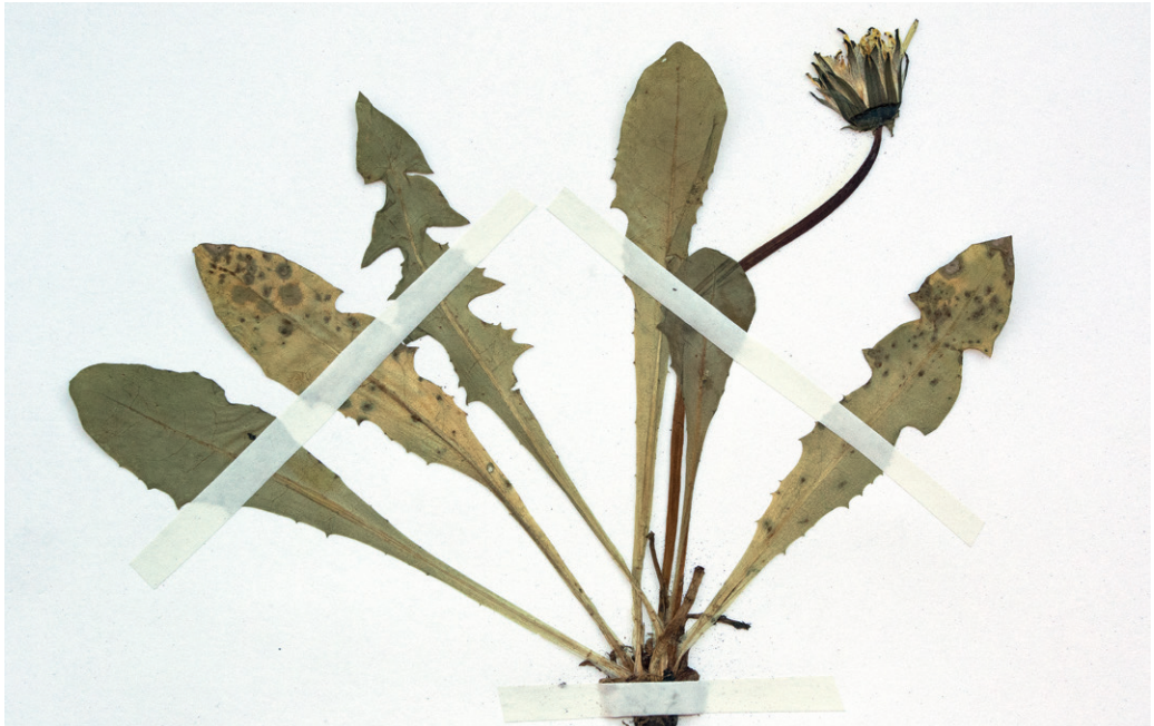
Abb. 3: Taraxacum saasense von Obertauern aus dem Hb. Stöhr Nr. 7470. — Fig. 3: Taraxacum saasense from Obertauern, Hb. Stöhr Nr. 7470.

Pinzgau: Fuschertal, Schneeboden bei der Fuscherlacke, 8842/4, 29.8.1972, leg. H. Wagner, det. O. Stöhr & P. Pilsl (SZU); – Pinzgau: Uttendorf, Stubachtal, Übelkar, Silikatschuttflur, ca. 2280 msm, 8841/4, 9.7.2007, leg. O. Stöhr, det. I. Uhlemann; – Pinzgau: Hohe Tauern, Felbertal, Weg von der St. Pöltener Hütte (= Felbertauernpass) auf den Tauernkogel, Silikatschutt, ca. 2800 msm, 8840/2, 17.8.2004, 12°29'24" E 47°09'24" N, leg./det. P. Pilsl; – Pinzgau: Raurisertal, Vorfeld des Goldbergkees, Geröll, 2202 msm, 8943/2, 27.7.2008, leg. W. Diewald, det. I. Uhlemann (Hb. W. Diewald); – Lungau: Hafnergruppe, Murwinkel, Vorderer Schober, Schrovinkar, von Felsblöcken durchsetzte alpine Rasen am Schrovimbach, ca. 2000 msm, 8846/3, 26.7.2009, 13°24'24" E 47°06'56" N, leg. P. Pilsl, det. O. Stöhr.