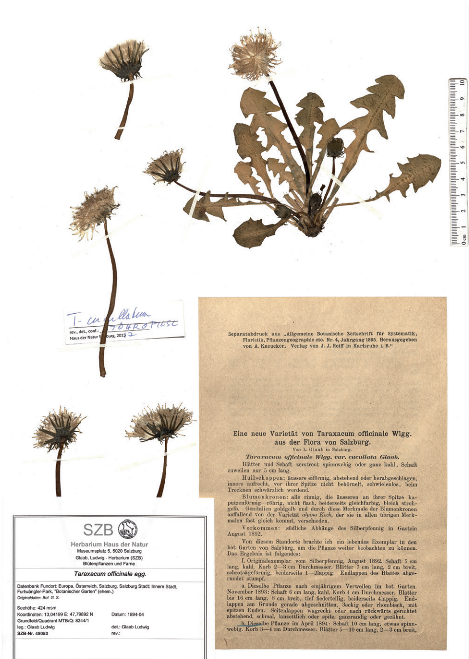
Abb. 6: Typusbeleg von Taraxacum officinale var. cucullata (SZB). — Fig. 6: Type specimen of Taraxacum officinale var. cucullata (SZB).