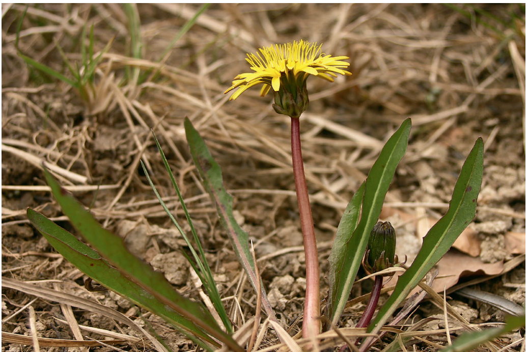
Abb. 11: Habitus von Taraxacum bavaricum , Uferzone des Hintersees. — Fig. 11: Habitus of Taraxacum bavaricum , shore of lake Hintersee.

Neu für Salzburg. Taraxacum madidum ist durch eine V-förmige Hülle, schmale, eng anliegende und lanzettliche äußere Hüllblätter sowie verlängerte Blattendlapfen charakterisiert (KIRSCHNER & ŠTĚPÁNEK 1998; UHLEMANN & al. 2005). Aus Österreich war die Art bislang nur aus den Nördlichen Kalkalpen Nordtirols (v. a. KIRSCHNER & ŠTĚPÁNEK 1998; SCHMID 2003) und Oberösterreichs (Diewald in