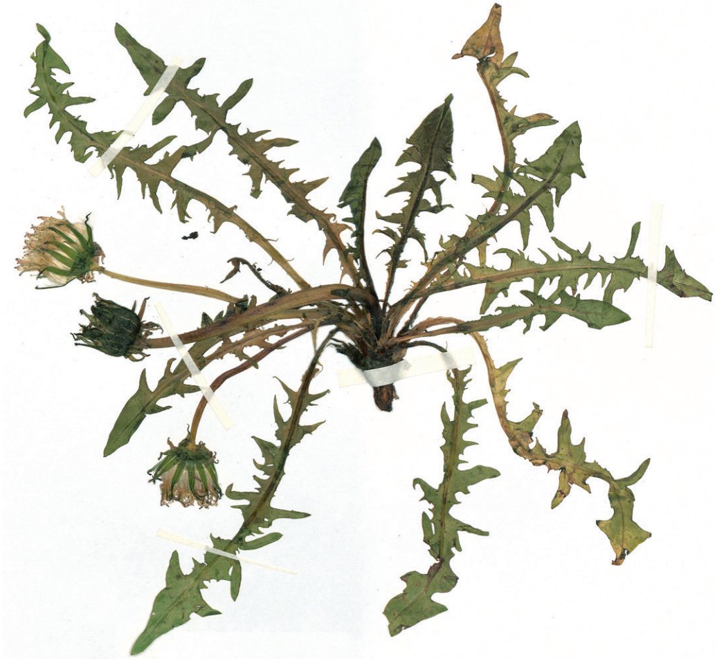
Abb. 7: Taraxacum tirolense vom Krimmler Achenal aus dem Hb. Pilsl Nr. 23470. — Fig. 7: Taraxacum tirolense from Krimmler Achenal, Hb. Pilsl Nr. 23470.

In der floristischen Literatur über Salzburg sind lediglich folgende Angaben für Taraxacum laevigatum agg., nicht jedoch Nachweise für Arten der heutigen sect. Erythrosperma zu finden: HANDEL-MAZZETTI (1907): Salzburg, leg. A. Braun (Beleg in B); SAUTER (1863): Feldraine bei Leogang und Maria Alm (vgl. auch SAUTER 1879 sub Taraxacum taraxacoides ); SCHWAIGHOFER (1951): Kleinarltal, Achenrain zwischen Stadlerhaus und Botenwirtsbrücke und Schwabmühlbachl; VIERHAPPER (1935): Trockenwiesen in Muhr und Straßenrand in Schellgaden im Murwinkel. Die Angaben von VIERHAPPER (1935) und jene bei Leogang von SAUTER (1863) wurden von WITTMANN & al. (1987) im Salzburger Verbreitungsatlas quadrantiert, zusätzliche Funde sind dort nicht angeführt. Die