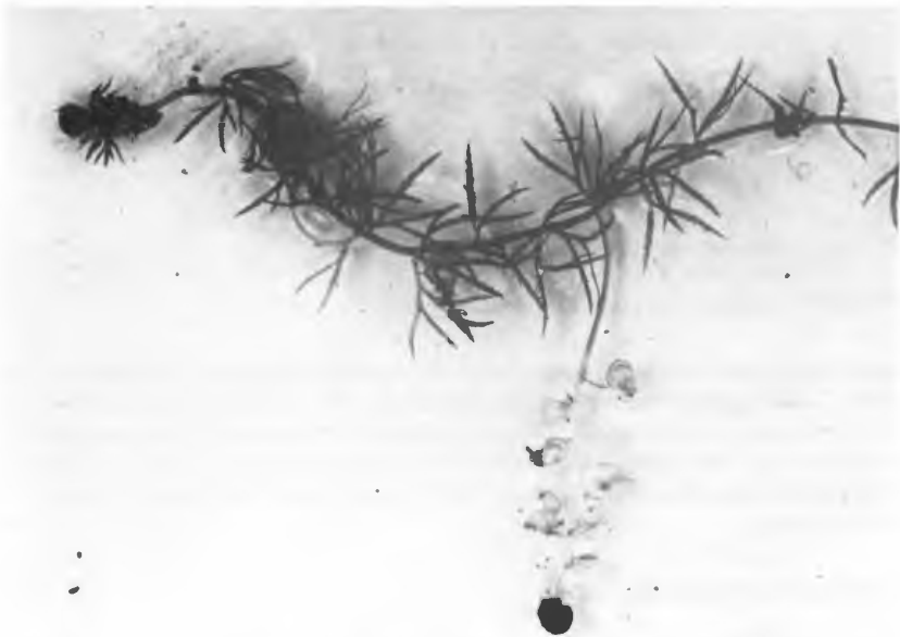
Abb. 2: Belegexemplar von Utricularia ochroleuca aus dem NSG „Langenbergteich“ (leg. et det. B. Esser, Oktober 1985)