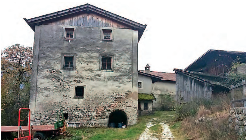
Vom uralten Hochhieb-Hof in Partschins nahe Meran bezogen die Salzburger Erzbischöfe einst Wein.

Von Partschins sind es keine zehn Kilometer ins sonnenverwöhnte Meran, das mehrfach Bezüge