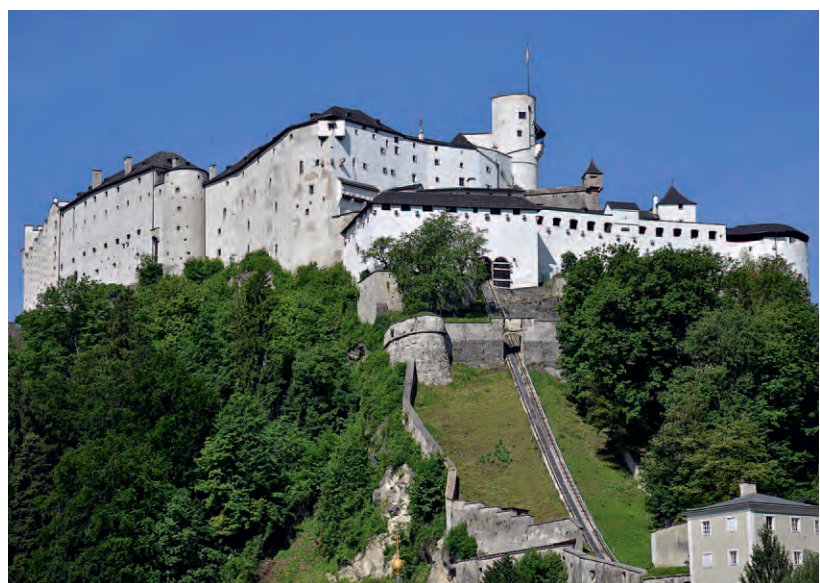
Festung Hohensalzburg im Landschaftsschutzgebiet Mönchsberg-Rainberg; Aufnahme von Osten.

Laufe der Jahrhunderte immer weiter ausgebaut wurde. Heute ist sie ein Tourismusmagnet mit rund einer Million Besuchern im Jahr. Neben dem Bauwerk selbst sind das Festungsmuseum, die prachtvollen Fürstenzimmer und das im Vorjahr nach modernen, museumsdidaktischen Grundsätzen völlig neu gestaltete Rainer-Regimentsmuseum die Hauptattraktionen. Seit 1892 ist die Festung bequem mit der Festungsbahn aus der Salzburger Altstadt zu erreichen. Zahlreiche Veranstaltungen wie die bekannten Festungskonzerte,