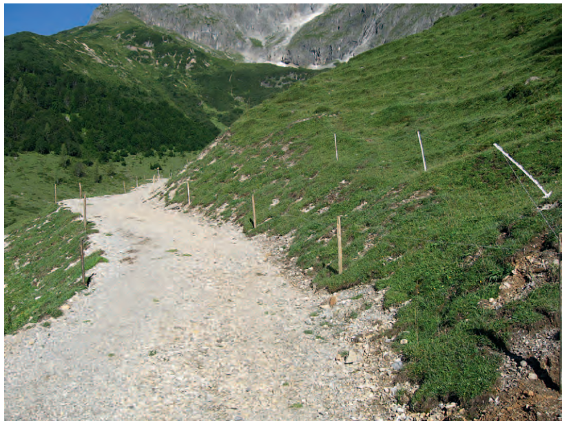
Vorausschauende Planung beim Wegebau schließt auch die Auszäunung frisch rekultivierter Böschungen gegen Viehvertritt ein, um den Erfolg der Begrünung langfristig zu sichern.