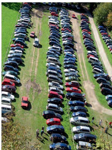
Flächeninanspruchnahme durch Individualverkehr (Bild: H. Hinterstoisser).