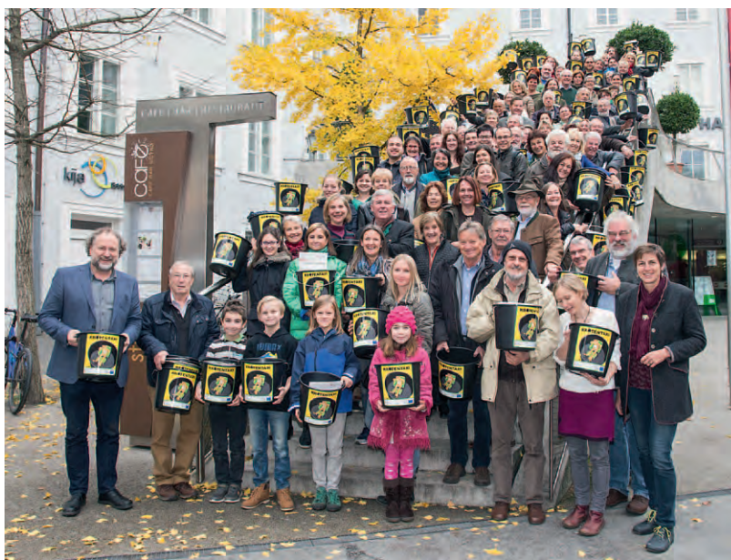
Ehrung der Froschsammler im Haus der Natur mit Landeshauptmann-Stellvertreterin Astrid Rössler Workshop „Amphibienschutz an Straßen“ im Haus der Natur. Die TeilnehmerInnen erhielten Amphibienkübel für den sicheren Transport der Tiere.

Straßengefahren zu schützen. Mehr als 150 ehrenamtliche Betreuerinnen und Betreuer sammeln die Amphibien an den Zäunen ein und bringen sie sicher über die Straße.