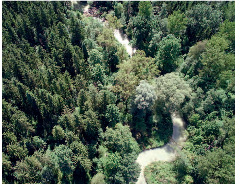
Drohnen-Schrägluftaufnahme: Der Reitbach in der Weitwörther Au.

Dabei geht es insbesondere um die Renaturierung des Ausees und des Reitbachs einschließlich der sogenannten „Vorlandabsenkungen“ sowie um Auwald-Naturschutzmaßnahmen. Begleitend erfolgt die intensive Abstimmung mit Behörden, Fachleuten, Gemeinden und InteressensvertreterInnen.