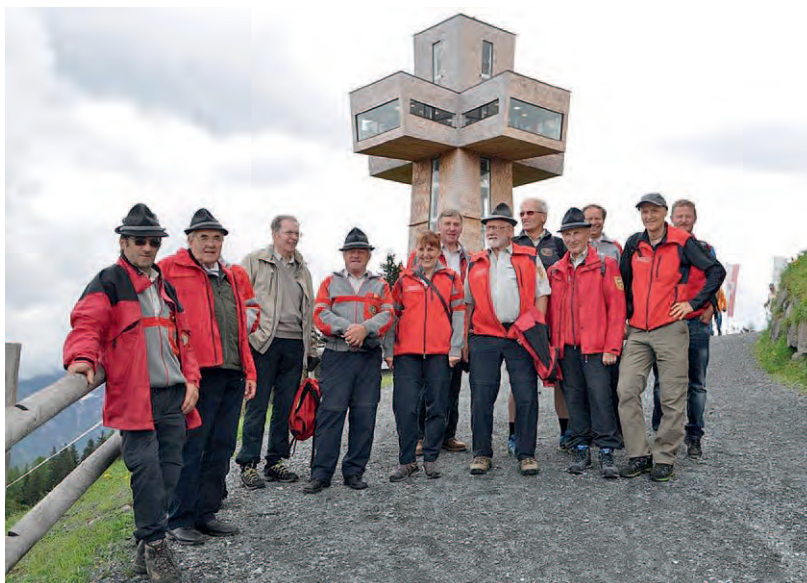
Jakobskreuz (alle Bilder: W. Jagersberger).

meinsamen gemütlichem Einkehr im Berggasthaus, ging es wieder zurück in den Pinzgau. Auf der Heimfahrt machten wir auf Vorschlag der EG Unken/Lofer einen Abstecher zu einem versteckten Waldteil in Lofer/Scheffsnoth wo gerade ein seltenes Vorkommen der Sibirischen Schwertlilie in voller Blüte stand. Eine gelungene Veranstaltung die neben Wissensvermittlung vor allem Eines war - ein schöner Tag mit Gleichgesinnten und Pflege der Kameradschaft.