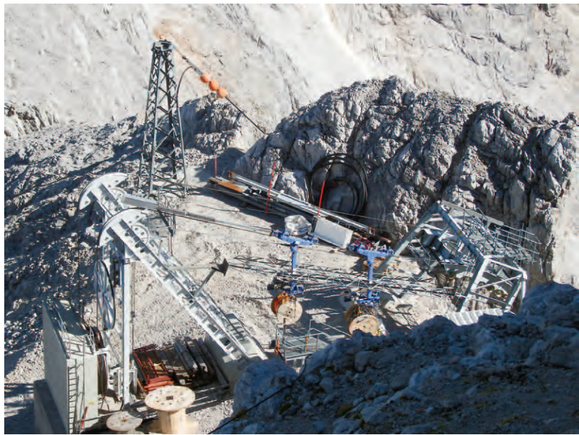
Für den Schisport vergewaltigte Bergnatur.

In den eineinhalb Jahren, seit Bestehen des neuen Fachplanes für Skipisten und Aufstiegsanlagen in Südtirol, standen bzw. stehen bereits bei mehreren Skigebieten signifikante Erweiterungen ausserhalb der genehmigten Skizonen an, so etwa im Vinschgau der Zusammenschluss der beiden Skigebiete Haider Alm - Schöneben, der grenzüberschreitende Zusammenschluss Kaunertal - Langtaufers, die Skigebietsweiterung im Schnalstal. Aber auch Projekte, wie die Erschließung der Seiser Alm von Kastelruth aus. Daneben stehen einige Projekte außerhalb der genehmigten Zonen in der Pipeline, der Zusammenschluss Speikboden - Klausberg, die Realisierung des grenzüberschreitenden Zusammenschlusses Sexten - Sillian, aber auch Ideen wie Aufstiegsanlagen von Villnöss in Richtung Seceda. „Ein Planungsinstrument führt sich selbst ad absurdum, wenn keine Planungssicherheit besteht und Projekte innerhalb als auch ausserhalb der im selben Plan ausgewiesenen Skizonen grundsätzlich genehmigungsfähig sind“, kritisiert Klauspeter Dissinger, Vorsitzender von CIPRA Südtirol. „In Deutschland existiert der bayerische Alpenplan, der gerade durch seine Einfachheit überzeugt. Dieser grenzt flächendeckend drei Raumtypen ab: Zone A mit intensiver Erschließung, Zone B mit Erschließung geringerer Intensität und Zone C ohne