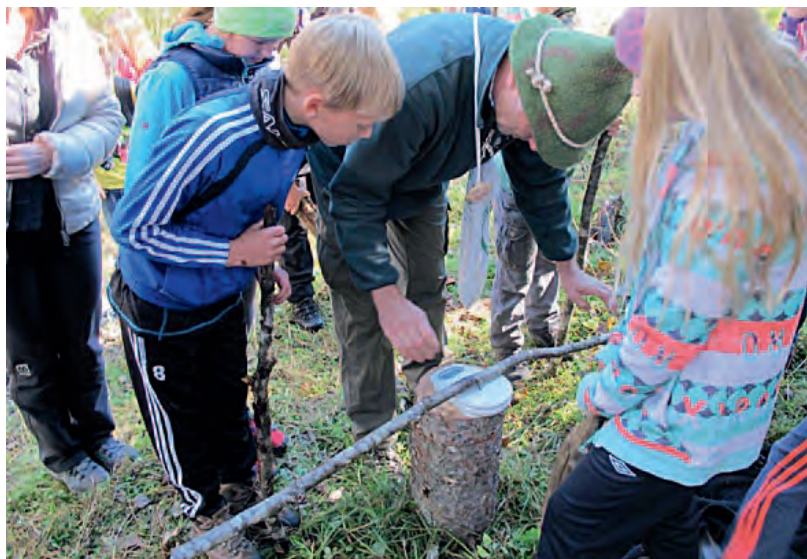
Wir suchen 1 kg Holz.

Seit 2011 veranstaltet der Landesforstdienst Salzburg Walderlebnistage. An einem Vormittag soll dabei einer möglichst großen Anzahl von Schülerinnen und Schülern von der 3. bis zur 6. Schulstufe die Möglichkeit geboten werden, den Wald in seiner Vielfalt besser kennen zu lernen. Die Konzentration auf einen Vormittag im Jahr brachte es mit sich, dass man von der „klassischen“ Waldpädagogik abgewichen ist und einen Stationsbetrieb aufziehen musste. Zudem konnte lediglich eine Veranstaltung pro Jahr organisiert und betreut werden. Daher kam jedes Jahr ein anderer Bezirk an die Reihe.