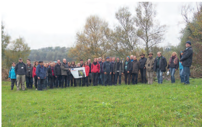
Naturschutzexperten aus Bayern lernten LIFE-Projekt Salzachauen kennen (Bild: Bernhard Riehl).