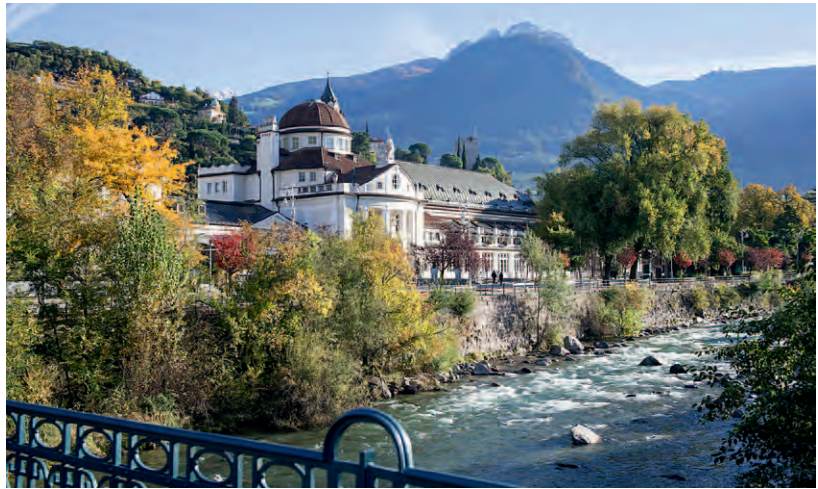
Passer statt Salzach, Ifinger statt Gaisberg? Meran, in den Südalpen gelegen, verbindet mit Salzburg eine lebendige Städtepartnerschaft: Passer mit Blick auf das Kurhaus.

Bereits im 8. Jahrhundert wurde das bis 1964 bestehende Bistum Brixen unter Kaiser Karl dem Großen den Salzburger Erzbischöfen unterstellt. Ursprünglicher Bistumssitz war das Kloster Säben, das sich südlich von Brixen bei Klausen spektakulär auf einem Felsen im Eisacktal erhebt und seit 1685 Benediktinerinnen mit Stammkloster auf dem Salzburger Nonnberg beherbergt. Mit Brixen lassen sich weitere Zusammenhänge herstellen. Als Ignaz von Spaur zum Weihbischof von Brixen geweiht wurde, komponierte Wolfgang Amadeus Mozart 1776 die anfänglich auch nach ihm benannte Spaur-Messe, die heute als Piccolomini-Messe bekannt ist.