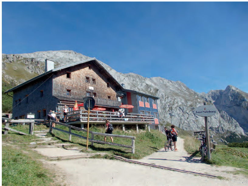
Direkt an der Grenz zwischen Salzburg und Bayern und an der Grenze zum Natur- und Europaschutzgebiet Kalkhochalpen: das Stahlhaus.

Der Vertragsunterzeichnung waren mehrjährige Vorbereitungsarbeiten vorangegangen, die sich beispielsweise intensiv mit der Verkehrsplanung im Alpenraum auseinandergesetzt haben. Projekte wie die „Allemagna-Autobahn“ und die damit verbundene Verschärfung der Transitproblematik konnten abgewendet und so die hohe Lebensqualität im