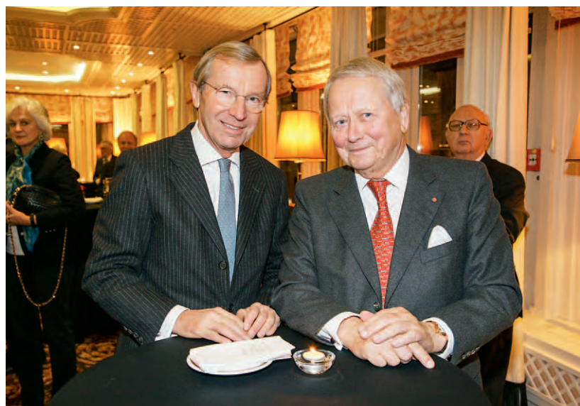
Jahresempfang Consularisches Corps im Sacher Salzburg.

Die Bedeutung Salzburgs zeigt sich darin, dass die Landeshauptstadt Sitz zahlreicher konsula-