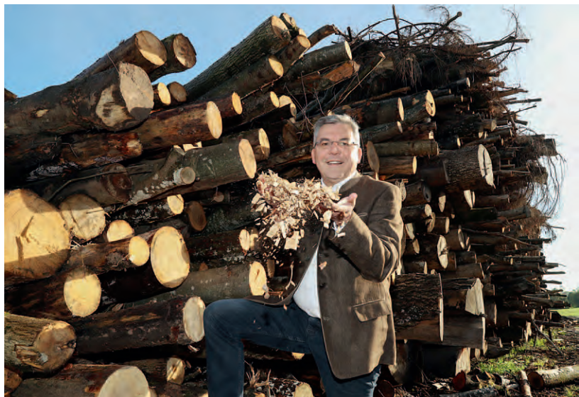
Landesrat Josef Schwaiger bei der Besichtigung des Biomasse-Heizwerkes in Eugendorf, Nahwärme Eugendorf. Im Bild Josef Schwaiger vor Holzhaufen, Hackschnitzel, Biomasse, Hackgut.

immens. Es kamen jährlich etwa zehn Anlagen hinzu. 2009 wurde die 100. Biomasse-Nahwärmanlage eröffnet. Derzeit sind 151 Biomasse-Nahwärmeversorgungen im Land Salzburg in Betrieb. Diese versorgen mit einer Leistung von 520 Megawatt auf knapp 600 Kilometern Fernwärmenetz rund 10.000 Objekte bequem und zuverlässig mit Wärme aus der Region. 90 von 119 Salzburger Gemeinden, das sind drei Viertel, verfügen über eine Nahwärmeversorgung aus heimischen Wäldern oder industrieller Abwärme. LK