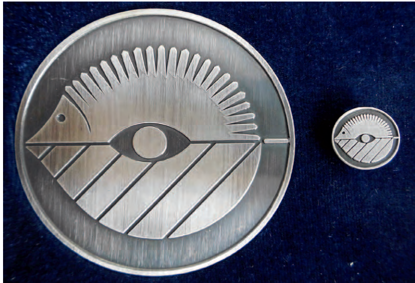
Medaille und Sticker zum Salzburger Umwelt-Verdienstzeichen.

Salzburg; oder per E-Mail: natur-umwelt-gewerbe@salzburg.gv.at zu richten. H.H.