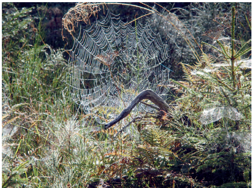
Jeder Organismus hat seine unverzichtbare Funktion im Ökosystem.