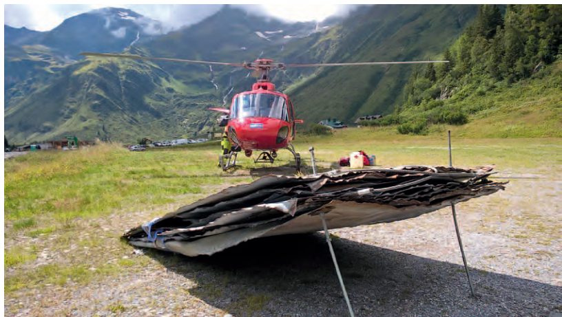
Entsorgung Blechplatten Bockartsee (Bild: H. Hinteregger).

BL Heinz Hinteregger Berg und Naturwacht Pongau