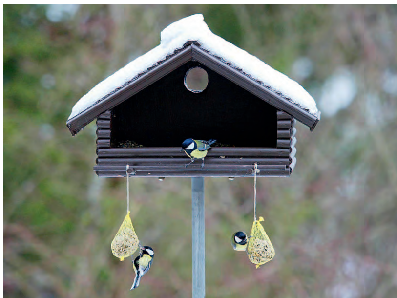
Tipps für die richtige Vogelfütterung im Winter.