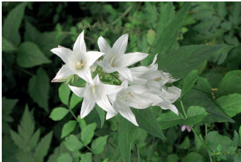
Abb. 4: Häufig findet man in den tieferen Lagen des NWR Wiedrechtshausenwald; die Breitblatt-Glockenblume ( Campanula latifolia, durchwegs in der ansonsten seltenen weißblühenden Form.