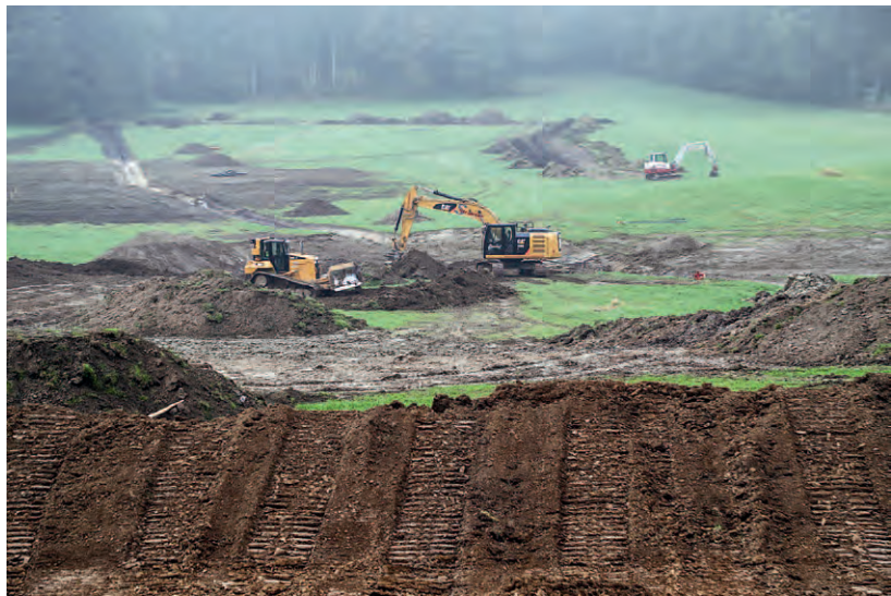
Flurbereinigung in der Gemeinde Nußdorf am Haunsberg.

In Reinharting wird eine Gesamtfläche von 91 Hektar, das entspricht rund 127 Fußballfeldern, mit 24 Grundeigentümern und vier hauptbetroffenen Landwirten zeitgemäß strukturiert. Die jetzt bestehenden 257 Grundstücke werden um 60 Prozent reduziert. Die Baukosten betragen rund 572.000 Euro. 2,8 Kilometer neue Wirtschaftswege werden errichtet, die vielen entbehrlichen alten Wege werden rückgebaut. Darüber hinaus erfolgen die Verrohrung von rund 1,5 Kilometer alten Entwässerungsgräben und