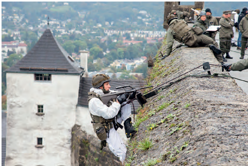
Gebirgsjäger erklimmen die Festung.

Mitarbeiterinnen und Mitarbeiter des Bundesheeres auf den Plätzen der Salzburger Altstadt ihre Ausrüstung und ihre Fahrzeuge und Geräte: Panzer, Sonderfahrzeuge, Pioniergeräte, Luftraumüberwachung und Fliegerabwehr. Soldatinnen und Soldaten der Führungsunterstützung, Logistik, Sanitäterinnen und Sanitäter sowie Militärstreife zeigen ihre Einsatzgebiete und ihr Können.