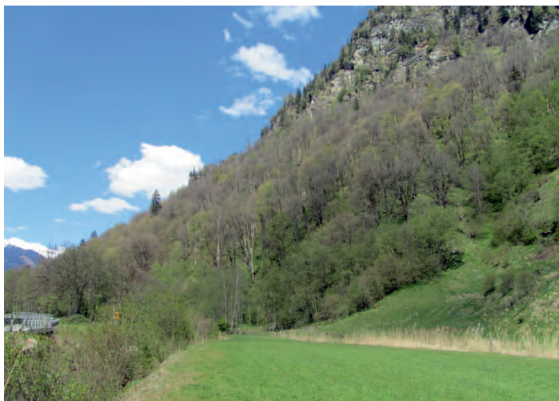
Abb. 1: Blick auf das Naturwaldreservat vom Süden her gesehen; der Laubaustrieb beginnt.

Wie für das Carici pendulae-Aceretum typisch befindet sich der Waldbestand des Naturwaldreservats Wiedrechtshausenwald auf einem sehr frischen bis feuchten