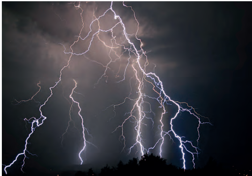
2007 blitzte es in Salzburg besonders oft. Fast 30.000 Blitze wurden registriert.

Jetzt wird es gefährlich. Ein besonders blitzreiches Jahr in Salzburg war 2007. Hier gab es mit mehr als 28.500 registrierten Blitzen aus Wolken auf die Erde fast doppelt so viele wie im Durchschnitt, allein am 20. Juni waren es sagenhafte 6.118 Blitze. Extreme „Hotspots“ sind künstliche Formen wie Gipfelkreuze oder Sendemasten, die Blitze anlocken. „In den Sender auf dem Gaisberg schlugen pro Jahr bis zu 100 Blitze ein, 24 allein am 1. März 2008“, berichtet Blitzexperte Gerhard Diendorfer vom Österreichischen Blitzortungs- und -forschungssystem ALDIS. Beim Wind ist es wiederum im Hochgebirge extremer: 243 Kilometer pro Stunde wurden am 14. Dezember 1998 auf dem Sonnblick gemessen, absolut kein Flugwetter herrschte im Flachland am 19. Jänner 2007, als Orkan Kyrill mit 139 Kilometer pro Stunde am Salzburger Flughafen vorbeipfiff.