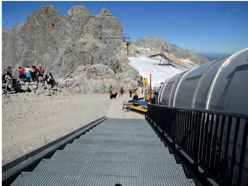
Der CIPRA ist es seit jeher ein Anliegen, zerstörerische Auswüchse des Massentourismus in den Alpen zu beschränken, um diese als Lebens- und Erholungsraum zu bewahren (Bild: H. Hinterstoisser).

Natur und Landschaft in ihrer Gesamtheit dauerhaft gesichert werden, Tourismus und Freizeit - mit dem Ziel, die touristischen und Freizeitaktivitäten mit den ökologischen und sozialen Erfordernissen in Einklang zu bringen, insbesondere durch Festlegung von Ruhezeiten Verkehr - mit dem Ziel, Belastungen und Risiken im Bereich des inneralpinen und alpenquerenden Verkehrs auf ein Maß zu senken, das für Menschen, Tiere und Pflanzen sowie deren Lebensräume erträglich ist, unter anderem durch eine verstärkte Verlagerung des Verkehrs, insbesondere des Güterverkehrs, auf die Schiene, vor allem durch die Schaffung geeigneter Infrastrukturen und marktconformer Anreize, ohne Diskriminierung aus Gründen der Nationalität, Energie - mit dem Ziel, eine natur- und landschaftsschonende sowie umweltverträgliche Erzeugung, Verteilung und Nutzung der Energie zu erreichen und energieeinsparende Maßnahmen zu fördern.