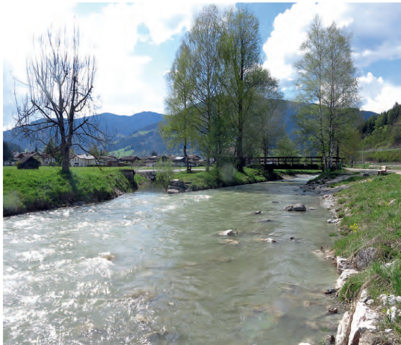
Hochwasserschutz Altenmarkt.

Die Broschüre „ Ökologie im Hochwasserschutz. Eine Reise an den Flüssen Salzburgs “ zeigt neben dem Projekt in Altenmarkt im Pongau noch 21 weitere ausgewählte Beispiele, in denen gelungene ökologische Maßnahmen bei Hochwasserschutz-Projekten umgesetzt wurden. Die Broschüre kann per E-Mail an schutzwasserwirtschaft@salzburg.gv.at kostenlos bestellt werden.