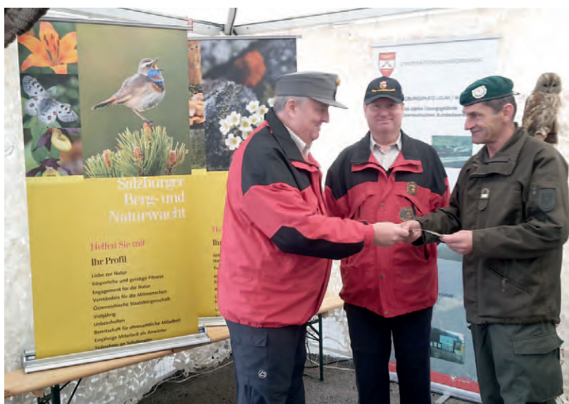
Im Umwelt-Informationszelt bei der Heeres-Leistungsschau am Residenzplatz.

Auch die beteiligte sich die Salzburger Berg- und Naturwacht an der Leistungsschau des Österreichischen Bundesheeres. Ein ei-