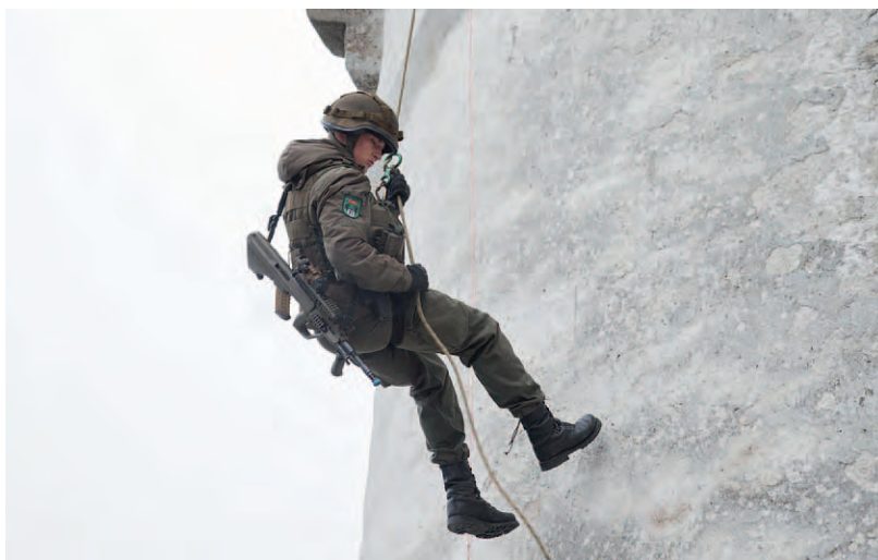
Luftlandetruppen seilen sich vom Festungsturm ab.

Die Leistungsschau am Nationalfeiertag 2016 war die größte bisher in der Salzburger Innenstadt abgehaltene Veranstaltung des Bundesheeres. Anlass dafür