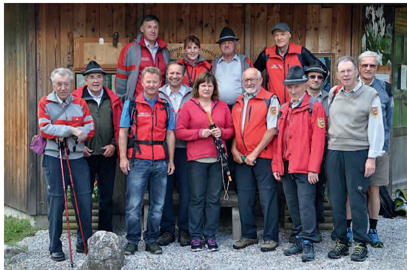
Exkursionsgruppe der BNW Pinzgau