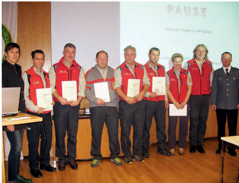
LH-Stv. Dr Astrid Rössler mit den 2016 neu vereidigten Naturschutzwachorganen.

Naturschutz ist aber auf verlorenem Posten, wenn die Raumordnung nicht stimmt. Der Flächenverbrauch ist immer noch stark ansteigend. Das führt nicht nur zu Bodenverlusten, sondern auch zur Verunmöglichung von Biotopverbund sowie zunehmenden Problemen mit steigendem Verkehr und dem Versäumen der Klimaziele. In diesem Zusammenhang rief die LH-Stv. zu einer drastischen Senkung des Energieverbrauchs auf.