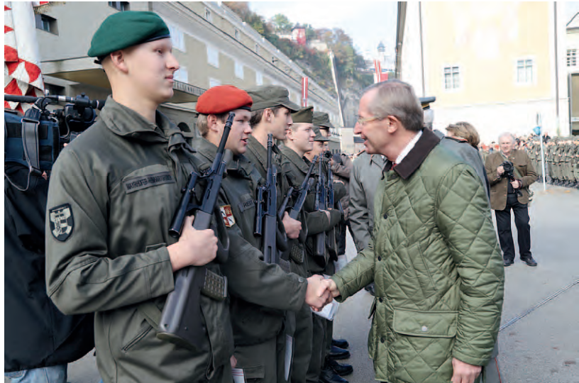
Leistungsschau des Österreichischen Bundesheeres am Nationalfeiertag in der Altstadt von Salzburg aus Anlass des Jubiläums „200 Jahre Salzburg bei Österreich“ die Angelobung von mehr als 500 Rekruten vor dem Festspielhaus. Im Bild Landeshauptmann Wilfried Haslauer mit den Rekruten.

„Heute ist ein großer Tag für unsere jungen Rekruten. Sie sind hier mitten in der Salzburger Altstadt bei der großen Leistungsschau am Nationalfeiertag angetreten, um das Treuegelöbnis abzulegen und deutlich zu zeigen, dass die Begriffe Treue, Vaterland, Heimat sowie Schutz und Hilfe für die Republik Österreich und das österreichische Volk keine leeren Worthülsen sind“, sagte Landeshauptmann Wilfried Haslauer bei der Angelobungsfeier für 568 Rekruten auf dem Max-Reinhardt-Platz.