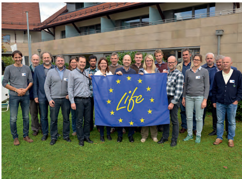
LIFE-Fachtagung in Anthering, Oktober 2016 (Bild: REVITAL).