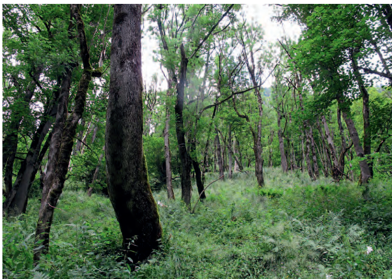
Abb. 2: Der Feuchte Bergahorn-Eschenwaldes der Assoziation Carici pendulae-Aceretum, Urtica -Subvariante im NWR Wiedrechtshausenwald ist meist häufig licht.