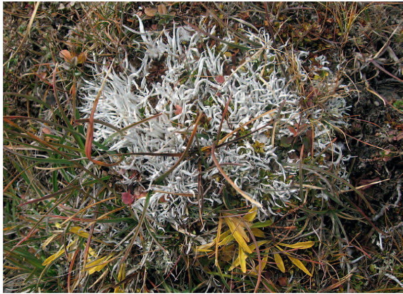
Biodiversität am Wegesrand: Totengebeinflechte (Thamnotia vermicularis) in den Nockbergen.

Nachmittags tagten 3 thematische Panele, welche sich mit der Verankerung der Biodiversität in der