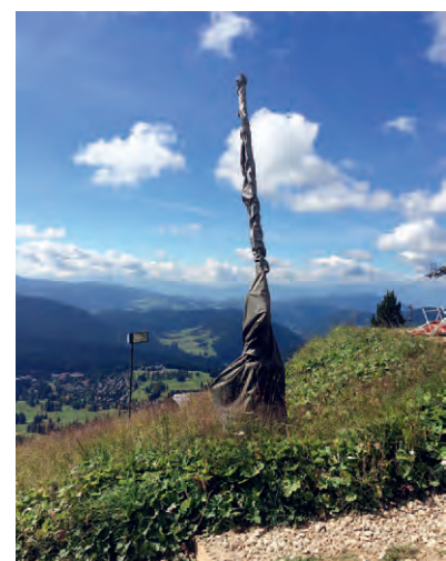
Sichtschutzplanen für stationäre Schneerzeuger.

Insbesondere in steilerem Terrain ist diese Entfernung nicht, oder nur mit großem Aufwand (Hubschraubertransport, Flurschäden) möglich. Aus diesem Grund verbleiben Schneerzeuger in Teil-