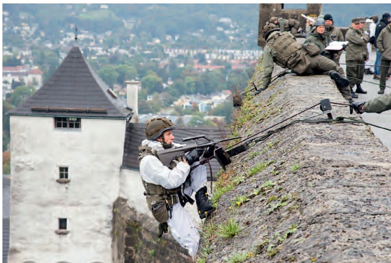
Gebirgsjäger erklimmen die Festung.

Mitarbeiterinnen und Mitarbeiter des Bundesheeres auf den Plätzen der Salzburger Altstadt ihre Ausrüstung und ihre Fahrzeuge und Geräte: Panzer, Sonderfahrzeuge, Pioniergeräte, Luftraumüberwachung und Fliegerabwehr. Soldatinnen und Soldaten der Führungsunterstützung, Logistik, Sanitäterinnen und Sanitäter sowie Militärstreife zeigen ihre Einsatzgebiete und ihr Können.