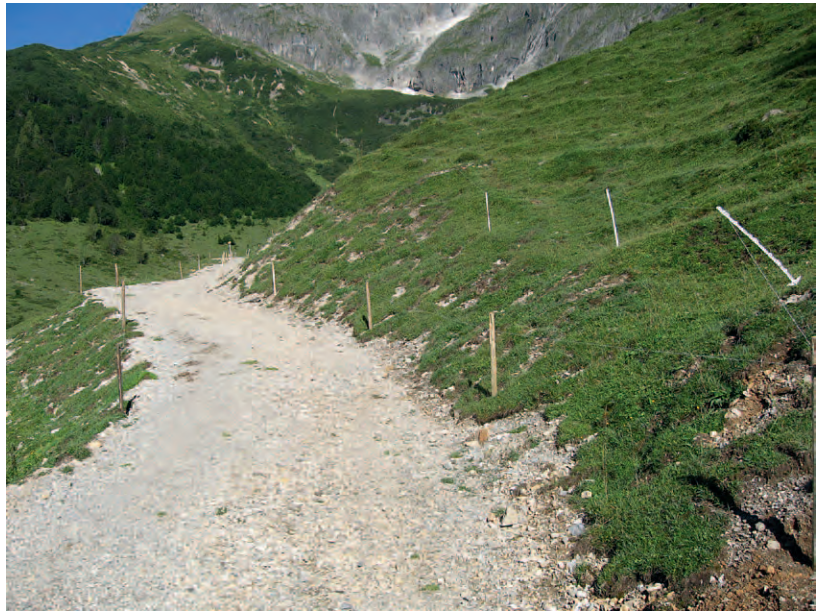
Vorausschauende Planung beim Wegebau schließt auch die Auszäunung frisch rekultivierter Böschungen gegen Viehvertritt ein, um den Erfolg der Begrünung langfristig zu sichern.