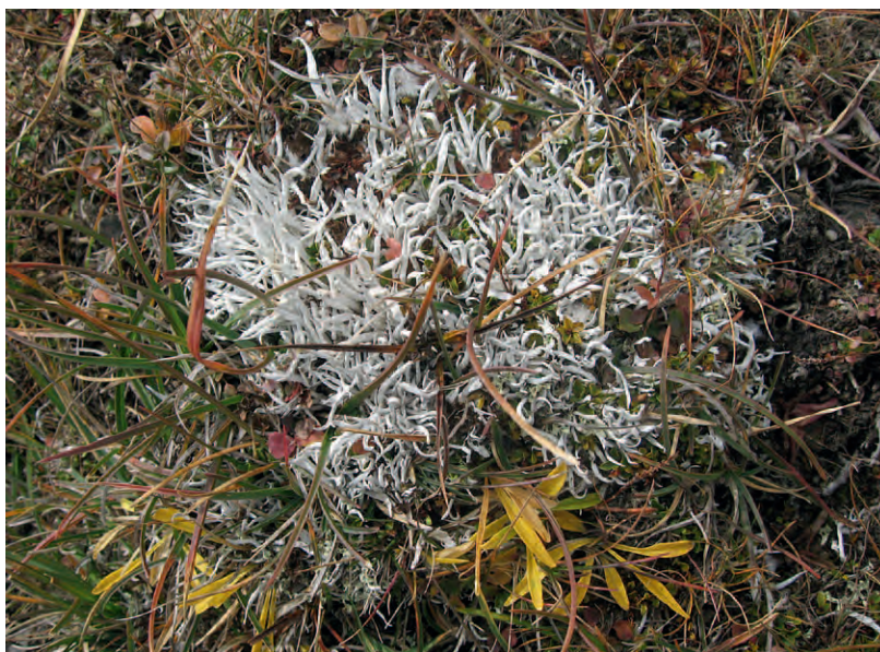
Biodiversität am Wegesrand: Totengebeinflechte (Thamnomia vermicularis) in den Nockbergen.

Nachmittags tagten 3 thematische Panele, welche sich mit der Verankerung der Biodiversität in der