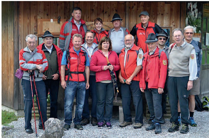
Exkursionsgruppe der BNW Pinzgau