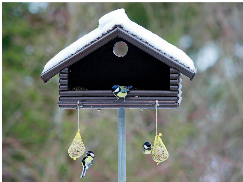
Tipps für die richtige Vogelfütterung im Winter.