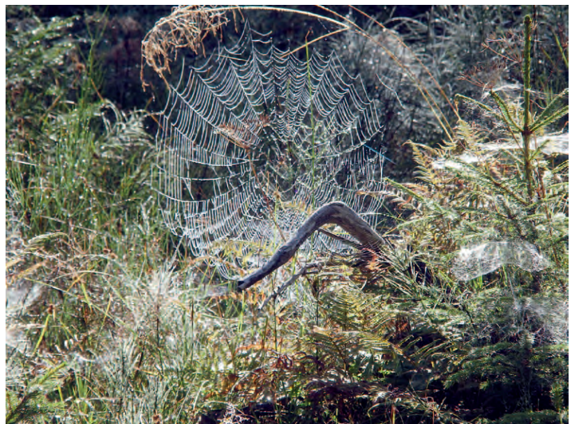
Jeder Organismus hat seine unverzichtbare Funktion im Ökosystem.