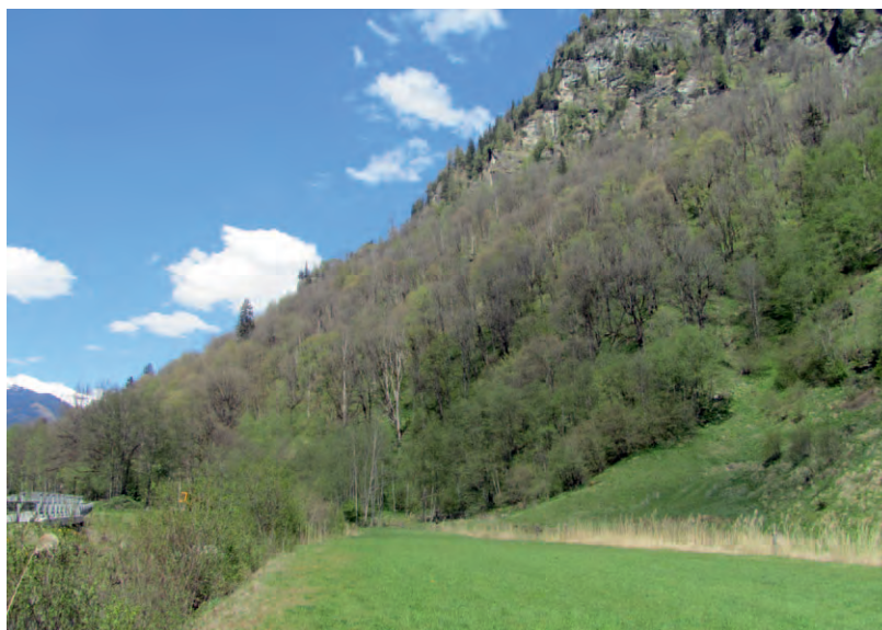
Abb. 1: Blick auf das Naturwaldreservat vom Süden her gesehen; der Laubaustrieb beginnt.

Wie für das Carici pendulae-Aceretum typisch befindet sich der Waldbestand des Naturwaldreservats Wiedrechtshausenwald auf einem sehr frischen bis feuchten