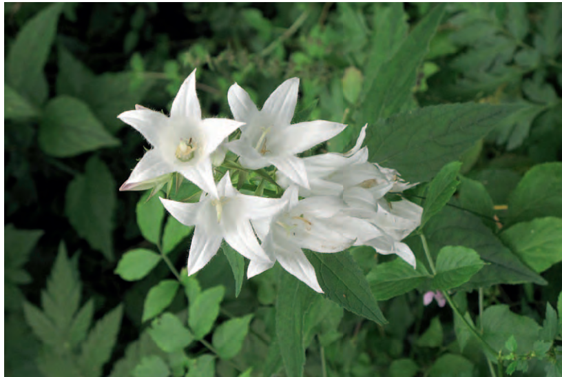
Abb. 4: Häufig findet man in den tieferen Lagen des NWR Wiedrechts-hausenwald; die Breitblatt-Glockenblume ( Campanula latifolia, durchwegs in der ansonsten seltenen weißblühenden Form.